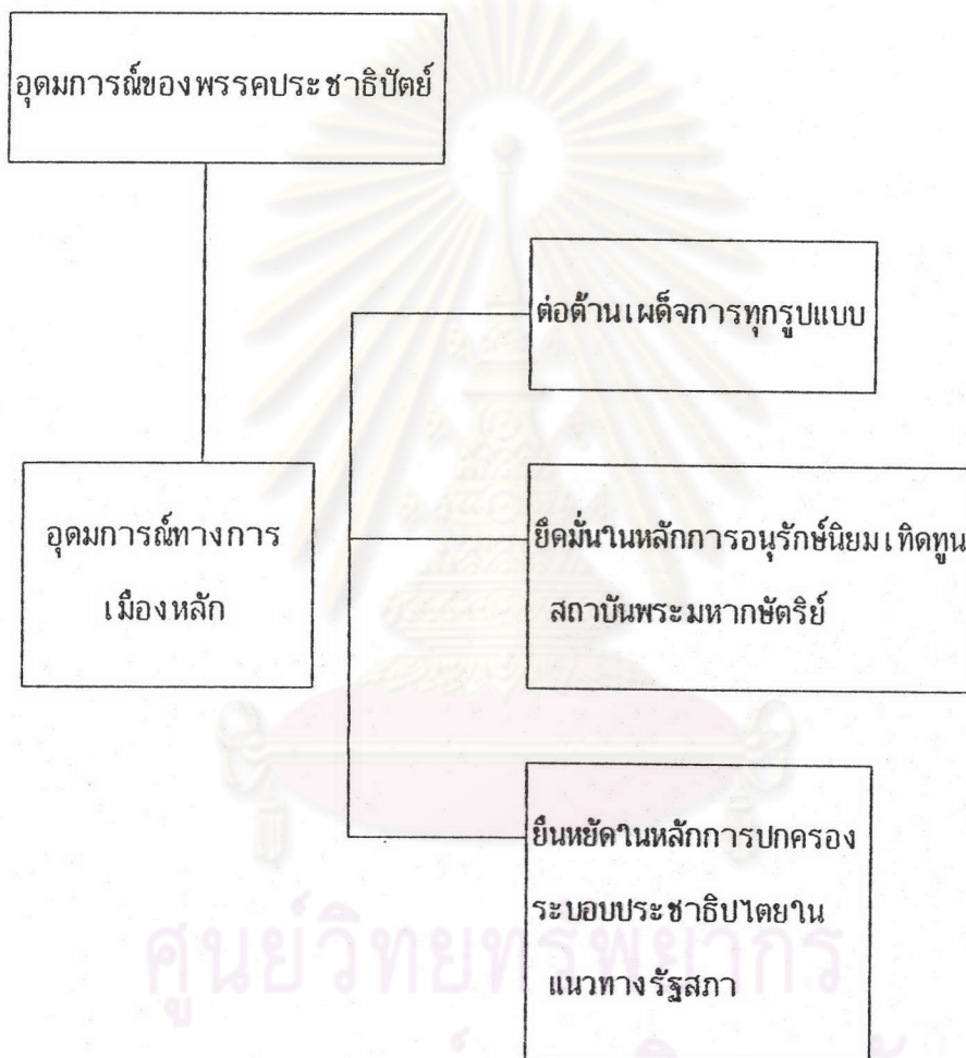
แผนภูมิที่ 1 รูปแบบอุดมการณ์ทางการเมืองของพรรคประชาธิปัตย์

ถูกยกเลิกไปโดยจอมพลสฤษดิ์ ธนะรัชต์ กระทำการปฏิวัติครั้งที่ 2 เมื่อวันที่ 20 ตุลาคม 2501 นับเป็นสถานที่ทำการพรรคแห่งสุดท้ายของพรรคประชาธิปัตย์ยุคนายควง เป็นหัวหน้าพรรค 13