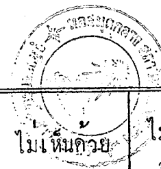
ตารางที่ 13 (ต่อ)