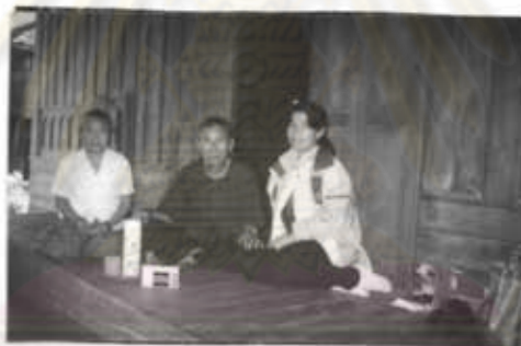
ภาพที่ 56 การบันทึกขณะสัมภาษณ์

และผู้วิจัยสัมภาษณ์ โดยการใช้เทปบันทึกเสียงช่วยทุกครั้งที่สัมภาษณ์