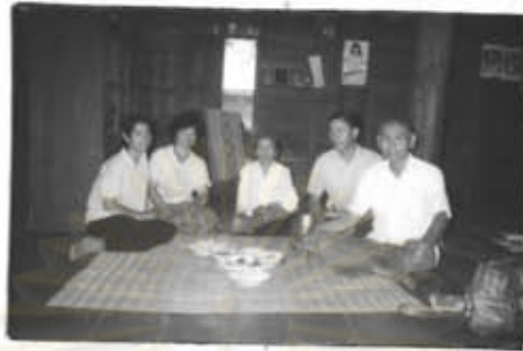
ภาพที่ 55 ร่วมรับประทานอาหารกับผู้ให้สัมภาษณ์

บางโอกาส ผู้วิจัยสัมภาษณ์จนถึงเวลารับประทานอาหาร ก็จะได้ร่วมรับประทานอาหารด้วย