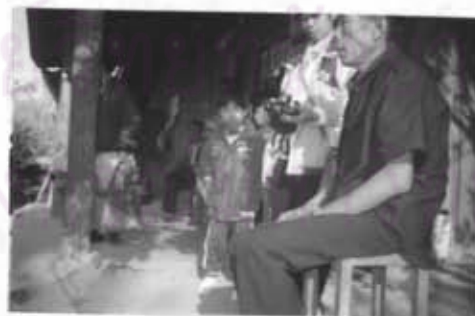
ภาพที่ 57 การสัมภาษณ์ผู้นำคณะรอรถก่อนที่ผู้นำจะไปประชุมที่อำเภอ