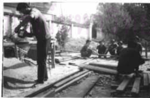
ภาพที่ 54 สัมภาษณ์ขณะที่ผู้ให้สัมภาษณ์ กำลังทำงาน

ในการสัมภาษณ์คณะกรรมการหมู่บ้าน ซึ่งผู้วิจัยได้เข้าไปสัมภาษณ์ เป็นกลุ่มและรายบุคคลนั้น การเข้าไปสัมภาษณ์ ถ้าเป็นขณะที่ผู้ให้สัมภาษณ์กำลังทำงานใด ๆ อยู่ ผู้วิจัยจะขอเข้าไปสัมภาษณ์โดยที่ไม่ทำให้ผู้ให้สัมภาษณ์ลำบากใจที่จะต้องหยุดทำงานมาเพื่อให้ผู้วิจัยสัมภาษณ์ โดยเฉพาะ