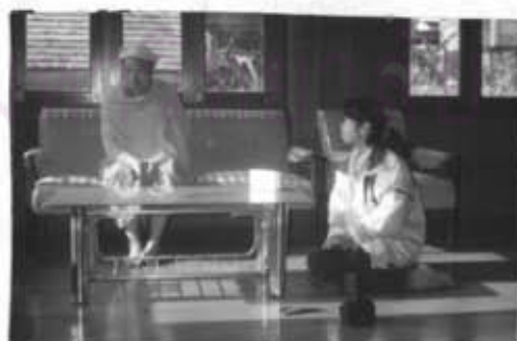
ภาพที่ 58 การสัมภาษณ์ผู้นำทางศาสนาของหมู่บ้านแม่ปะและหมู่บ้านแม่ขาน