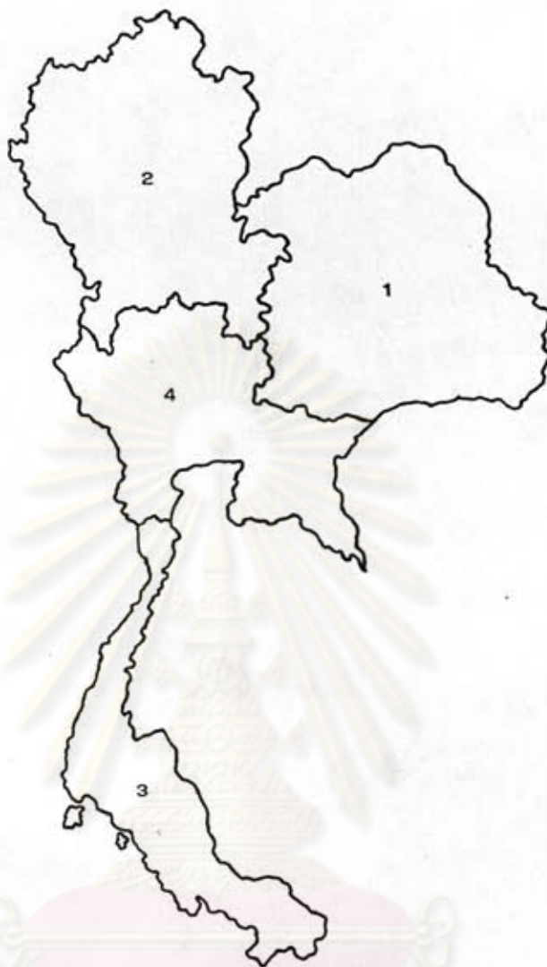
อัตราความยากจนของคนในชนบท ปี พ.ศ. 2522 แยกเป็นรายภาค