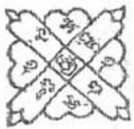
ธรรมมานุสละติ

๑ นะโมพุทธายะ โมพุทธายะ นะพุทธายะ นะโมชาละ นะโมพุทธะ นะโมพุทธา ชาระมิตัง โส ชาระมิตังสา ชาระมิตังสา