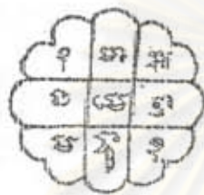
พุทธมานุสละติ

๑ นะโมพุทธายะ โมพุทธายะ นะพุทธายะ นะโมชาละ นะโมพุทธะ นะโมพุทธา ชาระมิตัง โส ชาระมิตังสา ชาระมิตังสา