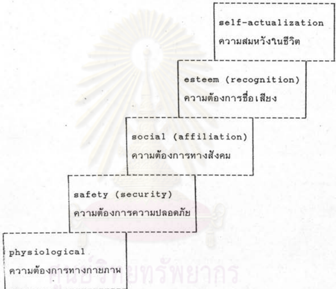
รูปที่ 2.2 ลำดับชั้นความต้องการของมนุษย์ตามแนวความคิดของ Maslow

(physiological needs) ความต้องการทางด้านความปลอดภัย (safety needs) ความต้องการทางด้านสังคม (social needs) ความต้องการที่จะมีสถานะเด่นหรือมีชื่อเสียง (esteem needs) ความต้องการความสมหวังในชีวิต (self-actualization needs)