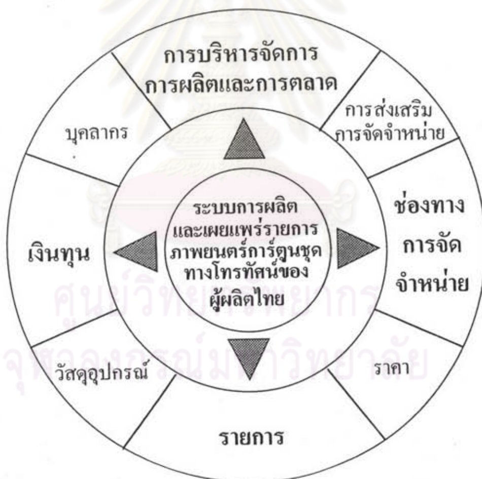
แบบจำลองที่ 2 ความสัมพันธ์ของปัจจัยในระบบการผลิตรายการภาพยนตร์การ์ตูนชุดทางโทรทัศน์แบบธุรกิจอุตสาหกรรม

โดยมีองค์ประกอบของการผลิตรายการภาพยนตร์การ์ตูนทางโทรทัศน์แบบระบบธุรกิจอุตสาหกรรมที่เป็นหลักสำคัญที่ครอบคลุมองค์ประกอบทั้งทางด้านสุนทรียศาสตร์ (Aesthetics) และทางด้านเทคโนโลยีการผลิต (Technology) ไว้ภายในองค์ประกอบเพียงองค์ประกอบเดียว คือ องค์ประกอบทางเศรษฐศาสตร์ (Economics) อันประกอบด้วยปัจจัยทางการผลิต (production) และปัจจัยทางการตลาด (marketing) ซึ่งผู้ผลิตแต่ละแบบทั้ง 3 แบบ มีปัจจัยการผลิตและการตลาดที่มีความสัมพันธ์กันอย่างต่อเนื่อง เช่นเดียวกัน โดยสามารถสรุปเป็นแบบจำลองการวิเคราะห์ความสัมพันธ์ของปัจจัยทางการผลิต และปัจจัยทางการตลาดของผู้ผลิตรายการภาพยนตร์การ์ตูนทางโทรทัศน์ในประเทศไทยได้ดังนี้คือ (แบบจำลองที่ 2)