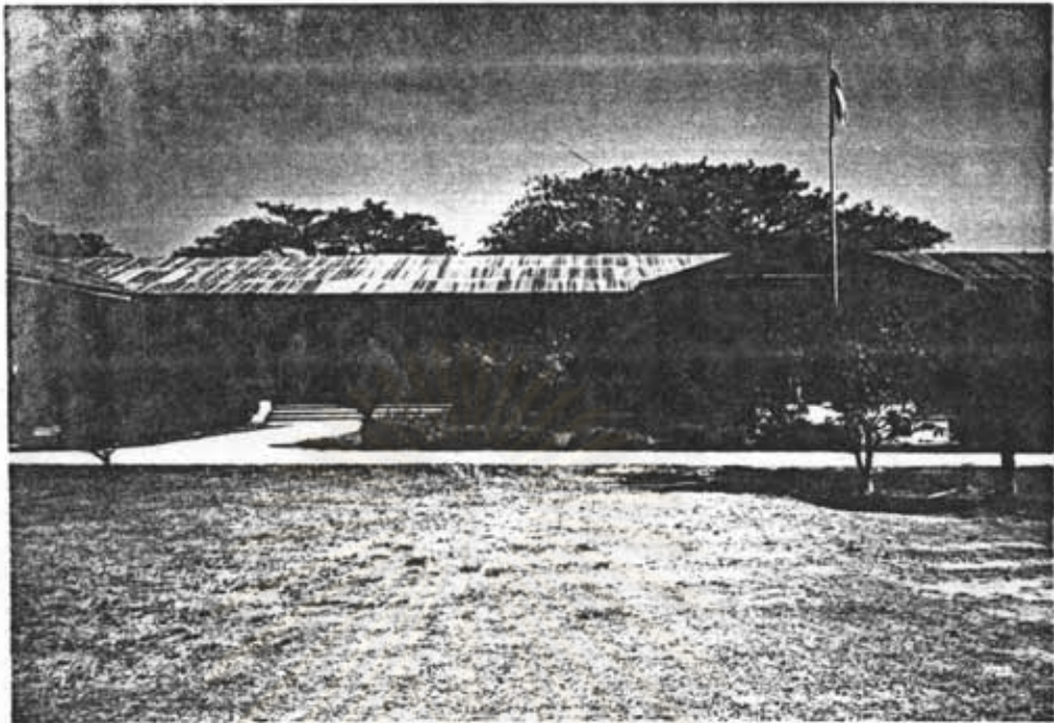
รูปที่ 9 อาคารบริเวณของโรงเรียนวัดคอนมะเกลือ