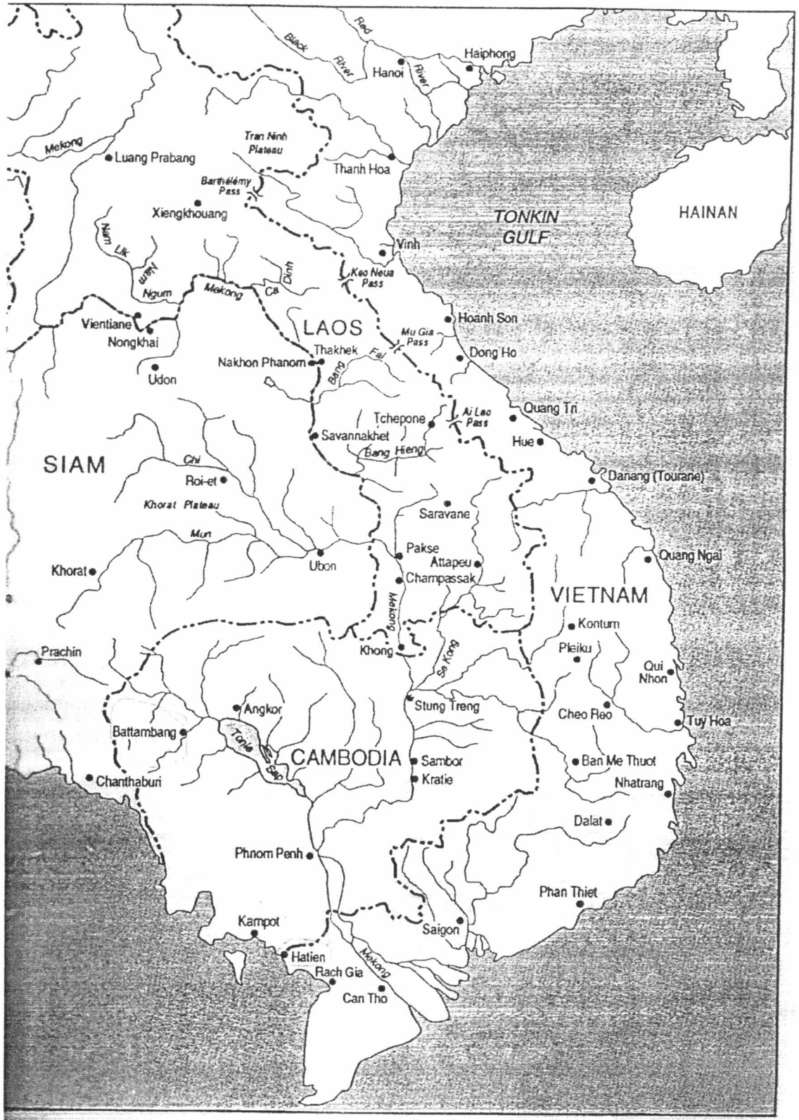
เมืองต่างๆในเขมร ลาว และเวียดนาม