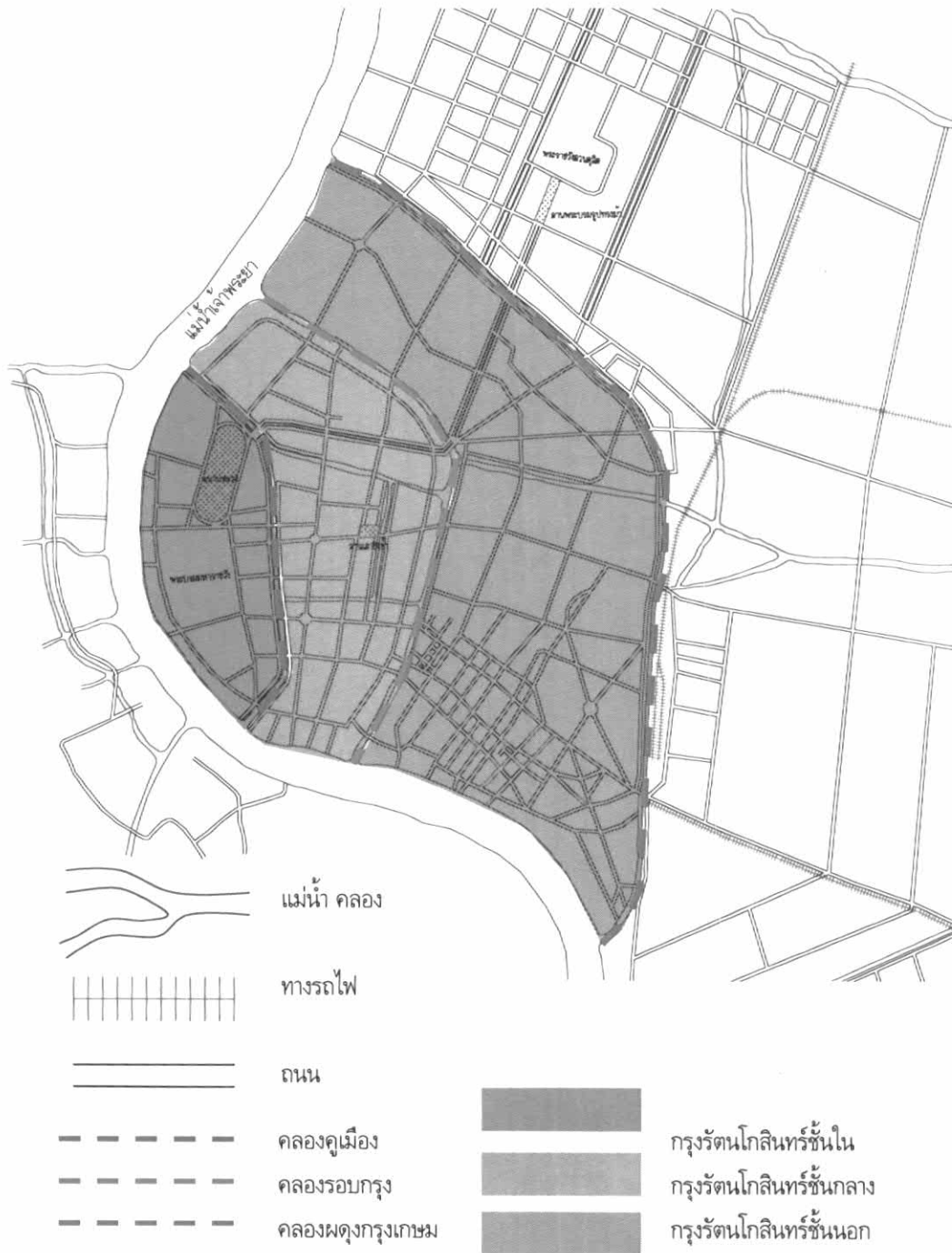
ผัง 8 - 3 แสดงตำแหน่งลานโล่งในเมืองในสมัยรัชกาลที่ 5

ลานโล่งในเมืองในสมัยรัชกาลที่ 5 มีลานโล่งที่สำคัญทั้งสิ้น 3 ลานโล่งด้วยกัน ซึ่งเป็นลานโล่งเดิมที่มีการปรับปรุง ได้แก่ ลานสนามหลวง ลานเสาชิงช้า และลานโล่งที่สร้างขึ้นใหม่ได้แก่ ลานพระบรมรูปทรงม้า จากการศึกษาสามารถสรุปสาระสำคัญของลานโล่งในเมืองในสมัยรัชกาลที่ 5 ได้ดังนี้