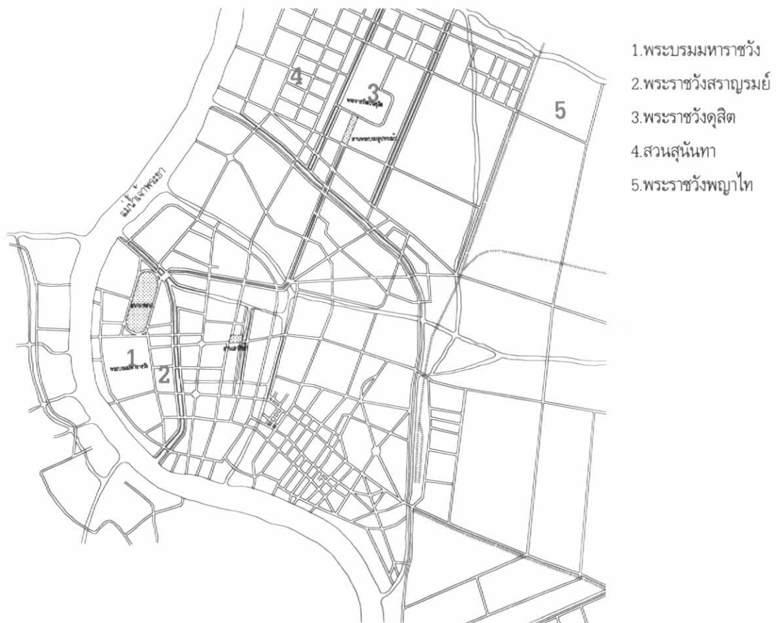
ผัง 8 - 4 แสดงตำแหน่งพระราชวังในพระนครที่ได้ทำการศึกษาในสมัยรัชกาลที่ 5

3. พระราชวังที่ได้สร้างขึ้นใหม่ในสมัยรัชกาลที่ 5 โดยที่เจ้าเมืองเป็นผู้สร้างถวายหรือข้าราชการชั้นผู้ใหญ่เสนอให้มีการจัดสร้างพระราชวัง ได้แก่ พระราชวังรัตนรังสรรค์ เมืองระนอง พระราชวังริมน้ำ เมืองราชบุรี พระราชวังบนเขาสัตนาท เมืองราชบุรี