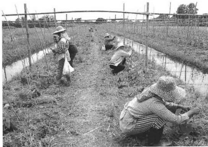
การเกษตรปลอดสารพิษใช้น้ำหมักชีวภาพ