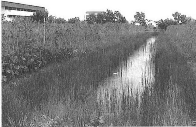
แปลงทดลองทำการเกษตรทฤษฎีใหม่ แปลงการใช้ประโยชน์พื้นที่ จุดสระกักเก็บน้ำสำรองไว้ใช้ในพื้นที่