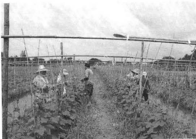
ใช้ดินมาร์ลร่วมกับการปลูกพืชแบบการเกษตรผสมผสานเพื่อปรับปรุงสภาพดินเปรี้ยว