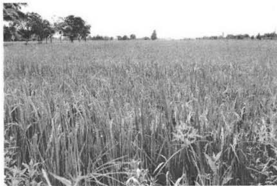
แปลงปลูกข้าวแบบล้มตอซังให้ผลผลิตมีคุณภาพลดการใช้ปุ๋ยและได้ผลผลิตต่อไร่ 70-90 ถัง