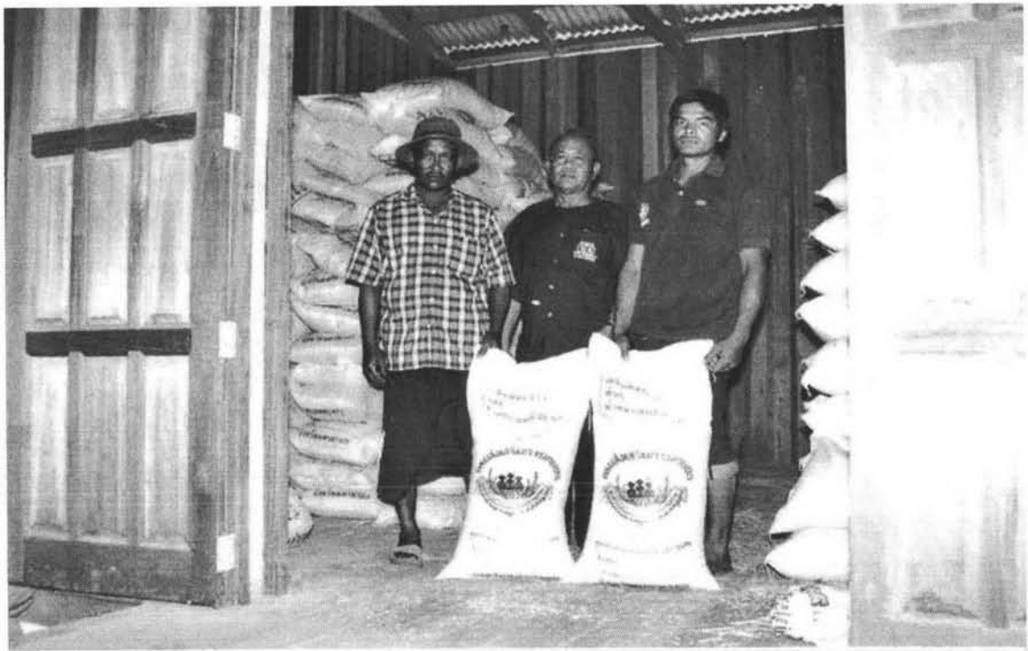
ผู้ทรงเก็บข้าวของศูนย์ข้าวชุมชน ตำบลพระอาจารย์ อ.องครักษ์ จ.นครนายก