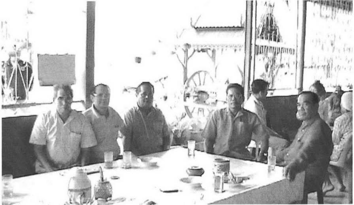
ชาวชุมชนตำบลพระอาจารย์ อ.องครักษ์ จังหวัดนครนายก มาชุมนุมกันที่หอกระจายข่าวของหมู่บ้านเพื่อแลกเปลี่ยนข่าวสารและปรึกษาปัญหาาร่วมกัน