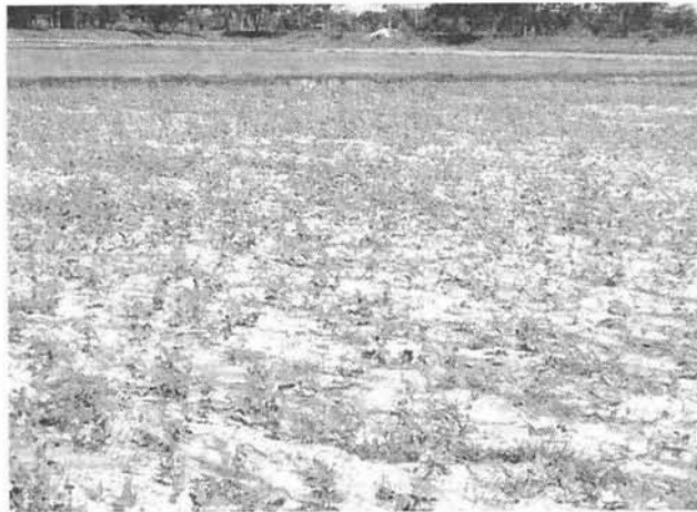
พื้นที่แปลงทดลองสำหรับการเกษตรปลอดสารพิษ