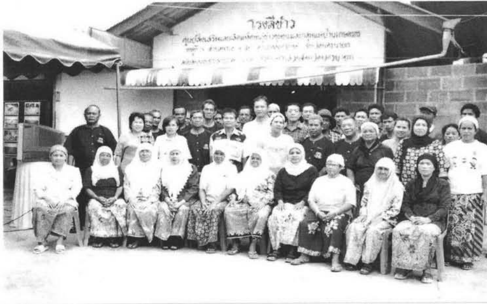
คณะกรรมการศูนย์ข้าวชุมชน และ กลุ่มแม่บ้าน ตำบลพระอาจารย์ อ.องครักษ์ จ.นครนายก