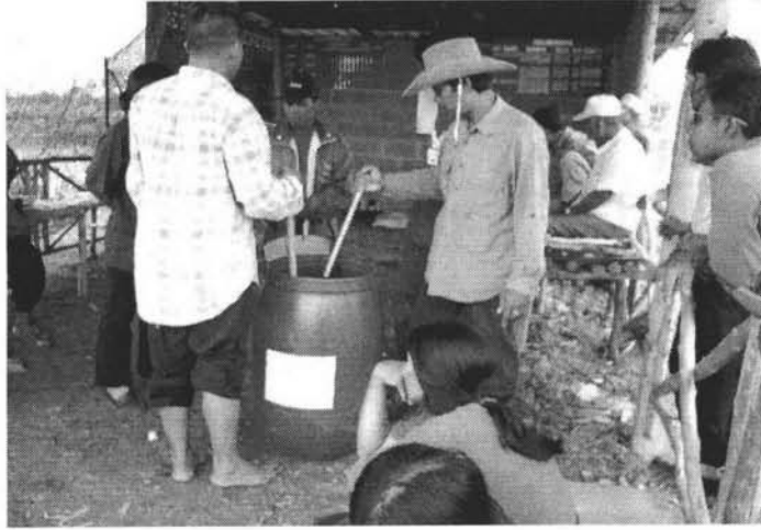
การทำน้ำหมักชีวภาพ