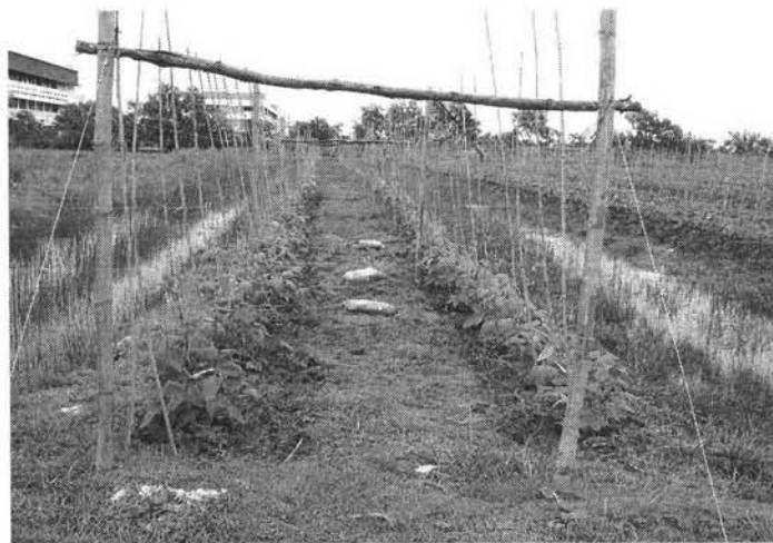
แปลงทดลองปลูกบวบในศูนย์เรียนรู้เศรษฐกิจพอเพียงชุมชน