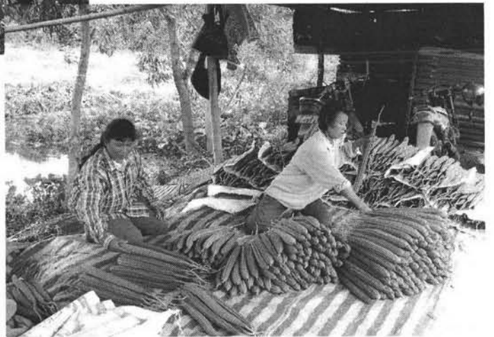
กลุ่มเกษตรกรเก็บเกี่ยวผลผลิตของกองกลาง