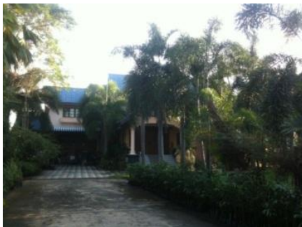
ภาพที่ 57 สถานที่พักอาศัยปัจจุบันของครูประสิทธิ์ หว่างแทน (บันทึกภาพเมื่อวันที่ 18 มกราคม 2556)

ปัจจุบันบริหารธุรกิจเพาะพันธุ์และขายส่งกล้วยไม้