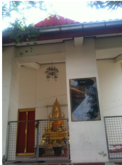
ภาพที่ 19 วิหารหลวงปู่ (บันทึกภาพเมื่อวันที่ 15 พฤศจิกายน 2555)

วิหารนี้สร้างขึ้นประมาณพุทธศักราช 2421 โดยบรรพบุรุษต้นตระกูล โทณะวณิก ซึ่งล่องเรือมาพักหน้าวัดพิบูลเงินด้วยศรัทธาในพระพุทธศาสนา เห็นว่าวัดนี้ยังไม่มีอุโบสถ จึงได้ถวายสร้างด้วยทุนทรัพย์ของตน เมื่อทางวัดสร้างอุโบสถหลังใหม่ อุโบสถเดิมนี่จึงใช้เป็นวิหารเรียกทั่วไปว่า “วิหารหลวงปู่”