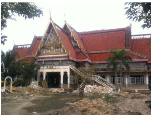
ภาพที่ 62 ศาลาหลังเดิมซึ่งเป็นสถานที่จัดงานระลึกพระคุณครูสกล แก้วเพ็ญกาศ ปัจจุบันอยู่ในช่วงบูรณะซ่อมแซม (บันทึกภาพเมื่อวันที่ 15 พฤศจิกายน 2555)

(ชาติรี อบนวล, สัมภาษณ์, 20 พฤศจิกายน 2555)