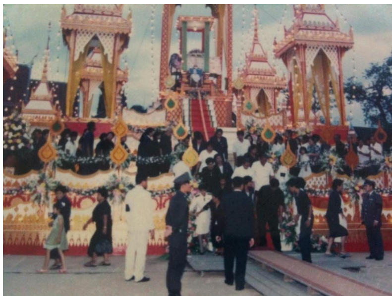
ภาพที่ 9 บรรยากาศภายในงานพระราชทานเพลิงศพครูสกล แก้วเพ็ญกาศ ณ วัดพิบูลเงิน