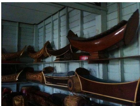
ภาพที่ 61 เครื่องดนตรีไทยส่วนหนึ่งบ้านครูสกล แก้วเพ็ญกาศ (บันทึกภาพเมื่อวันที่ 12 ธันวาคม 2555)

ครูตำรวจ ดุริยานนท์ กล่าวถึงชีวิตประจำวันด้านการเรียน การสอน และการฝึกซ้อม บ้านครูสกล แก้วเพ็ญกาศ ว่า