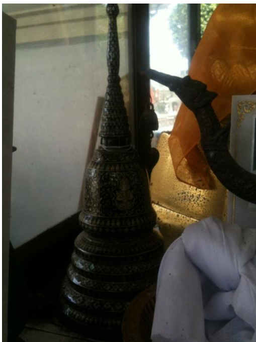
ภาพที่ 12 โกรฐบรรจ้อัฐิครุสกล แก้วเพ็ญกาศ ณ กุฏิพระสงฆ์ (ญาติและศิษย์สร้างถวาย) วัดพิบูลเงิน (บันทึกภาพเมื่อวันที่ 15 พฤศจิกายน 2555)