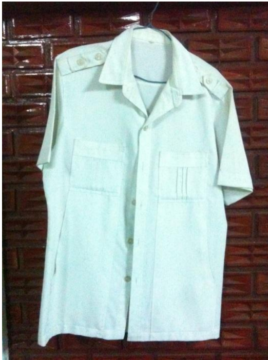
ภาพที่ 15 เสื้อเชิ้ตสีขาวแบบที่ 1 ของครูสกล แก้วเพ็ญกาศ (บันทึกภาพเมื่อวันที่ 15 พฤศจิกายน 2555)