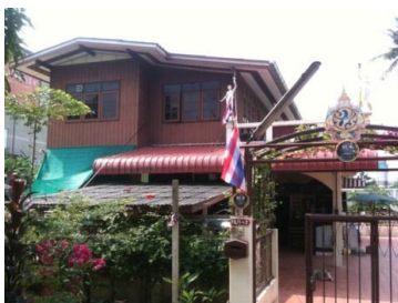
ภาพที่ 28 สถานพักอาศัยปัจจุบันของครูบุญเยี่ยม กิมเปี่ยม (บันทึกภาพเมื่อวันที่ 31 มกราคม 2556)

ปัจจุบันถ่ายทอดความรู้ด้านขับร้องเพลงไทยเดิมให้แก่เยาวชนย่านบางขุนทอง