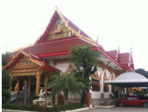
ภาพที่ 63 ศาลาซึ่งเป็นสถานที่จัดงานระลึกพระคุณครูสกล แก้วเพ็ญกาศ ในปัจจุบัน (บันทึกภาพเมื่อวันที่ 15 พฤศจิกายน 2555)

ครูกัญญา โรหิตาจล กล่าวถึงงานระลึกพระคุณครูสกล แก้วเพ็ญกาศ ณ วัดพิบูลเงิน ว่า คนเยอะทุกปี รถนี้แน่นศาลาเลยละ จริงๆแต่ก่อนพ่อจะจัดที่บ้านก่อนนะ พอพ่อเสียไป ก็พวกเรานี่แหละ มาคิดกัน ประชุมกัน อยากจัดงานให้พ่อ ก็ทำกัน มาเรื่อย รู้สึกว่าจะเป็นทุกเดือนสิงหาของทุกปีนะ ไข่หรือปลา อ้อ ไข่ๆ ไข่แล้วแหละ ทุกเดือนสิงหา อาหาร กับข้าวกับปลาไม่ต้องซื้อเลย มีกินตลอด ไม่เสียตังค์นะ