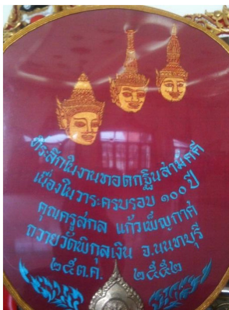
ภาพที่ 24 ญาติและศิษย์ ถวายตาลปัตรพระภิกษุสงฆ์ วัดพิบูลเงิน ที่ระลึกในงานทอดกฐินสามัคคี เนื่องในวาระครบรอบ 100 ปี ครูสกล แก้วเพ็ญกาศ (บันทึกภาพเมื่อวันที่ 15 พฤศจิกายน 2555)