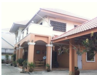
ภาพที่ 38 สถานพักอาศัยปัจจุบันของครูสาธิต แสงบุญ (บันทึกภาพเมื่อวันที่ 25 มกราคม 2555)

ปัจจุบันเป็นข้าราชการบำนาญ ถ่ายทอดความรู้ด้านดนตรีไทยแก่เยาวชนย่านบางกรวย