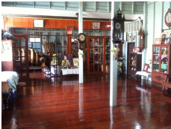
ภาพที่ 60 เรือนหลังที่ 3 (เรือนหลัง) สถานที่ถ่ายทอดความรู้ของครูสกล แก้วเพ็ญกาศแก่ศิษย์ (บันทึกภาพเมื่อวันที่ 12 ธันวาคม 2555)

หลังรับประทานเย็นร่วมกันเป็นเวลาแห่งการล้อมรวมวง ในชวงเวลานี้เอง จะเป็นการล้อมรวมกันของผู้ขับร้องและนักดนตรี เพื่อพัฒนาทักษะการบรรเลงรวมวง เสร็จกิจกรรมดังกล่าว จึงพักผ่อนตามอัธยาศัย