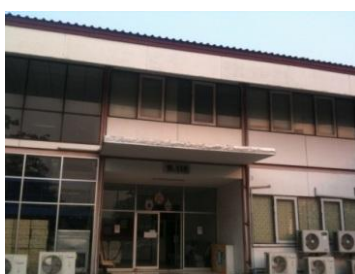
ภาพที่ 44 อาคารสีส้ม ท.116 การไฟฟ้าฝ่ายผลิตแห่งประเทศไทย สถานที่ทำงานของครูจำเริญ พิมเผือก (บันทึกภาพเมื่อวันที่ 22 มกราคม 2556)

ปัจจุบันเป็นเจ้าหน้าที่รัฐวิสาหกิจ การไฟฟ้านครหลวงแห่งประเทศไทย