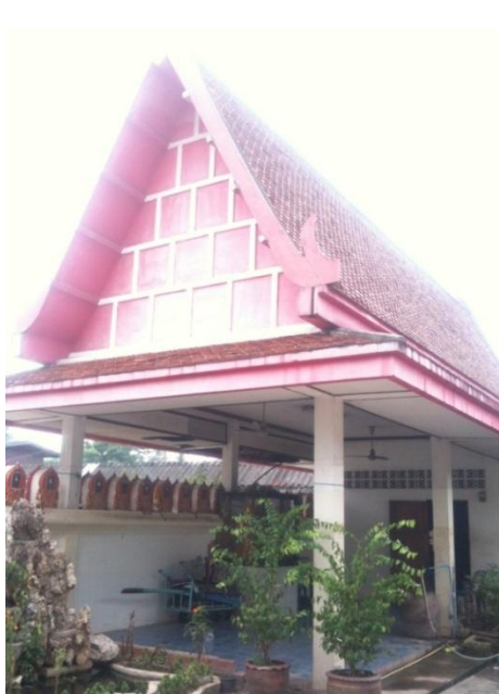
ภาพที่ 25 ญาติและศิษย์สร้างกุฏิถวายพระภิกษุสงฆ์ วัดพิบูลเงิน (บันทึกภาพเมื่อวันที่ 15 พฤศจิกายน 2555)