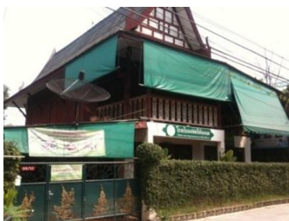
ภาพที่ 32 สถานพักอาศัยปัจจุบันของครูไสยาสน์ เข้มสุวรรณและเป็นที่ตั้งโรงเรียนดนตรี “พันเพลง” (บันทึกภาพเมื่อวันที่ 11 มกราคม 2555)

เมื่อศึกษาจบในระดับชั้นประถมศึกษาที่ 4 ครูสกล แก้วเพ็ญกาศ จึงได้ให้ครูไสยาสน์เข้ามาเรียนที่บ้าน เป็นศิษย์ท่านสืบมาซึ่งปัจจุบัน นอกจากนี้ครูไสยาสน์ เข้มสุวรรณ ได้เรียนดนตรีไทยกับครูท่านอื่นเพิ่มเติม โดยเรียนปีในกับครูเทียบ คงลายทอง และฆ้องมอญกับครูเย็น เต๊ะฮ้วน ปัจจุบันเป็นผู้บริหารโรงเรียนดนตรีพันเพลง ถ่ายทอดความรู้ด้านดนตรีไทยให้แก่เยาวชนและผู้สนใจ