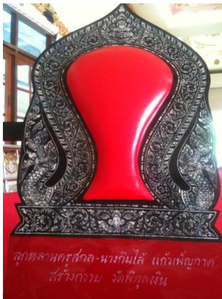
ภาพที่ 23 ลูกหลานครูสกล และ แม่ไล่ แก้วเพ็ญกาศ ถวายอาสนะพระภิกษุสงฆ์วัดพิบูลเงิน (บันทึกภาพเมื่อวันที่ 15 พฤศจิกายน 2555)