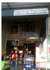
ภาพที่ 41 สถานที่พักอาศัยปัจจุบันของครูชาติรี อบนวลและเป็นที่ตั้งชมรมดนตรีไทย “ศิลปวัฒนธรรม” (บันทึกภาพเมื่อวันที่ 15 พฤศจิกายน 2555)

ครูชาติรี อบนวล เริ่มเรียนดนตรีไทยเมื่ออายุ 10 ปี กับครูสกล แก้วเพ็ญภาค โดยมีครูกัญญา โรหิตาจล ผู้ซึ่งเป็นพี่สาวเรียนอยู่ก่อนแล้ว เรียนฆ้องวงใหญ่เป็นเครื่องดนตรีชนิดแรก ต่อเพลงสาธุการ โหมโรงเช้า โหมโรงเย็น เพลงเรื่องต่างๆ เพลงเถาต่างๆ เพลงโหมโรงกลางวัน เพลงหน้าพาทย์ อายุ 13 ปี เริ่มเรียนระนาดเอก ฝึกการแปรทำนอง ศึกษาเพลงประกอบโขน ละคร โดยที่ได้รับการผลักดันและสนับสนุนจากครูสกล แก้วเพ็ญภาค เรื่อยมา ทั้งนี้เมื่อมีความชำนาญทางระนาดเอกพอสมควรแล้ว ครูชาติรีจึงได้ศึกษาเครื่องดนตรีไทยชนิดอื่น กล่าวคือ ฆ้องวงเล็ก และ ระนาดทุ้ม นั่นเอง โดยได้ต่อเพลงเดี่ยวเพิ่มเติม ส่วนใหญ่ในการประชันครูชาติรีจะรับหน้าที่บรรเลง ฆ้องวงเล็ก พ.ศ. 2521 ครูชาติรี อบนวล เข้ารับราชการวงดนตรีไทยเทศบาล กรุงเทพมหานคร (กองการสังคีต สำนักวัฒนธรรม กีฬา และการท่องเที่ยว กรุงเทพมหานคร ในปัจจุบัน) ได้มีโอกาสเรียนดนตรีกับครูบุญยงค์ เกตุคง ครูบุญยัง เกตุคง ครูช่อ อากาศโปร่ง และครูพินิจ ฉายสุวรรณ ปัจจุบันเป็นข้าราชการบำนาญ ถ่ายทอดความรู้ด้านดนตรีไทยแก่เยาวชนย่านบางกรวยและนิสิต นักศึกษา สถาบันต่างๆ