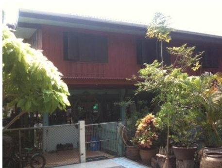
ภาพที่ 53 สถานพักอาศัยของครูเกษิ วัฒนโยธิน (บันทึกภาพเมื่อวันที่ 30 มกราคม 2556)

ปัจจุบันถ่ายทอดความรู้ด้านดนตรีไทยแก่เยาวชนย่านบางวัว จังหวัดฉะเชิงเทรา