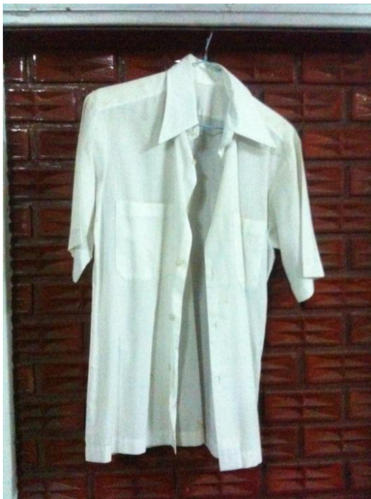
ภาพที่ 16 เสื้อเชิ้ตแบบที่ 2 ของครูสกล แก้วเพ็ญกาศ (บันทึกภาพเมื่อวันที่ 15 พฤศจิกายน 2555)