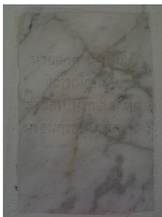
ภาพที่ 22 แผ่นหินอ่อนสลักชื่อครูสกล และ แม่ได้ แก้วเพ็ญกาศ

จากคำสัมภาษณ์ผู้วิจัยวิเคราะห์ ความสัมพันธ์อันดีระหว่างครูสกล แก้วเพ็ญกาศ กับวัดพิgulเงินอันเกิดมาจากความศรัทธาเลื่อมใสของครูสกลที่มีต่อพุทธศาสนา หมั่นทำบุญเข้าวัดวาอารามอยู่เป็นประจำ ประกอบกับบ้านของครูสกลอยู่ใกล้กับวัดพิgulเงิน ตั้งอยู่ทางด้านข้างของวัด มีเพียงคลองบางกอกน้อยกั้นเท่านั้น ซึ่งครูสามารถข้ามสะพานหรือพายเรือข้ามฝั่งมาได้ เสียขีพพาทย์ที่ดังมาจากบ้านของครูสกลย่อมกระทบ โสตประสาทของผู้ที่อาศัยอยู่บริเวณชุมชนวัดพิgulเงิน จนทำให้เกิดความคุ้นเคย ด้วยเหตุผลที่กล่าวมานี้จึงเป็นสาเหตุเกิดการปฏิสัมพันธ์ระหว่างสองฝ่ายอยู่เสมอ จนทำให้วงปีพาทย์ครูสกล แก้วเพ็ญกาศ เป็นวงปีพาทย์ประจำวัดพิgulเงินไปในที่สุด