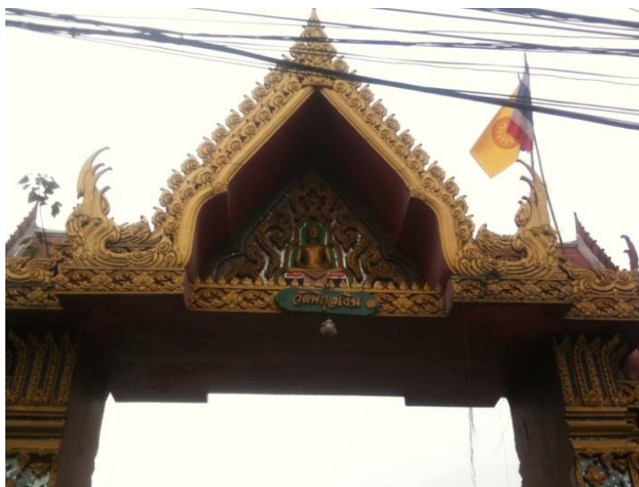
ภาพที่ 17 วัดพิบูลเงิน (บันทึกภาพเมื่อวันที่ 15 พฤศจิกายน 2555)

วัดพิบูลเงิน สร้างขึ้นในสมัยกรุงรัตนโกสินทร์ตอนต้น ประมาณ พ.ศ. 2374 ไม่ทราบนามและประวัติผู้สร้าง ต่อมาได้มีคนจีนชื่อ ฮะ ซึ่งเป็นต้นตระกูลโทณวนิกได้ล่องเรือผ่านมาเห็นสภาพวัดเกิดศรัทธาจึงบริจาคทรัพย์ส่วนตัว สร้างอุโบสถขึ้นเมื่อ พ.ศ. 2521 ต่อมาประชาชนทั่วไปมักเรียกว่า "วัดพิบูล" วัดแห่งนี้เป็นที่ประดิษฐาน หลวงพ่อพุทธโสธรจำลององค์หนึ่งในประเทศไทย