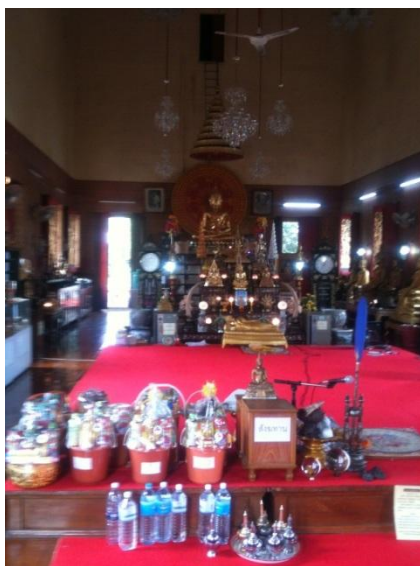
ภาพที่ 18 ภายในโบสถ์วัดพิบูลเงิน (บันทึกภาพเมื่อวันที่ 15 พฤศจิกายน 2555)

วัดพิบูลเงิน สร้างขึ้นในสมัยกรุงรัตนโกสินทร์ตอนต้น ประมาณ พ.ศ. 2374 ไม่ทราบนามและประวัติผู้สร้าง ต่อมาได้มีคนจีนชื่อ ฮะ ซึ่งเป็นต้นตระกูลโทณวนิกได้ล่องเรือผ่านมาเห็นสภาพวัดเกิดศรัทธาจึงบริจาคทรัพย์ส่วนตัว สร้างอุโบสถขึ้นเมื่อ พ.ศ. 2521 ต่อมาประชาชนทั่วไปมักเรียกว่า "วัดพิบูล" วัดแห่งนี้เป็นที่ประดิษฐาน หลวงพ่อพุทธโสธรจำลององค์หนึ่งในประเทศไทย