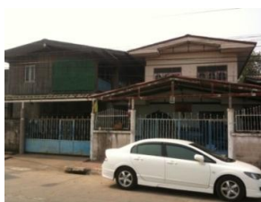
ภาพที่ 55 สถานที่พักอาศัยปัจจุบันของครูเสนต์ อินทสนธิ์และเป็นที่ตั้งของปี่พาทย์คณะ“ส. อินทสนธิ์” (บันทึกภาพเมื่อวันที่ 1 กุมภาพันธ์ 2556)

พ.ศ. 2513 ครูเสนต์ อินทสนธิ์ ได้เข้าไปฝากตัวเป็นศิษย์ครูสกล แก้วเพ็ญกาศ เรียนระนาดเอก ที่บ้านคลองบางใหญ่ ขณะนั้นครูเสนต์ อินทสนธิ์อายุ 17 ปี บริบูรณ์ ต่อเพลงโด้ลาว เป็นเพลงแรก เรียนเพลงทุกประเภทกับครูสกล ประเภทเพลงเสภา เช่น สืบท บูลัน ไ้ปลั่ง เป๊ะ ทางครูสกล แก้วเพ็ญกาศ สารถิ เป็นต้น ประเภทเพลงเดี่ยวระนาดเอก เช่น แขนมอญ พญาโศก สารถิ กราวใน เถา ฯลฯ พ.ศ. 2525 เริ่มทำงานในตำแหน่งครูอัตราจ้างที่ธรรมศาสตร์คลองหลวง เป็นเวลา 3 ปี ต่อมาเข้ารับราชการที่ทหารบก สระบุรี แผนกดุริยางค์สากล (แตร) เมื่อพ.ศ. 2528 early retire เมื่อ พ.ศ. 2552 ปัจจุบันดำรงกิจการปี่พาทย์เป็นของตนเอง ย่านหนองแค จังหวัดสระบุรี