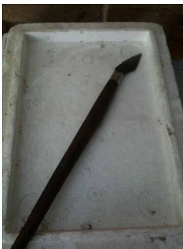
ภาพที่ 6 ลีวที่ใช้ในการเหลาไม้ไผ่ทำอังกะลุงของครูสกล แก้วเพ็ญกาศ ซึ่งได้มอบให้ครูไสยาสน์เพื่อเป็นผู้สืบสานงานด้านการทำอังกะลุง (บันทึกภาพเมื่อวันที่ 11 มกราคม 2556)

มาซ่อม พวกศิษย์ที่สนใจก็จะมาช่วย อากจะไม่บังคับใคร ถ้าสนใจจริงๆก็สอนไม่เคยปิดบังเลย อย่างครูเองเรียนการทำอังกะลุงมาจากอากเยอะ ถือเป็นอังกะลุงคุณภาพเลยละ ฝีมืออากกลายเป็นที่ยอมรับ ในจังหวัดนนฯ จะรู้จักกันหมด งานละเอียด จะมาทำส่งๆนี้ไม่ได้เลย จะสอนตลอด ต้องพิถีพิถัน ไม้ก็ต้องขัดไม่ให้มีเสี้ยน แม้กระทั่งสีที่ทาเนี่ยก็ต้องให้เสมอกัน การเลือกไม้ไผ่ต้องดูยังไงจะบอกหมด ทำส่งข้างนอกด้วย ใช้เองด้วย จะมีทำให้โรงเรียนทั่วไป ส่งขายที่เวียงฯ ทุกวันนี้ครูก็ยังทำอังกะลุงขายนะ ได้วิชาจากอากนี่แหละ เป็นอีกหนึ่งอาชีพด้วย ลีวที่อากให้ครูยังเก็บไว้อยู่เลย แต่ก่อนเอามาใช้งาน ใช้ถากไม้ แต่ตอนนี้ใช้ไม่ค่อยได้แล้ว ใบบิดมันเริ่มลึกลงด้วย เลยเก็บไว้เป็นที่ระลึก ไว้บูชา เป็นขวัญกำลังใจ (ไสยาสน์ เข้มสุวรรณ , สัมภาษณ์ , 25 เมษายน 2556)