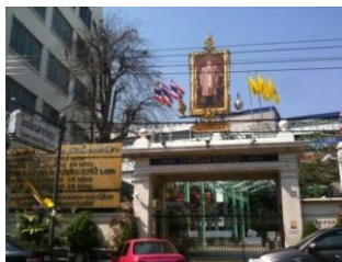
ภาพที่ 59 “โรงเรียนสายปัญญา ในพระบรมราชินูปถัมภ์”

ครูศุภณัฐสามารถบรรเลงเครื่องดนตรีภายในวงปีพาทย์ได้ทุกชนิด โดยได้ศึกษาปี่ในเพิ่มเติมจากครูอนันต์ สบถุภย์ ประเภทเพลงต่างๆที่ครูศุภณัฐได้รับการถ่ายทอดจากครูสกลโดยเริ่มเรียนตั้งแต่เพลงโหมโรงเช้า โหมโรงเย็น ประเภทเพลงเสภา เพลงหน้าพาทย์ และเพลงเรื่องต่างๆ เดี่ยวระนาดเอก ที่ได้รับถ่ายทอด เช่น เชิดนอก ลาวแพน สารถิ แยกมอญ พญาโศก การเวก ต่อยรูป กราวใน ทอยเดี่ยว ฯลฯ รวมทั้งสิ้นประมาณ 20 เดี่ยว นอกจากนี้ครูศุภณัฐยังได้เรียนดนตรีกับครูเชื้อ ดนตรีรส คุรุมนัส ขาวปลื้ม ครูเลื่อน สุนทรวาทิน ครูอุทัย แก้วละเอียด ปัจจุบันดำรงตำแหน่งครู คศ.2 โรงเรียนสายปัญญาในพระราชานุอุปถัมภ์