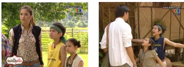
ภาพเด็กชายด้วน ในละครเรื่อง แม่เปี้ยคือ ทางช่อง 3

เด็กชายด้วน ในละครเรื่อง แม่เปี้ยคือ ลูกน้องของเปี้ย (นางเอก) เด็กชายด้วนจะทำหน้าที่หลักคือติดตามเปี้ย ไม่ว่าจะเปี้ยจะไปไหน โดยมีคู่หูอีกคนหนึ่ง คือ เด็กหญิงเต๋อ ผู้ช่วยนางเอกในการดูแลและหาลูกค้าเช่ารีสอร์ทเล็กๆที่เปี้ยพยายามสร้างขึ้น โดยเฉพาะหน้าที่ดูแลบริการผู้หมวดเถลิงรัฐ (พระเอก) ที่มาเช่าพักรีสอร์ทของเปี้ย และเป็นตัวช่วยรับถ่วงเวลารับหน้าสถานการณ์ต่างๆ อาทิ เถลิงรัฐหรือตัวร้ายที่มาป่วนนางเอก ในเวลาที่เปี้ยต้องการหลบหน้า หรือส่งข่าวเรื่องของเถลิงรัฐให้กับเปี้ย ร้อยอยู่เสมอ บทบาทคู่หูเด็กชายหญิงทั้งสองจะเป็นคนคอยแสดงความกลัวให้เปี้ยต้องคอยปกป้องและแสดงความกล้าหาญให้ดู เป็นการเสริมความมั่นใจ และสะท้อนกลับภาพของเปี้ยที่ไม่เคยกลัวอะไร พร้อมจะปกป้องลูกน้องของตนอีกด้วย