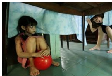
ภาพเด็กหญิงออย ในละครเรื่อง รากบุญ ทางช่อง 3

เด็กหญิงยิ้ม ในละครเรื่อง มาลัยสามชาย ยิ้มเป็นลูกสาวของละออ(นางเอก) ซึ่งละออเองต้องตกวิบากกรรมของการมีครอบครัวที่เชื่อตามคำแนะนำของผู้ใหญ่มาโดยตลอด จนทำให้ละออมีสามีถึง 3 คน เด็กหญิงยิ้มเป็นลูกกบฏศ พลารรหนุ่มเจ้าสำราญที่เป็นรักแรกของลอออ สามีคนแรกและได้ร่วมชะตากรรมกับแม่ของตนไปตลอดระยะเวลาเปลี่ยนแปลงสำคัญในชีวิต โดยเมื่อละออได้พบรักใหม่เป็นครั้งที่ 2 หนูยิ้มถือเป็นสะพานเชื่อมรักให้ละออและ เทพ ราชศักดิ์ นายทหารผู้แข็งแกร่งและมั่นคง ได้ครองคู่รักต่อกัน และร่วมอยู่ในเหตุการณ์ที่สามีคนแรก ที่เป็นพ่อของเธอ ยังมาตามระรานดูถูกแม่อีกด้วย จนกระทั่งเทพ ราชศักดิ์ สามีคนที่ 2 ของลอออดหายสาบสูญไปเพราะการเมืองที่ขัดผลประโยชน์กัน ทำให้ละออได้พบรักใหม่อีกครั้งกับเจ้าดิเรกรูจหนุ่มอายุน้อยกว่า หนูยิ้มก็มีส่วนรับรู้ในเรื่องราวนี้ แต่เป็นช่วงเวลาของเด็กหญิงยิ้มโตเป็นผู้ใหญ่มากพอ และเข้าใจเหตุการณ์ทั้งหมด จนไปถึงเด็กหญิงยิ้มเป็นสาวเต็มตัวและรับผิดชอบดูแลแม่ และไปมีครอบครัวของตัวเองได้เสียเองด้วย