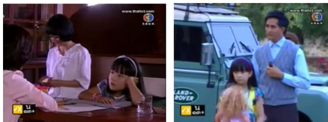
ภาพคุณพริม ในละครเรื่อง หมูแดง ทางช่อง 3

4.1.2.3. บทบาทตัวละครเด็กที่สัมพันธ์กับตัวละครเอกในฐานะพิเศษ คือ กลุ่มตัวละครเด็กที่มักจะมีอำนาจหรือพลังวิเศษเหนือธรรมชาติ ซึ่งเป็นส่วนสำคัญที่ทำให้สามารถช่วยเหลือตัวเองในสถานการณ์ต่างๆได้ นอกจากนี้ตัวละครเด็กในฐานะพิเศษเหล่านี้มักจะมีตัวช่วยรองอีกตัว หรือเป็นคู่หูผู้ช่วยตัวละครเด็กอีกครั้งด้วย อาทิ