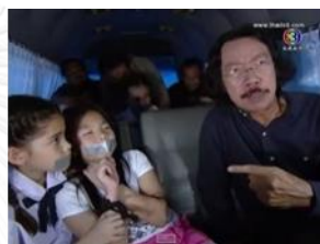
ภาพเด็กหญิงนิโม ในละครเรื่อง รักนี้หัวใจมีครีป ทางช่อง 3

เด็กชายต๋อย ในละครเรื่อง นางแบบโคกกระโดน ในตารางที่ 4.1 ลำดับที่ 31 ต๋อยเป็นลูก ชายของผู้ใหญ่บุญโฮม เป็นผู้ช่วยเหลือและผู้ส่งสาร ทำหน้าที่การเป็นสื่อ คือ ช่วยเอาข่าวความ เคลื่อนไหวที่มีนายทุนจะมาปรับเปลี่ยนตลาดในหมู่บ้านและยังจะชวนให้ชาวบ้านมาลงทุนทำธุรกิจ ขายน้ำมัน และใช้ชีวิตหรูหรา เด็กชายต๋อยเลยไปส่งข่าวนี้ให้กับผู้ใหญ่บุญโฮม ลอรา (นางเอก) อินทร์ (พระเอก) และคนในหมู่บ้านให้ไปรวมตัวกัน นอกจากนี้เมื่อนางเอกที่มาอาศัยสอนหนังสือโรงเรียนใน หมู่บ้าน หลังจากปรับตัวเข้ากับหมู่บ้านได้แล้ว กำลังจะเลิกการสอนและกลับไปใช้ชีวิตตามความฝัน ตามที่ลอราให้ข้ออ้างกับทุกคน เด็กชายต๋อยทำหน้าที่ส่งข่าว บอกเพื่อนนักเรียนและอินทร์อีกครั้ง