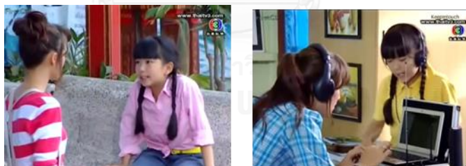
ภาพเด็กหญิงหญิงหญิง ในละครเรื่อง ตะวันยอตรัก ทางช่อง 3

เด็กหญิงหญิงหญิง ในละครเรื่อง ตะวันยอตรัก รับบทเป็นน้องสาว ที่พ่อของตะวัน (นางเอก) รับมาเลี้ยงตั้งแต่เด็ก หญิงหญิงทำหน้าที่หลักคือ ผู้ติดตามนางเอก เหมือนลูกน้องตามลูกพี่สาวไปทุกที่ ความช่วยเหลือสำคัญของเด็กหญิงหญิงไม่ใช่การปกป้องหรือร่วมต่อสู้ ช่วยเหลือในเชิงจิตใจ นั่นคือ การให้กำลังใจหรือพูดชื่นชม ที่ช่วยเพิ่มความมั่นใจ สร้างแรงเชียร์ให้กับตะวันในการกระทำสำคัญต่างๆ รวมทั้งพยายามคิดหาทางช่วยแต่ไม่ได้ออกไปสู่การกระทำจริงมากนัก อาทิ เมื่อตะวันต้องพาพระเอกและผู้ติดตามไปซ่อนในที่ปลอดภัย หญิงหญิงจะเป็นผู้ติดตามไปด้วยเท่านั้น หรือเดินทางจากหมู่บ้านเกาะไปกรุงเทพฯกับตะวันเพื่อไปตามหาแม่ด้วยกัน เป็นต้น