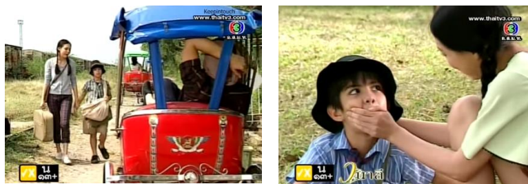
ภาพเด็กชายเต๋อ ในละครเรื่อง วนาลี ทางช่อง 3

เด็กเต๋อ ในละครเรื่อง วนาลี ในตารางที่ 4.2 ลำดับที่ 21 ทำหน้าที่เป็นผู้ช่วยเหลือ ผู้ให้และผู้ส่งสารตามลำดับความสำคัญ ในบทบาทของการดำเนินเรื่อง เด็กเต๋อที่ เป็นผู้ช่วยสำคัญของวิชชดา (นางเอก) พร้อมรับคำสั่งปฏิบัติตามที่วิชชดาต้องการทุกอย่าง เมื่อวิชชดาอยากออกเดินทางตามหาเสียมืด ที่ตนเข้าใจว่ามาปล้นบ้านของป้า โดยตกลงออกเดินทางไปตามหาเสียมืดที่จังหวัดสุพรรณบุรี เด็กเต๋อ จึงเป็นตัวละครเด็กที่มีส่วนร่วมในเหตุการณ์การออกเดินทางค้นหาเสียมืดของวิชชดา (นางเอก)