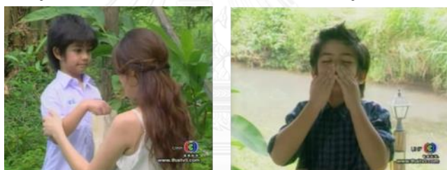
ภาพเด็กชายปัด ในละครเรื่อง ผู้ใหญ่ลี้กับนางมา ทางช่อง 3

เด็กชายปัด ในละครเรื่อง ผู้ใหญ่ลี้กับนางมา ลูกเลี้ยงของผู้ใหญ่ลี(พระเอก) เป็นตัวละครฝ่ายดี (ฝ่ายธรรมะ) มีบทบาทที่สำคัญที่ช่วยให้พระเอกนางเอกได้แก้ไขสถานการณ์ หรือเมื่อพระเอกไม่สามารถหาทางออกเพื่อสร้างความเข้าใจกับนางเอก ให้ดำเนินเรื่องต่อไปได้ ปัดจะทำหน้าที่เป็นกุญแจสำคัญคอยช่วยไขปัญหา คิดหาทางออกให้พระเอกนางเอกได้กลับมาปรับความเข้าใจกัน อาทิ ตอนที่ผู้ใหญ่ลีไม่เข้าใจนางเอก ปัดทำหน้าที่เป็นตัวช่วยให้ทั้งสองได้พบกัน จากบทสนทนาตอนหนึ่งที่ปัดไปตามผู้ใหญ่ลี้ที่ทุ่งนา บอกว่ามีคนมารอพบอยู่ให้รีบไปหา แต่พระเอกไม่รู้ว่าเป็นใครและไม่อยากรีบร้อน เพราะว่ายังรู้สึกไม่สบายกับเรื่องที่น่างอกหนีตนไปอยู่กรุงเทพฯ และจะไม่กลับมาแล้ว