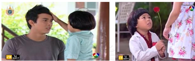
ภาพเต็ด ในละครเรื่อง มนต์รักแก๊งน ทางช่อง 7

เด็กชายสะตือ ในละครเรื่อง ลิเกเงินร้อย เป็นเด็กชายที่ถูกเลี้ยงมาในคณะลิเก ที่รงทอง (พระเอก) อาศัยอยู่เช่นกัน เด็กชายสะตือขึ้นชมความสามารถของรงทองเป็นอย่างมาก เพราะความสามารถด้านการร้องลิเกของรงทอง ซึ่งตอนแรกรงทองต่อต้านที่จะช่วยเหลือคณะลิเกของครอบครัวตัวเอง เด็กชายสะตือถือเป็นผู้ร่วมเหตุการณ์ที่รงทองโดนกำรจ้างคนมาทำร้าย ขณะเดียวกันหลังจากที่รงทองโดนทำร้ายแล้ว ฝ่ายสนับสนุนตัวร้ายในคณะลิเกเองก็พยายามมาสืบข่าวกับเด็กชายสะตือ แต่ตือไม่ยอมบอกใครว่ารงทองจะจัดการอย่างไร แต่หลังจากที่รงทองโดนทำร้ายแล้ว เด็กชายสะตือได้ร่วมแก้แค้นแทนรงทองพร้อมสมาชิกในคณะลิเก และไปแจ้งข่าวกับรงทองอีกทาง ขณะเดียวกันลุงสุข หัวคณะรู้เรื่องการไปแก้แค้นและรู้ด้วยว่ารงทองจะกลับไปจัดการแก้แค้นเอง แทนที่จะให้ตำรวจจัดการ สะตือไปแจ้งข่าวแก่รงทองด้วย เด็กชายตือยังโดนพระเอกสั่งให้ร่วมกับลูกน้องอีกคนไปตามหาแก้วกุดั่น(นางเอก)เมื่อพ่อแม่ของเธอมาพาตัวกลับบ้านหลังจากหนีมาอยู่คณะลิเก แต่โดนเจ้าหน้าที่รักษาความปลอดภัยบนสะตือและลูกน้องรงทองอีกคนออกมา สะตือกลับมาแจ้งพระเอกและแนะนำพระเอกที่บ้าน ตอนหนึ่งว่า