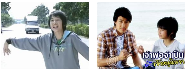
ภาพ เด็กชายนินจา ในละครเรื่อง เจ้าพ่อจำปับกับเจ้าหนูนินจา ทางช่อง 3

เด็กชายนินจามีความชื่นชมในความสามารถของเผด็จอย่างชัดเจน และถูกนำเสนอในมุมมองของเด็กชายที่ปลื้มในความดีและความสามารถ ส่งผลเน้นให้ผู้ชมมีมุมมองที่ดีต่อเผด็จผ่านเด็กชายนินจา แม้ว่าเผด็จจะเป็นอดีตนักเลงที่กลับใจมาทำอาชีพสุจริตและช่วยเหลือผู้อื่น