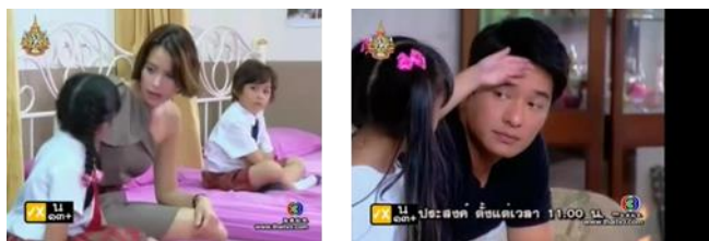
ภาพเด็กหญิงข้าวตู เด็กชายปลาทุ ในละครเรื่อง ลิขิตเสนาหา ทางช่อง 3

เด็กชายอะตอม ในละครเรื่อง หัวใจเรือฟาง รับบทบาทเป็นลูกของหลานธัญธรรณ์(นางเอก) ซึ่งธัญธรรณ์รับอุปการะเลี้ยงดูทั้งเด็กชายอะตอมและรัฐธิดาเพียงคนเดียว เนื่องจากแม่ของรัฐธิดา ซึ่งเป็นพี่สาวแท้ๆของธัญธรรณ์เป็นนักโทษในคดียาเสพติด ทำให้รัฐธิดารู้สึกอับอายและไม่เคยไปเยี่ยมแม่ของตนเลย และพยายามปกป้องเรื่องนี้เป็นความลับ เด็กชายอะตอมเติบโตมาโดยเข้าใจว่า ธัญธรรณ์เป็นแม่ของตน ซึ่งรัฐธิดาเองก็พอใจให้เด็กชายอะตอมเข้าใจเช่นนั้น จนกระทั่งทั้งธัญธรรณ์ และรัฐธิดาต้องไปทำงานที่รีสอร์ตที่ปากช่อง ทำให้รัฐธิดาได้พบกับธาริต คนรักเก่าที่มีฐานะเป็นพ่อของเด็กชายอะตอมด้วย เมื่อธาริตได้พบกับเด็กชายอะตอม ก็รู้สึกถูกชะตาและคุ้นเคยเป็นพิเศษ สู่การคลี่คลายเรื่องและเปิดเผยความจริงในความสัมพันธ์ของสถานะของเด็กชายอะตอม