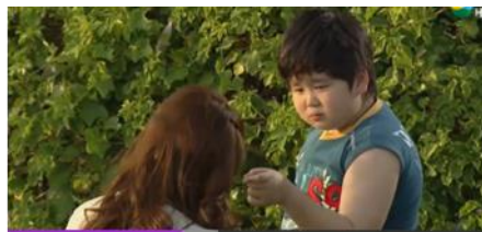
ภาพเด็กชายข้าวต้ม จากละครเรื่อง คุณผีที่รัก ทางช่อง 7

ซึ่งสามารถอธิบายได้ว่าตัวละครเด็กฝ่ายตัวเองที่มีความสัมพันธ์ทางเครือญาติกับตัวละครเอก จะมีการแสดงออกทางบวกชัดเจน และมียังการแสดงออกถึงความน่าเอ็นดู หรือความน่าสงสารใน เหตุการณ์ที่เป็นฝ่ายถูกรังแก ในขณะที่เดียวกันก็มีการแสดงออกความเฉลียวฉลาด คิดแผนการหรือ สร้างสถานการณ์ช่วยเหลือเหล่าตัวเองในเหตุการณ์คับขันต่างๆได้ อยู่เสมอ