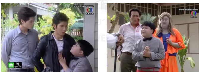
ภาพป้อม(ผิเด็ก) ในละครเรื่อง ไอ้คุณผี

ป้อม(ผิเด็ก) ในละครเรื่อง ไอ้คุณผี ในตารางที่ 4.1 ลำดับที่ 14 เป็นผีหรือวิญญาณที่来帮助ดูแลและเป็นเพื่อนกับวิญญาณของดิษพงศ์(พระเอก) ที่ถูกฆ่าตายในซอยบ้านที่จิริน (นางเอก) อาศัยอยู่ ผีป้อมสามารถปรากฏตัวให้เพียงดิษพงศ์เห็นและเป็นเพื่อนเดินทางไปสถานที่ต่างๆ เพื่อขอร้องจิรินให้ช่วยเหลือสืบหาคนร้ายที่ฆาตกรรมเขา เพราะจิรินเป็นคนเดียวที่สามารถมองเห็นวิญญาณผีต่างๆได้ นอกจากนี้ป้อมยังมีนิสัย ขี้เล่น และเกรในบางครั้ง เช่น เมื่อเพื่อนๆของจิรินจ้างหมอผีมาทำพิธีขับไล่วิญญาณเนื่องจาก เห็นเพื่อนชอบพูดคนเดียวและมีพฤติกรรมแปลกไป ป้อมก็สามารถกลั่นแกล้งหมอผีด้วยวิธีสนุกสนานหลายครั้ง เช่น เข้าไปกอดเกาะตัวไว้ สร้างความตกใจกับตัวร้ายต่างๆได้หลายครั้ง