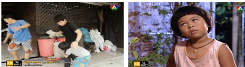
ภาพเด็กชายสะดือ ในละครเรื่อง ลิเกเงินร้อย ทางช่อง 7

เด็กชายพี ในละครเรื่อง ก๊วยหัวใจแหวน รับบทเป็นน้องชายของบัวบูชา (นางเอก) แต่พลัดพรากกัน โดยบัวบูชาเองไม่รู้มาก่อนว่าตนมีน้อง โดยบัวบูชาได้พบกับน้องพีในขณะที่ออกไปปฏิบัติหน้าที่อาสา ก๊วย ซึ่งเกิดจากการรวมตัวอาสาสมัครเพื่อนๆ ในสลัมที่เธออยู่ แต่สวมใส่ชุดสีชมพูหวานแหวว แต่ออกไปช่วยเหลืออุบัติเหตุและผู้คนที่เดือดร้อนร่วมกัน ทำให้บัวบูชาได้พบกับน้องพีเข้าและรู้ความจริงว่า ตนเองนั้นสามารถสื่อสารกับวิญญาณของคนได้ และมีเพียงบัวบูชาคนเดียวที่พูดคุยกับน้องพีได้ เพราะแท้ที่จริง น้องพีนอนรักษาตัวเป็นเจ้าชายนิทราอยู่ โดยนันทา(แม่ของนางเอกและพี)ดูแลร่างกายของพีอย่างดีที่สุด หวังว่าวันหนึ่งลูกชายจะฟื้นขึ้นมา วิญญาณของพีล่องลอย หลงทางอยู่ในโรงพยาบาล โชคดีที่จิตสื่อสารกับบัวบูชาได้ บัวบูชาจึงรับอาสาพาไปหาร่าง และได้รู้ว่าแท้จริง พีคือน้องชายแม่เดียวกันกับเธอในที่สุด