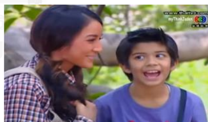
ภาพฟ้าลั่น ในละครเรื่อง บ้านนอกเข้ากรุง ช่อง 3

ครุฑน้อย ในละครเรื่อง มณีแดนสรวง ในตารางที่ 4.1 ลำดับที่ 9 เป็นผู้ร่วมเดินทางกับ รัชมิชโลธร นางฟ้า (นางเอก) ไปตามหาอสูร ในป่าฉิมพลีเพื่อไปยอดเขาคันชามาาศที่ต่อต้องใช้เวลาถึง 10 วัน แต่ครุฑน้อยได้ไปสอบถามกับสัตว์ในป่าเพื่อหาทางลัดไปให้ถึงเร็วขึ้น และร่วมกับสกร(พระเอก)และผู้ช่วย ต่อสู้กับอสูร และสัตว์ร้ายต่างๆในป่า และเมื่อสกรกับหลงกับเหล่านางนารีผลและโดนมนต์สะกด ครุฑน้อยทำหน้าที่นำทางและร่วมเดินทางไปกับนางเอก เพื่อไปจัดการกับอสูร และกลับมาช่วยพาพระเอกบินไปหานางฟ้าที่ล่องหน้าไปก่อน