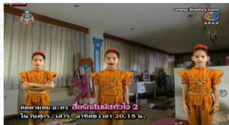
ภาพโกลเดินเบบี้ (กุมารทอง)ในละครเรื่อง The six sense สื่อรักสัมผัสหัวใจ

รัก-ยม ตัวละครเด็กเป็นกุมารทองน้อยที่พ่อของนางเอกสั่งให้คุ้มครองนางเอก ในละครเรื่อง วายุภักคมนตรี (ละครชุด 4 หัวใจแห่งขุนเขา) ผู้พิทักษ์ของท้าวท้าว (นางเอก) ตามคำสั่งที่หมอไกรฤทธิ์ อดีตหมอไสยจอมขมังเวทย์ โดยหมอไกรฤทธิ์แอบซ่อนขอความรักยมไว้ในกระเปาะของลูกสาวที่กำลังจะเดินทางไปโรงเรียนแห่งหนึ่ง เพื่อหาวัตถุดิบมาเขียนนิยายเรื่องใหม่ เมื่อมาถึงไร้ท้าวท้าวรู้สึกถึงความผิดปกติ และรักยมก็ออกจากกระเปาะมายืนยืนเช่นกัน เมื่อมาพบวายุภักค(พระเอก)ที่เป็นเจ้าของไร้ก็พบความผิดปกติเพิ่มอีก เพราะพระเอกมีสีหน้าหมองคล้ำเหมือนโดนวิญญาณหรือมนต์ดำ ท้าวท้าวมักจะขอคำปรึกษากับรัก-ยมที่คุ้มครองตนเองเพื่อช่วยเหลือพระเอก ซึ่งเมื่อคนทั่วไปมองจะเห็นเหมือนท้าวท้าวกำลังพูดคนเดียวอยู่ ทำให้พระเอกที่ไม่เชื่อในไสยศาสตร์ยิ่งต่อต้านสิ่งที่ท้าวท้าวพยายามจะช่วยเหลือ