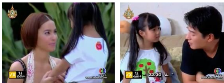
ภาพเด็กหญิงไซตุ่น จากละครเรื่องลิขิตเสนหา ทางช่อง 3

เด็กหญิงจิตต์ เด็กชายแจ๊ส เด็กหญิงจีจ๋า จากละครเรื่อง มือปราบพ่อลูกอ่อน เป็นเด็กชายหญิง 3 คนพี่น้อง ที่อาศัยอยู่กับน้ำพิมมาตา(นางเอก) และบังเอิญได้อยู่ร่วมเหตุการณ์จับคนร้ายกับ กริสน์ (พระเอก) ที่มีอาชีพเป็นตำรวจสายสืบในเรื่อง ซึ่งเป็นจุดเริ่มต้นให้เด็กหญิงจีจ๋า น้องสาวคนเล็กสุด รู้สึกรักและผูกพัน ร่วมถึงชื่นชมในสามารถของ กริสน์ เป็นอย่างมาก แต่ตรงข้ามกับพิมที่รู้สึกเป็นห่วงและขัดขวางหลานทั้ง 3 คนไม่ให้เข้าไปยุ่ง หรือเกี่ยวข้องกับ กริสน์ โดดเด็ดขาด แต่เด็กหญิงจีจ๋าก็รู้สึกโกรธเคืองและไม่เข้าใจในตัวน้ำพิมของตนเองเป็นอย่างมากว่า เหตุใด ทำไมถึงไม่ชอบและกีดกันตนไม่ให้พบกับ กริสน์ เด็กหญิงจีจ๋ายายตามพระเอก ที่กำลังไปปฏิบัติภารกิจจับคนร้ายหลายครั้ง จนกระทั่งเรื่องราวดำเนินมาถึงจุดวิกฤต เมื่อเด็กหญิงจีจ๋าถูกโจรจับตัวไป และกลายเป็นตัวประกันสำคัญ ที่สร้างวิกฤตให้ตัวละครเอก ไปจนถึงการช่วยเหลือเพื่อคลี่คลายสถานการณ์จนลุล่วงได้ และยังช่วยอธิบายและทำให้นางเอกเข้าใจพระเอกในการทำงานและมุมมองของพระเอกมากขึ้น และยังช่วยให้พระเอกเปิดโปงมาเฟีย(ตัวร้าย)ที่พระเอกตามจับตัวอยู่ ซึ่งเข้ามาตีสนิทและสร้างความสัมพันธ์กับนางเอกอีกด้วย