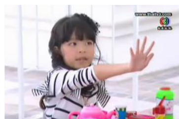
ภาพเด็กหญิงอ้อย ในละครเรื่อง ปัญญาชนก้นครัว ทางช่อง 3