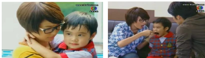
ภาพเด็กชายหมอก ในละครเรื่อง ตะวันฉายในม่านเมฆ ทางช่อง 3

เด็กชายอะตอม ในละครเรื่อง หัวใจเรื่อฟุ้ง จากตารางที่ 4.2 ลำดับที่ 60 เป็นผู้ให้และผู้ช่วยเหลือ โดยอะตอมเป็นหลานชาย ธันยธรณ์(นางเอก) ซึ่งเป็นลูกของรัชธิดาหลานสาวของคน แต่ต้องปกปิดทุกคนรอบข้างเอาไว้ โดยธันยธรณ์พยายามทำงานหนักเลี้ยงดูทั้งสองคนอย่างดี และพยายามสั่งสอนให้เด็กชายอะตอมเป็นคนดี มีจิตใจเอื้ออารีย์ และเลี้ยงไม่ให้อะตอมรู้ความจริงว่า พ่อของเขาคือใคร และพยายามทำให้ทุกอย่างดูเหมือนปกติ จนกระทั่งรัชธิดาเดินทางไปทำงานจนนครราชสีมาและบังเอิญได้พบกับธาริศแฟนเก่า ซึ่งรู้สึกถูกชะตาและสงสัยเกี่ยวกับความสัมพันธ์ของอะตอมและรัชธิดาที่กำลังจะแต่งงานกับน้องชายของตน