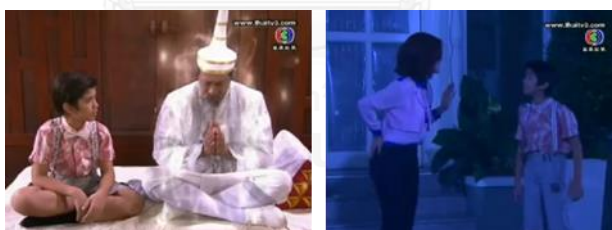
ภาพผีน้อย ในละครเรื่อง ก้นครัวตัวแสบ ทางช่อง 3

ผีน้อย ในละครเรื่อง ก้นครัวตัวแสบ เป็นตัวละคร ผีน้อยหรือนั๊วตร ลูกชายคนโตของนาวิน ปู่ของปานัสม์(พระเอก)ที่เสียชีวิตไปตั้งแต่เด็กๆ แต่วิญญาณยังวนเวียน ดูแลครอบครัวปานัสม์อยู่เสมอ สามารถปรากฏตัวทั้งกลางวันกลางคืน เป็นผู้ช่วยปกป้องหลานของปู่ เมื่อมีคนพยายามคิดร้ายอยากจะทำครอบครองร้านอาหารของตระกูลโดยใช้มนต์ดำและให้รักยมมาทำร้ายกลั่นแกล้งปานัสม์และจิณห์ธัญญา(นางเอก) ที่เข้ามาทำงานเป็นเซฟในร้านด้วย และยังสามารถแปลงร่างเป็นคนช่วยเหลือจิณห์ธัญญา ตอนที่กำลังโดนเด็กรักยมทำร้าย และยังช่วยส่งข่าวข้อมูลให้ปู่ทราบถึงวิญญาณต่างๆที่มาสร้างความรำคาญของหลายชายอีกด้วย