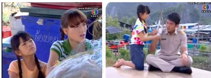
ภาพเด็กหญิงหญิงหญิง ในละครเรื่อง ตะวันยอตรัก ทางช่อง 3

เด็กหญิงหญิงหญิง ในละครเรื่อง ตะวันยอตรัก เป็นเด็กที่พ่อของตะวัน (นางเอก) เก็บมาเลี้ยง และเป็นเด็กลูกสมุนของตะวัน อาศัยอยู่ที่เกาะแห่งหนึ่ง ทำหน้าที่ติดตามตะวันไปที่ต่างๆ จนวันหนึ่งตะวันได้พบกับ ภาคิน(พระเอก)นายตำรวจที่ถูกส่งมาที่หมู่บ้านปล่อยเกาะ เพื่อสืบคดีการค้ายาบ้าริมชายฝั่งทะเล แต่ปลอมตัวเป็นครูสามิภรรยาที่ย้ายมาทำงานที่เกาะ เด็กหญิงหญิงหญิงมีหน้าที่หลัก คือติดตามนางเอก และคอยซักถาม พูดคุยกับตะวัน เพื่อให้ตะวันได้เล่าเรื่องราวชีวิต ความคิดให้ฟัง ซึ่งเป็นส่วนที่ทำให้ผู้ชมได้เข้าใจเรื่องราว ภูมิหลัง ประวัติของตะวันมากขึ้น นอกจากนี้เด็กหญิงหญิงหญิงยังคอยสังเกตความเคลื่อนไหวของครูและเรื่องราวในตลาดแล้วเอามาเล่ารายงานให้ตะวันได้รู้ความเคลื่อนไหวต่างๆ และตะวันมีความใฝ่ฝันจะเป็นดาราทองนักบู๊ ที่ยังต้องฝึกฝนการต่อสู้อยู่อีกมาก หญิงหญิงก็รับบทเป็นกองหนุน คอยเชียร์พี่ตะวันอยู่เสมอ