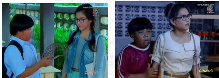
ภาพเด็กชายชิน ในละครเรื่อง รักสุดฤทธิ์ ทางช่อง 3

ทำให้นางเอกตัดสินใจตกลงรับเป็นตัวเตอรให้พระเอก จากที่ทะเลาะกันและปฏิเสธไปแล้ว