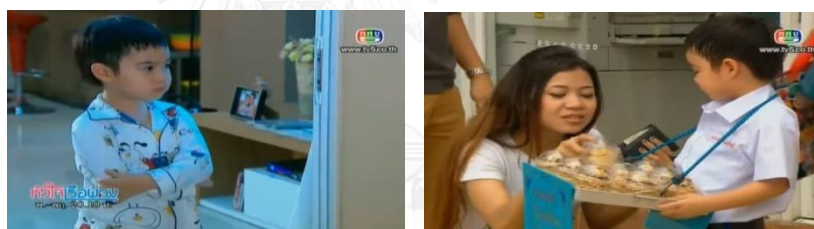
ภาพเด็กชายอะตอมในละครเรื่อง หัวใจเรื่อฟุ้ง

เด็กชายอะตอม ในละครเรื่อง หัวใจเรื่อฟุ้ง จากตารางที่ 4.2 ลำดับที่ 60 เป็นผู้ให้และผู้ช่วยเหลือ โดยอะตอมเป็นหลานชาย ธันยธรณ์(นางเอก) ซึ่งเป็นลูกของรัชธิดาหลานสาวของคน แต่ต้องปกปิดทุกคนรอบข้างเอาไว้ โดยธันยธรณ์พยายามทำงานหนักเลี้ยงดูทั้งสองคนอย่างดี และพยายามสั่งสอนให้เด็กชายอะตอมเป็นคนดี มีจิตใจเอื้ออารีย์ และเลี้ยงไม่ให้อะตอมรู้ความจริงว่า พ่อของเขาคือใคร และพยายามทำให้ทุกอย่างดูเหมือนปกติ จนกระทั่งรัชธิดาเดินทางไปทำงานจนนครราชสีมาและบังเอิญได้พบกับธาริศแฟนเก่า ซึ่งรู้สึกถูกชะตาและสงสัยเกี่ยวกับความสัมพันธ์ของอะตอมและรัชธิดาที่กำลังจะแต่งงานกับน้องชายของตน