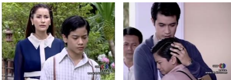
ภาพตัวละครเด็กชายอานนท์ ในละครเรื่อง เซลยศักดิ์

เด็กชายปัด ในละครเรื่อง ผู้ใหญ่ลี้กับนางมา ลูกเลี้ยงของผู้ใหญ่ลี(พระเอก) เป็นตัวละครฝ่ายดี (ฝ่ายธรรมะ) มีบทบาทที่สำคัญที่ช่วยให้พระเอกนางเอกได้แก้ไขสถานการณ์ หรือเมื่อพระเอกไม่สามารถหาทางออกเพื่อสร้างความเข้าใจกับนางเอก ให้ดำเนินเรื่องต่อไปได้ ปัดจะทำหน้าที่เป็นกุญแจสำคัญคอยช่วยไขปัญหา คิดหาทางออกให้พระเอกนางเอกได้กลับมาปรับความเข้าใจกัน อาทิ ตอนที่ผู้ใหญ่ลีไม่เข้าใจนางเอก ปัดทำหน้าที่เป็นตัวช่วยให้ทั้งสองได้พบกัน จากบทสนทนาตอนหนึ่งที่ปัดไปตามผู้ใหญ่ลี้ที่ทุ่งนา บอกว่ามีคนมารอพบอยู่ให้รีบไปหา แต่พระเอกไม่รู้ว่าเป็นใครและไม่อยากรีบร้อน เพราะว่ายังรู้สึกไม่สบายกับเรื่องที่น่างอกหนีตนไปอยู่กรุงเทพฯ และจะไม่กลับมาแล้ว