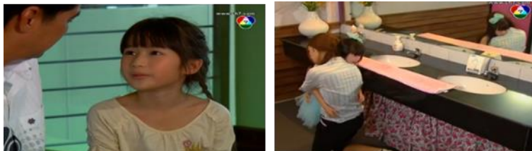
ภาพหนูพุก ในละครเรื่อง เล่ห์นางหงส์ ทางช่อง 7

ความสัมพันธ์ของสุรักและมัทนา และทำหน้าที่เล่าเรื่องราวที่นางเอกช่วยเหลือตนให้พระเอกฟังอยู่เสมอ