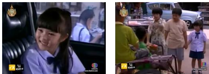
ภาพเด็กหญิงหมู่แดง ในละครเรื่อง หมู่แดง ทางช่อง 3

สถานการณ์การเงินของครอบครัวพ่อแม่เลี้ยงที่กำลังวิกฤต ทำให้เด็กหญิงหมู่แดงพยายามช่วยเหลือดูแลแม่และครอบครัวใหม่โดยไม่ปริปากบ่นอะไรแม้แต่น้อย ส่งผลให้เมื่อหมู่แดงโตขึ้นมาด้วยความเข้าใจชีวิตมากกว่าเด็กทั่วไปและพร้อมจะเรียนรู้และรับมือสถานการณ์ยากลำบากได้เป็นอย่างดี เช่น ตอนที่หมู่แดงต้องเป็นตัวแทนครอบครัวพ่อแม่เลี้ยงไปทำงานใช้หนี้ภาคินัย(พระเอก) แทนทุกคน โดยรับหน้าที่เป็นครูสอนลูกสาวจอมซนของภาคินัย