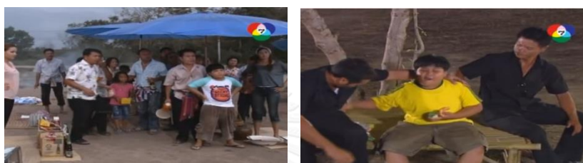
ภาพเด็กชายต๋อย ในละครเรื่อง นางแบบโคกกระโดน

ของต๋อยแก้มอยู่เสมอ จนลอร่าท้อใจจะเลิกสอน แต่อินทร์มีส่วนช่วยให้เด็กๆได้เข้าใจครูลอร่ามากขึ้น และกลายเป็นมิตรที่รักใคร่กันได้ และกิจกรรมสุดสนุกของบักต๋อยกับเด็กนักเรียนโรงเรียนบ้านโคกกระโดน คือ มักจะจับเขี่ยดจับกึ่งก่าตามท้องนาฆ่าปิ้งกิน และชวนลอร่ากินด้วย ลอร่าทำเป็นไม่ยอมกิน แต่ลับหลังแอบกินเขี่ยดอย่างอย่างเอร็ดอร่อย จนบักต๋อยมาเห็นเข้า ลอร่าจึงให้เงินจ้างบักต๋อยว่าอย่าบอกใคร บักต๋อยรับปาก แต่ก็แอบไปส่งสารเล่าเป็นนัย ๆ ให้ครูอินทร์ฟังเวลาอยู่เสมอ นอกจากนี้บักต๋อยยังรู้ว่า ครูลอร่าและครูอินทร์แอบมีใจให้กัน บักต๋อยมักจะเป็นสะพาน หรือเป็นพ่อสื่อ ส่งสารให้ครูอินทร์และลอร่าได้ใกล้ชิดกันอยู่เสมอ