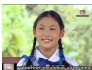
ภาพเด็กหญิงยิ้ม ในละครเรื่อง มาลัยสามชาย ทางช่อง 5

เด็กชายสันติ ในละครเรื่อง ฟ้ากระจ่างดาว สันติ เป็นหลานชายมีคณา (นางเอก) เป็นเด็กนิสัยก้าวร้าว ชอบมีเรื่องชกต่อยกับเพื่อน ๆ ที่โรงเรียนเป็นประจำจนถูกไล่ออก ทางบ้านจึงต้องส่งตัวมาให้มีคณาเป็นคนดูแล มีคณาเองก็ปวดหัวกับพฤติกรรมของหลานชายคนนี้นี่จึงมีปากเสียงกันบ่อย ๆ ครั้งสุดท้ายที่ทะเลาะกัน มีคณาทำโทษสันติอย่างรุนแรงจนสันติหนีออกจากบ้านไปมั่วสุมกับกลุ่มเด็กชายที่ขายบริการทางเพศ ยังดีที่หิรัญย์และ วิมลจิน หมดสาวเพื่อนตำรวจของหิรัญย์ ยื่นมือเข้ามาช่วยตามหาตัวสันติจนเจอ สองป้าหลานปรับความเข้าใจกันได้ด้วยความช่วยเหลือของหิรัญย์ สันติติดหิรัญย์มากเพราะอยากเป็นคนในเครื่องแบบ หิรัญย์จึงสอนให้สันติค่อย ๆ ปรับตัวให้เข้ากับสังคมใหม่