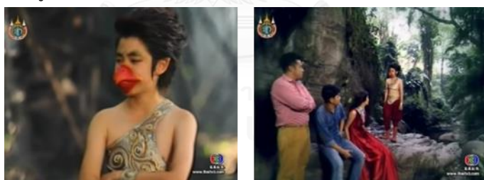
ภาพตรีสวี ในละครเรื่อง มณีแดนสรวง ตรีสวี ทางช่อง 3

ตรีสวี ในละครเรื่อง มณีแดนสรวง ตรีสวี เป็น ลูกครุฑน้อย หรือเด็กชายอายุประมาณ ๗ ขวบ ฉลาดเฉลียว ช่างพูดช่างเจรจา มีความรู้เรื่องป่าหิมพานต์มาก กำลังเดินทางกลับไปยังเมืองฉิมพลี แต่มีอุบัติเหตุบาดเจ็บบริเวณปีกเสียก่อน ทำให้ได้มาพบกับนางฟ้าหรือรัศมีชโลธร(นางเอก) และสการ(พระเอก) และเป็นผู้ช่วยของสการ(พระเอก) เวลาที่ไปตามหารัศมีชโลธรจนกระทั่งพบในที่ที่สุด และสามารถช่วยชีวิตรัศมีชโลธรได้ด้วย นางเอกยังขอร้องให้ช่วยตามหาเหล่าอสูรและ ช่วยนำทางพระเอกนางเอกไปหาอสูรได้อีกด้วย