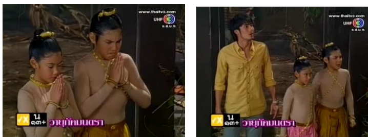
ภาพรัก-ยม ในละครเรื่อง วายุกัมนตรา ทางช่อง 3

5. หน้าที่ตัวละครเด็กและความสำคัญในการเดินทางไปสถานที่ต่างๆ คือ ตัวละครเอกออกค้นหา