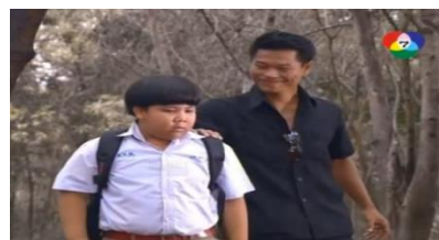
ภาพเด็กชายต๋อย ในละครเรื่องนางแบบโคกกระโดน ช่อง 7

เด็กชายตือ ลักษณะตัวละครทำหน้าที่ 3 ลักษณะ คือ ผู้ให้ ผู้ช่วยเหลือ และผู้ส่งสารในละคร เรื่อง ลิเกเงินร้อย ในตารางที่ 4.1 ลำดับที่ 36 ยังทำหน้าที่การเป็นสื่อ คือช่วงส่งสารและร่วมอยู่ใน เหตุการณ์ธงทอง (พระเอก) เสียใจอย่างมากที่รู้ว่าครอบครัวของแก้ว (นางเอก) มาพาตัวแก้วออกจาก