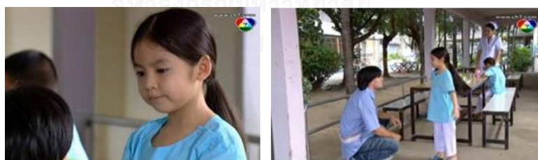
ภาพลูกหนู ในละครเรื่อง ยอดชายนายตึกตึก ทางช่อง 7

บทบาทของลูกหนู ถือเป็นการนำเสนอที่ช่วยเสริมและสะท้อนคุณค่าทางจิตใจในตัวพระเอก แม้จะสลักร่างก็ตาม แต่ทำให้ผู้ชมสามารถเข้าใจด้านดีของพระเอกได้ชัดเจนขึ้นอีกทางหนึ่ง