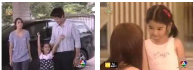
ภาพเด็กหญิงขนมฝั่ง ในละครเรื่อง ทวานใจทัยคร้ว ช่อง 7

ตัวละครฝ่ายร้าย ที่เข้ามาหาพระเอกเพื่อหวังผลประโยชน์ ซึ่งเด็กหญิงขนมฝั่งเอง สามารถจะเป็นตัวต่อรองและกรีดกันพงศรจากตัวละครฝ่ายร้าย เช่น เหตุการณ์ที่ขนมฝั่งไม่ยอมจะไปเที่ยวกับตัวละครร้าย พงศรก็ยอมตามใจ ทำให้เธอไม่พอใจเป็นอย่างมาก