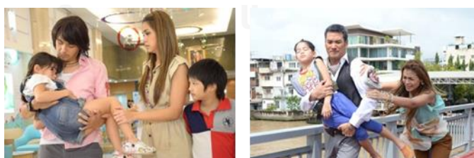
ภาพเด็กหญิงจิตต์ เด็กชายแจ๊ส เด็กหญิงจีจ๋า จากละครเรื่อง มือปราบพ่อลูกอ่อน ทางช่อง 3

เด็กหญิงจิตต์ เด็กชายแจ๊ส เด็กหญิงจีจ๋า จากละครเรื่อง มือปราบพ่อลูกอ่อน เป็นเด็กชายหญิง 3 คนพี่น้อง ที่อาศัยอยู่กับน้ำพิมมาตา(นางเอก) และบังเอิญได้อยู่ร่วมเหตุการณ์จับคนร้ายกับ กริสน์ (พระเอก) ที่มีอาชีพเป็นตำรวจสายสืบในเรื่อง ซึ่งเป็นจุดเริ่มต้นให้เด็กหญิงจีจ๋า น้องสาวคนเล็กสุด รู้สึกรักและผูกพัน ร่วมถึงชื่นชมในสามารถของ กริสน์ เป็นอย่างมาก แต่ตรงข้ามกับพิมที่รู้สึกเป็นห่วงและขัดขวางหลานทั้ง 3 คนไม่ให้เข้าไปยุ่ง หรือเกี่ยวข้องกับ กริสน์ โดดเด็ดขาด แต่เด็กหญิงจีจ๋าก็รู้สึกโกรธเคืองและไม่เข้าใจในตัวน้ำพิมของตนเองเป็นอย่างมากว่า เหตุใด ทำไมถึงไม่ชอบและกีดกันตนไม่ให้พบกับ กริสน์ เด็กหญิงจีจ๋ายายตามพระเอก ที่กำลังไปปฏิบัติภารกิจจับคนร้ายหลายครั้ง จนกระทั่งเรื่องราวดำเนินมาถึงจุดวิกฤต เมื่อเด็กหญิงจีจ๋าถูกโจรจับตัวไป และกลายเป็นตัวประกันสำคัญ ที่สร้างวิกฤตให้ตัวละครเอก ไปจนถึงการช่วยเหลือเพื่อคลี่คลายสถานการณ์จนลุล่วงได้ และยังช่วยอธิบายและทำให้นางเอกเข้าใจพระเอกในการทำงานและมุมมองของพระเอกมากขึ้น และยังช่วยให้พระเอกเปิดโปงมาเฟีย(ตัวร้าย)ที่พระเอกตามจับตัวอยู่ ซึ่งเข้ามาตีสนิทและสร้างความสัมพันธ์กับนางเอกอีกด้วย