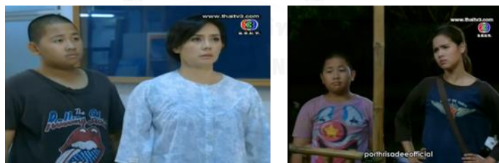
ภาพเด็กชายเพี้ยน จากละครเรื่อง ดาวเรือง ทางช่อง 3

เด็กชายเพี้ยน จากละครเรื่อง ดาวเรือง ในตารางที่4.2 ลำดับที่ 39 เด็กชายเพี้ยน เป็นลูกน้อง หรือลูกสมุนของลูกพี่เรื่อง หรือดาวเรือง นางเอกของเรื่อง เพี้ยนเป็นทั้งเพื่อนเล่น ผู้ช่วยที่พร้อมทำตามความต้องการของดาวเรืองในทุกเรื่อง ไม่ว่าจะดาวเรืองจะเอ่ยปากสั่งอะไร เพี้ยนพร้อมจะช่วยเหลือ หรือหาทางทำตามความต้องการของดาวเรืองจนสำเร็จจุลวง แม้ว่าสิ่งที่ ดาวเรืองสั่งจะเป็นสิ่งที่ผิดกฎหมายอย่างการต้มเหล้าเถื่อนก็ตาม และเป็นที่รู้จักกันในหมู่บ้านว่า ถ้าลูกพี่ลูกน้องสหายคู่นี้ปรากฏตัวที่ใด ย่อมเกิดเรื่องอะไรขึ้นแน่นอน หรือทั้งสองกำลังคิดพิเรนทำแผนการอะไรอยู่