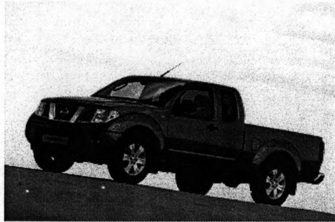
รถยนต์กระบะ