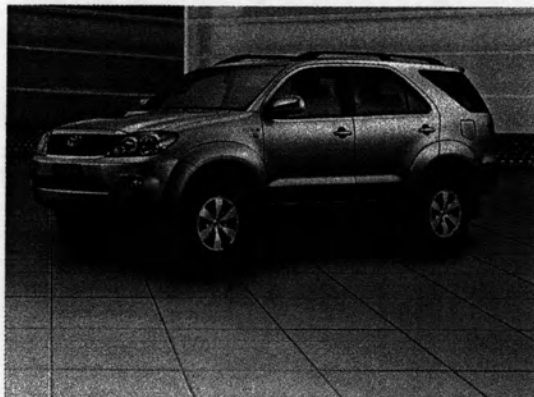
รถยนต์นั่งกึ่งบรรทุก (Pick-up Passenger Vehicle: PPV)