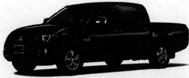
รถยนต์นั่งที่มีกระบะ (Double Cab)