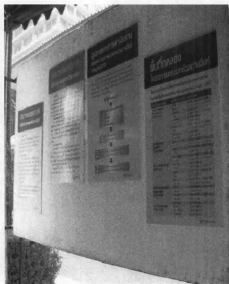
บอร์ดนิทรรศการ