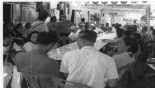
การจัดกิจกรรมรณรงค์ยุติความรุนแรงต่อผู้หญิง สถานที่จัดกิจกรรมรณรงค์ : ชุมชนสวนอ้อย เขตคลองเตย โดยได้รับการสนับสนุนในการจัดกิจกรรมจากมูลนิธิเพื่อนหญิง