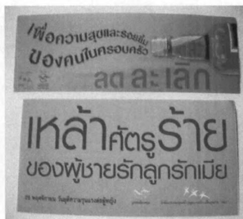
สติ๊กเกอร์