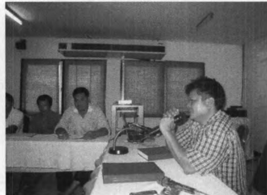
กิจกรรมประชุมกลุ่มสนับสนุนแกนนำผู้ชายเล็กเหล่าเล็กใช้ความรุนแรง สถานที่จัดการประชุม : วิเทรน อินเทอร์เน็ตเซ็นทรัลเฮ้าส์ ดอนเมือง กรุงเทพฯ