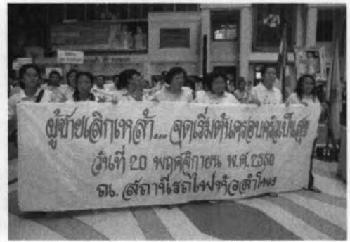
การจัดกิจกรรมรณรงค์ “ผู้ขายเล็กเหล่า...จุดเริ่มต้นครอบครัวเป็นสุข” สถานที่จัดกิจกรรมรณรงค์ : สถานีรถไฟหัวลำโพง