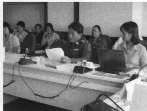
การประชุมทีมสหวิชาชีพ (Case Conference)