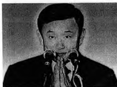
พ.ต.ท.ทักษิณ ชินวัตร แถลงเปิดใจไม่รับตำแหน่งนายกฯ เพื่อความสมานฉันท์ของชาติ

ในวันอังคารที่ 4 เมษายน 2549 ภายหลังจากเข้าเฝ้าฯ พระบาทสมเด็จพระเจ้าอยู่หัว พ.ต.ท.ทักษิณ ชินวัตร รักษาการนายกรัฐมนตรี ประกาศไม่รับตำแหน่งนายกรัฐมนตรี พร้อมขอโทษประชาชน 16 ล้านคนที่ลงคะแนนให้พรรคไทยรักไทย โดยเหตุผลหลักคือเพื่อความสมานฉันท์ของชาติในวโรกาสฉลองสิริราชสมบัติครบ 60 ปีของพระบาทสมเด็จพระเจ้าอยู่หัว (สำนักข่าวกรมประชาสัมพันธ์)