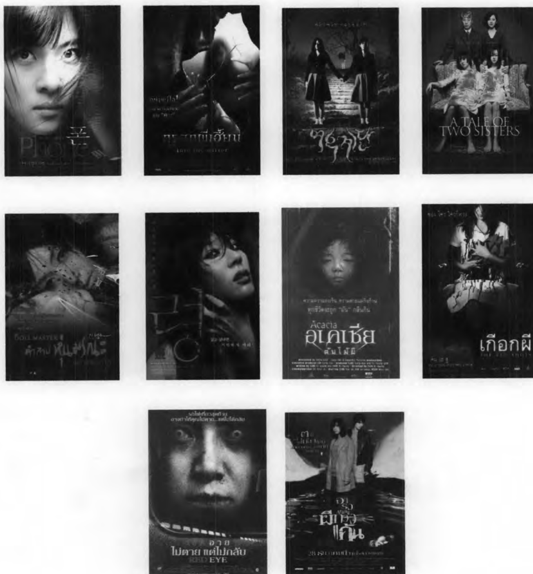
ภาพที่ 6 ภาพแสดงโปสเตอร์หนังผีเกาหลีทั้ง 10 เรื่อง

3.2.3.3 หนังผีไทย ผู้วิจัยได้คัดเลือกกลุ่มตัวอย่างแบบเจาะจง (Purposive Sampling) โดยพิจารณาจากความสำเร็จของหนังผีไทยในด้านรางวัลและรายได้ นอกจากนี้ยังคัดเลือกเฉพาะหนังผีที่มีแก่นเรื่องเป็นเรื่องราวเกี่ยวกับผีและเป็นหนังผีที่ไม่ได้เน้นความตลกขบขันมากกว่าความน่าสะพรึงกลัว นอกจากนี้ยังตั้งกระทู้สำรวจความเห็นจากผู้ใช้อินเทอร์เน็ตในเวบไซต์ http://www.pantip.com/cafe/chalermthai/ ในวันที่ 22 พฤศจิกายน พ.ศ. 2550 ผลการ