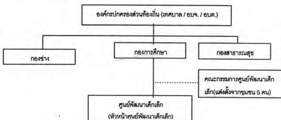
แผนภาพที่ 3 แสดงรูปแบบการจัดตั้งศูนย์พัฒนาเด็กเล็ก รูปแบบที่ 1 (กรมการปกครอง, 2545)

รูปแบบที่ 1 ศูนย์พัฒนาเด็กเล็กซึ่งองค์กรปกครองส่วนท้องถิ่นเป็นผู้บริหารจัดการ รูปแบบนี้องค์กรปกครองส่วนท้องถิ่นเป็นผู้จัดตั้ง และรับผิดชอบศูนย์พัฒนาเด็กเล็ก โดยจัดหา หรือจัดจ้างบุคลากรทางการศึกษาเป็นหัวหน้าศูนย์พัฒนาเด็กเล็ก และแต่งตั้งคณะกรรมการพัฒนาศูนย์พัฒนาเด็กเล็ก โดยหัวหน้าศูนย์เป็นผู้บริหารจัดการศูนย์ฯ และดำเนินการเลือก หรือจัดให้มีการคัดเลือกคณะกรรมการศูนย์พัฒนาเด็กเล็ก และให้คณะกรรมการศูนย์พัฒนาเด็กเล็ก พิจารณากำหนดจำนวนตามความเหมาะสม แต่จะต้องประกอบด้วยผู้ทรงคุณวุฒิทางการศึกษา ผู้แทนองค์กรปกครองส่วนท้องถิ่น ผู้แทนกลุ่มองค์กรประชาคม ผู้แทนผู้ประกอบการ ผู้แทนครู อย่างละไม่น้อยกว่า 1 คน โดยมีหัวหน้าศูนย์ฯ เป็นเลขานุการ