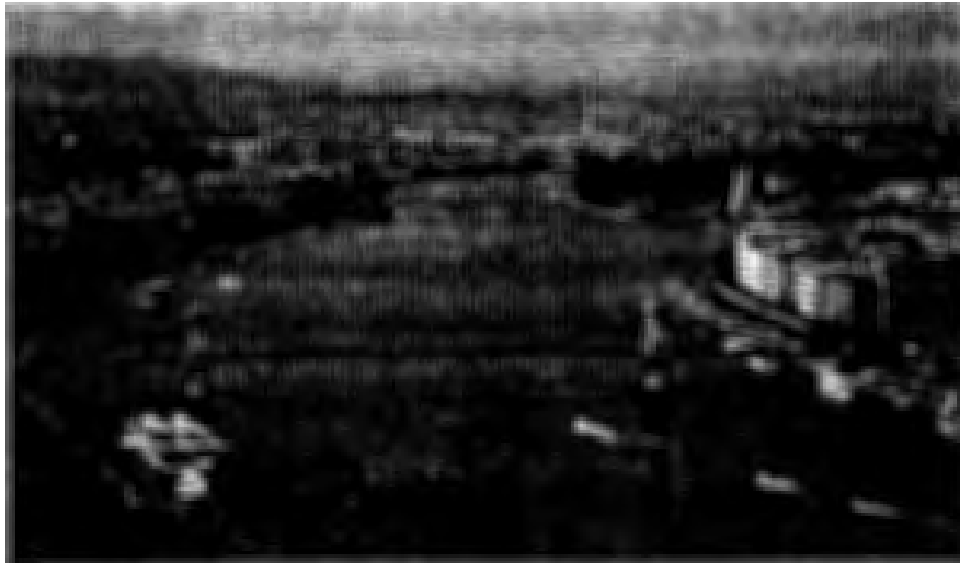
แม่น้ำดานูบบริเวณเมืองบูดาและเมืองเปสต์ในฮังการี

เขตคาบสมุทรบอลข่านนี้ แม้ว่าจะเป็นภูเขาและที่สูง แต่ก็ยังมีแม่น้ำสายสั้นไหลผ่านหลายสาย แม่น้ำเหล่านี้มักจะก่อให้เกิดที่ราบลุ่มระหว่างภูเขา และกลายเป็นแหล่งเพาะปลูกสำคัญ เช่น แม่น้ำดราวา (Dráva) และแม่น้ำซาวา (Sava) ซึ่งเกิดจากเทือกเขาแอลป์ในออสเตรีย และไหลไปทางตะวันออกผ่านสโลเวเนีย และโครเอเชีย แล้วไหลลงแม่น้ำดานูบ แม่น้ำซาวานั้นไหลผ่านเมืองหลวงลูบลิยานา (Ljubljana) ของสโลเวเนีย ซาเกรบ (Zagreb) ของโครเอเชีย และมาเชื่อมกับแม่น้ำดานูบที่กรุงเบลเกรด (เซิร์บ-Beograd) เมืองหลวงของเซอร์เบีย นอกจากนี้แม่น้ำซาวายังมีแม่น้ำบอสนา (Bosna) ไหลมาบรรจบ แม่น้ำบอสนานั้นเกิดจากภูเขาดอนกลางของบอสเนีย ส่วนแม่น้ำสำคัญอีกสายหนึ่งก็คือแม่น้ำโมราวา (Morava) ๒ ที่เกิดจากเทือกเขาในมาซิโดเนียแล้วไหลผ่าน