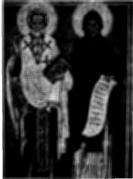
บาทหลวงซีริล และบาทหลวงเมธอดิอุส

การเมือง เพราะภาษาเป็นตัวกลางสำคัญที่บ่งบอกว่าลัทธิชาตินิยม ดังนั้น ชาวสโลวักจึงพยายามจะอธิบายว่าภาษาของตนไม่ใช่ภาษาเดียวกับเช็ก ในโมลโดวาสมัยที่รวมอยู่ในสหภาพโซเวียตก็ได้มีการใช้ตัวอักษรซีริลลิกแบบรัสเซียเป็นภาษาเขียน แทนที่จะเป็นอักษรแบบโรมันเพื่อให้แตกต่างจากโรมาเนีย ต่อมาหลังแยกตัวเป็นเอกราชได้มีการรื้อฟื้นอักษรลาติน แต่ก็ใช้คำว่า