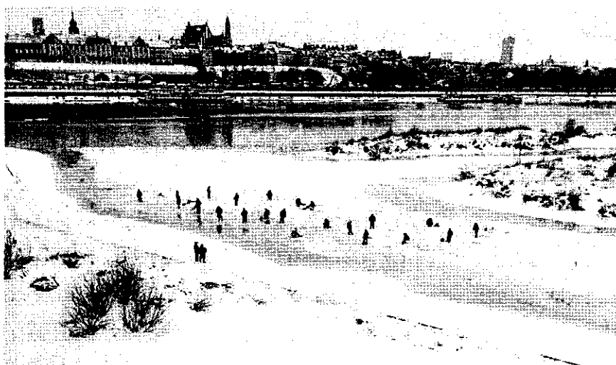
แม่น้ำวิสตุลาขณะผ่านกรุงวอร์ซอ

ที่ราบในเขตปรัสเซีย มีเทือกเขาใหญ่เป็นแนวกันทางตอนใต้ นั่นคือ เทือกเขาสูเดเตน (เช็ก - Sudety) และ เทือกเขาคาร์ปาเทียน (สโลวัก - Karpaty) ซึ่งก่อให้เกิดที่ราบสูงในเขตไซลีเซีย (โปแลนด์ - Śląsk) และกาลิเซีย (โปแลนด์ - Małopolska) เป็นแนวขอบ ในเขตที่ราบใหญ่นี้เป็นเขตของประเทศโปแลนด์เป็นสำคัญ โดยพื้นที่เป็นที่ราบลุ่มแม่น้ำ คือแม่น้ำวิสตุลา (Wisła) ซึ่งเป็นแม่น้ำสายหลักของประเทศ เกิดจากเทือกเขาคาร์ปาเทียน ในเขตไซลีเซีย ไหลไปทางทิศเหนือผ่านกรุงวอร์ซอ (Warszawa) มีแม่น้ำนาเรฟ (Narew) และแม่น้ำบुक (Buk) ไหลมาบรรจบ แล้วออกสู่ทะเลบอลติกที่อ่าวกดังสค์ (Gdańsk) นอกจากนี้ ที่สำคัญอีกสายหนึ่ง คือแม่น้ำโอเดร (Odra) ซึ่งเกิดจากเทือกเขาคาร์ปาเทียน แล้วไหลผ่านแคว้นไซลีเซียแล้วมีแม่น้ำนีซ (โปแลนด์ - Nysa Łużycka) และแม่น้ำวาร์ธา (Warta) ไหลมาบรรจบ และไหลออกทะเลบอลติกเช่นกัน แนวของแม่น้ำนีซ และแม่น้ำโอเดรนี้ ปัจจุบันกลายเป็นเส้นกั้นอาณาเขตระหว่างโปแลนด์กับเยอรมนี ตอนบนของที่ราบโปแลนด์ ริมทะเลบอลติกนั้น เรียกว่า 'เขตปอมเมอราเนีย (Pomorze)' เป็นเขตหินเก่า ซึ่งเกิดจากการกระทำของธารน้ำแข็ง จึงมีทะเลสาบจำนวนมาก