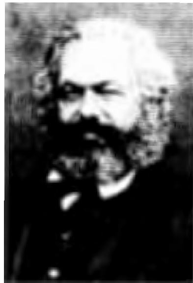
คาร์ล มาร์กซ์

หลักการสำคัญของลัทธิมาร์กซ์ไม่ได้อยู่ที่การวิเคราะห์หรืออธิบายสังคมเก่า หรือสังคมทุนนิยมอย่างรอบด้านเท่านั้น แต่อยู่ที่การนำเสนอสังคมใหม่ ซึ่งเป็นสังคมอุดมคติที่มนุษย์จะมีความเสมอภาค และภราดรภาพอย่างแท้จริง สังคมอุดมคตินี้ไม่ใช่เป็นเรื่องเพ้อฝัน แต่สามารถ สร้างขึ้นได้โดยประชาชน เพราะมาร์กซ์ได้อธิบายว่า การผลิตสมัยใหม่ของชนชั้นนายทุน ได้สร้างชนชั้นใหม่ขึ้นนั่นคือ ชนชั้นกรรมาชีพ ที่ไร้กรรมสิทธิ์ และถูกกดขี่อย่างถึงที่สุด การกดขี่อันรุนแรงเช่นนี้จะทำให้ชนชั้นกรรมาชีพต้องลุกขึ้นสู้ ซึ่งอาจเริ่มจากการต่อสู้เพื่อทำลายเครื่องจักรของนายทุน แต่ต่อมาชนชั้นกรรมาชีพจะพัฒนาจิตสำนึก และก่อการปฏิวัติเพื่อโค่นล้มสังคมทุนนิยมให้หมดสิ้นไป และสถาปนาสังคมใหม่แห่ง