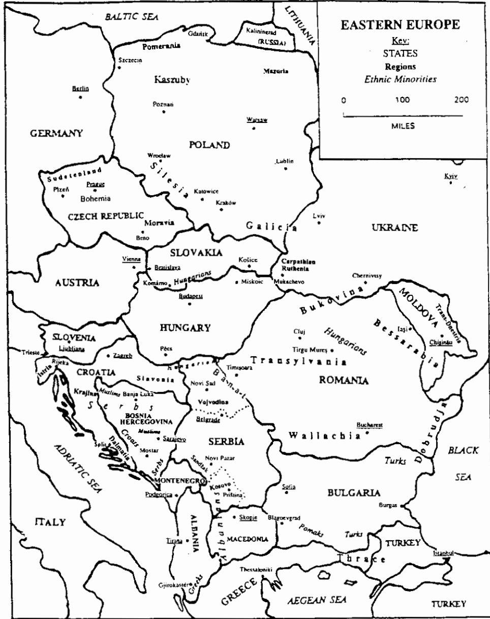
แผนที่ยุโรปตะวันออกปัจจุบัน