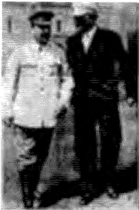
ดิมิทรอฟกับสตาลิน ค.ศ. ๑๙๓๖

วันที่ ๘ กันยายน ค.ศ. ๑๙๔๔ ในขณะที่กองทัพ