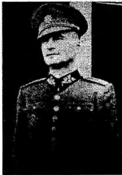
พลจัตวา ยาน โกลเลียน

นอกจากนี้ ยังได้มีการจัดตั้งกองทัพเชโกสโลวาเกียอิสระที่ ๑ ในดินแดนโซเวียต นำโดยพลเอก