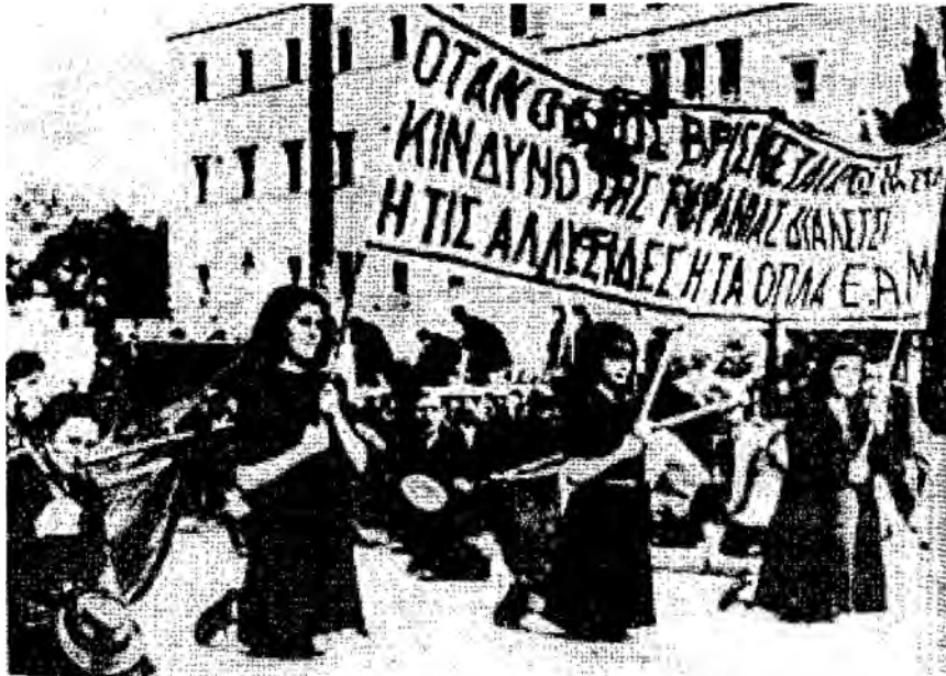
การเดินขบวนของนักศึกษาที่สนับสนุนพรรคคอมมิวนิสต์กรีซ ธันวาคม ค.ศ.๑๙๔๔

เมื่อเยอรมนีเริ่มถอนทหารจากกรีซในเดือนกันยายน ค.ศ.๑๙๔๔ จากนั้นกองทัพอังกฤษได้ยกเข้ารักษาสถานการณ์แทน รัฐบาลปราป็น เดรอูกลับมากองเฮเธนส์ในวันที่ ๑๘ ตุลาคม และขอให้กองกำลังอาวุธ ทุกฝ่ายยุติบทบาทลง เพื่อทำให้เกิดการลงประชามติในเรื่องสถานะ ของสถาบันกษัตริย์ และให้มีการเลือกตั้งทั่วไป แต่ฝ่ายพรรค คอมมิวนิสต์เสนอให้ยุบหน่วยทหารรัฐบาลลงด้วย ฝ่ายรัฐบาลไม่ยินยอม ในวันที่ ๓ ธันวาคม พรรคคอมมิวนิสต์จึงลาออกจากรัฐบาลผสม และ เรียกร้องให้เดินขบวนใหญ่ต่อต้านรัฐบาล กรณีนำมาซึ่งเหตุการณ์ที่ เรียกว่า ‘กรณีเดือนธันวาคม’ (Dekemvriana) เริ่มจากการที่นักศึกษาและ