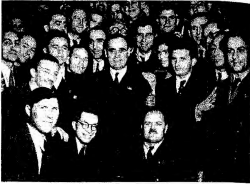
คณะพรรคคอมมิวนิสต์โรมาเนียเมื่อยึดอำนาจใน ค.ศ. ๑๙๔๘ คนกลางภาพคือ เกออร์กู เด็ช และ นีโคไล เซาเชสคู

ล้านคน ซึ่งทำให้ได้รับความนิยมอย่างมาก แต่กษัตริย์มิฮาอิลไม่พอใจ ได้พยายามกดดันให้กรอซาลาออกจากตำแหน่ง ตั้งแต่วันที่ ๒๗ สิงหาคม ค.ศ. ๑๙๔๕ พระองค์ปฏิเสธที่จะลงนามในกฎหมายทุกฉบับที่ผ่านโดยคณะรัฐบาล ในที่สุดได้มีการประนีประนอม โดยรัฐบาลแนวร่วมยอมให้ฝ่ายค้านส่งตัวแทนเข้าร่วมด้วย