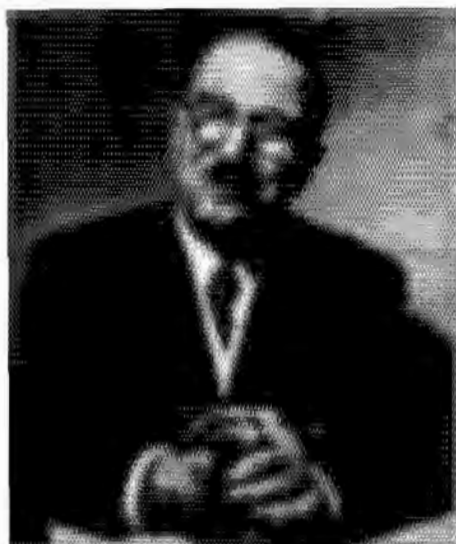
ยอริยโอส ซัชานโอส