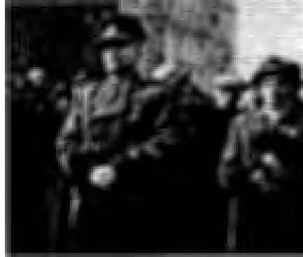
พลเอกลูควิก สโวโบดา

๒. การยึดครองของกองทัพแดงโซเวียตเข้ามามีส่วนกดดันให้ตั้งรัฐบาลใหม่ นำโดยแนวร่วมทางการเมืองที่เป็นมิตรกับโซเวียต และให้พรรคคอมมิวนิสต์มีบทบาทโดยมากในรัฐบาลผสม พรรคคอมมิวนิสต์จะควบคุมตำแหน่งรัฐมนตรีกลาโหม หรือมหาดไทยที่จะมีหน้าที่ในด้านความมั่นคง มีการตั้งกองกำลังพรรคคอมมิวนิสต์ขึ้น