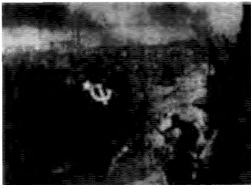
ทหารโซเวียตโบกธงเหนือกรุงเบอร์ลิน หลังจากได้รับชัยชนะในสงคราม

ในวันที่ ๕ พฤษภาคม ค.ศ.๑๙๔๘ รัฐสภาชุดเดิมได้ประกาศใช้รัฐธรรมนูญฉบับใหม่ ให้เชโกสโลวาเกียเป็น 'สาธารณรัฐประชาชน' ในขณะที่มีการเตรียมการเลือกตั้ง พรรคสังคมนิยมไปโดยถูกบีบให้ยุบรวมกับพรรคคอมมิวนิสต์ และพรรคการเมืองที่ถูกพิจารณาว่าเป็นพรรคชนชั้นนายทุนถูกยุบทั้งหมด เหลือเพียงพรรคสังคมนิยม พรรค