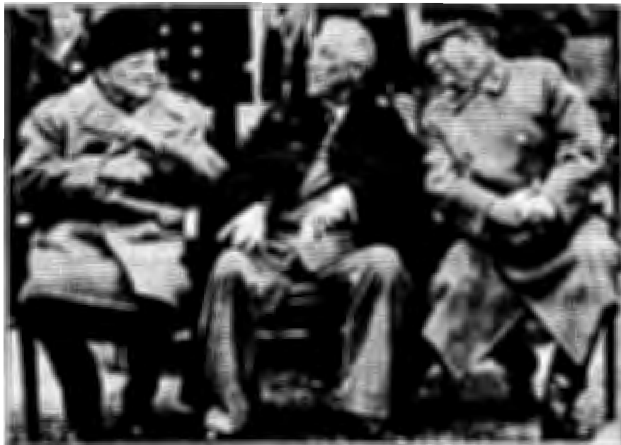
การพบปะขั้นสุดยอดของสามผู้นำฝ่ายสัมพันธมิตรที่จะกำหนดชะตากรรมของยุโรปที่ยึดดาในแหลมไครเมีย กุมภาพันธ์ ค.ศ.๑๙๔๕ จากซ้ายคือ วินสตัน เชอร์ชิล แห่งอังกฤษ แฟรงคลิน ดี. รูสเวลต์ แห่งสหรัฐอเมริกา และ โยเซฟ สตาลิน แห่งสหภาพโซเวียต

๑. สงครามโลกครั้งที่สองเป็นเงื่อนไขจากการที่หลายประเทศตกอยู่ภายใต้การยึดครองของเยอรมนี สภาพความลำบากยากแค้นของประชาชนเป็นไปอย่างรุนแรง และเมื่อแพ้สงคราม พลังการเมืองฝ่ายอื่น เช่น กษัตริย์นิยม หรือ ฟาสซิสต์อ่อนกำลังลง