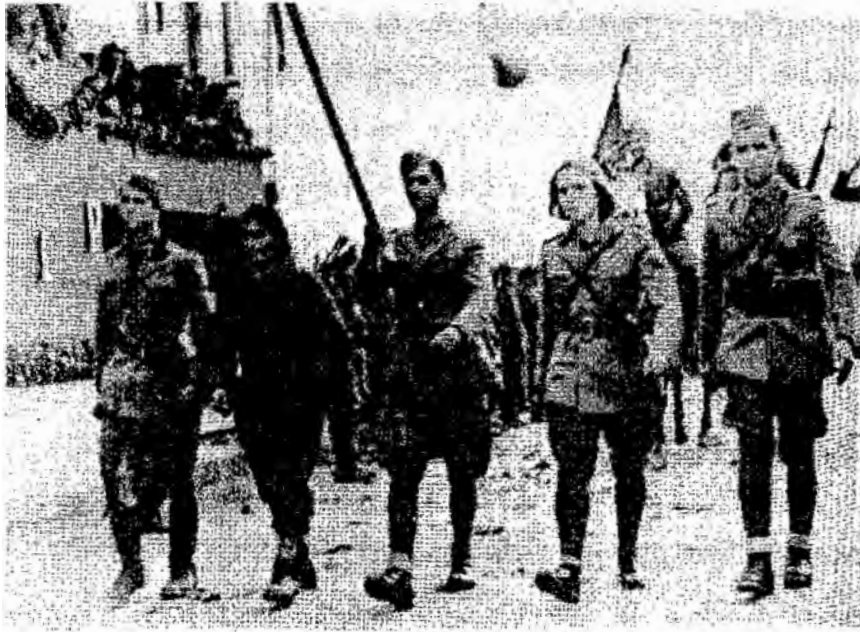
กองทัพประชาชนอัลบาเนียเดินทัพเข้ากรุงตริานา เดือนพฤศจิกายน ค.ศ.๑๙๔๔

พฤศจิกายน ค.ศ.๑๙๔๔ หลังจากที่เยอรมนีถอนทหารหน่วยสุดท้ายจากประเทศ รัฐบาลรักษากรได้รับการสนับสนุนอย่างมากจากประชาชน แต่กระนั้น อัลบาเนียยังมีปัญหาเอกภาพ เพราะกองกำลังฝ่ายชาตินิยมยังคงตั้งอยู่ในเขตภาคเหนือ อีกทั้งความสัมพันธ์กับพรรคคอมมิวนิสต์ยูโกสลาเวียก็ไม่ราบรื่น เพราะปัญหาเรื่องดินแดนโคโซโว และการที่ฝ่ายพรรคคอมมิวนิสต์ยูโกสลาเวียเห็นว่า โอลิชาแฉ็งกร้าวและชาตินิยมจัดเกินไป ส่วนกรีซก็ไม่รับรองรัฐบาลชั่วคราว เพราะต้องการเรียกเรื่องดินแดนเอพิรุสเหนือ ซึ่งกรีซอ้างว่าประชากรส่วนข้างมากเป็นชาวกรีก นอกจากนี้ก็คือปัญหาเศรษฐกิจที่ได้รับความเสียหายอย่างมากจากภาวะสงคราม ดังนั้น รัฐบาลชั่วคราวจึงยอมคืนโคโซโวให้ยูโกสลาเวียเพื่อลดความขัดแย้ง และบูรณะประเทศอย่างรวดเร็ว โดยใช้นโยบายสังคมนิยมที่เข้มงวด แล้วพยายามสร้างความสามัคคีโดยปรับแนวร่วมปลดปล่อยเป็นแนวร่วมประชาธิปไตย เพื่อให้ฝ่ายต่างๆ เข้าร่วมได้กว้างขวางขึ้นนั้น จนถึงวันที่ ๒ ธันวาคม ค.ศ.๑๙๔๕ มีการเลือกตั้ง ผลปรากฏว่าแนว