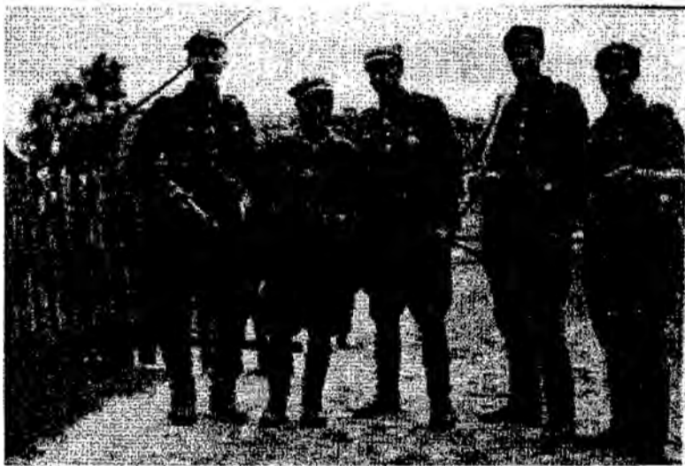
กลุ่มผู้นำกองทัพบ้านเกิดเมืองนอนโปแลนด์ ค.ศ. ๑๙๔๔

จนเมื่อเกิดสงครามโลกครั้งที่สอง ประเทศโปแลนด์อยู่ภายใต้ การยึดครองของเยอรมนี ได้มีการตั้งรัฐบาลพลัดถิ่นในลอนดอนนำโดย สตานิสวาฟ มิโคไวชชีก (Stanisław Mikołajczyk, ๑๘๐๑-๑๙๖๖) ผู้นำ พรรคเกษตรกรแห่งชาติ ขณะที่ภายในประเทศได้เกิดขบวนการต่อสู้เพื่อ เอกราชมากมายที่ใหญ่ที่สุดคือ กลุ่มกองทัพบ้านเกิดเมืองนอน (AK) นำโดย สเตฟาน โรเฟทสกี (Stefan Rowecki, ๑๘๙๕-๑๙๔๔) ซึ่งถูกขึ้น สู้ในเดือนสิงหาคม ค.ศ. ๑๙๔๔ แล้วพ่ายแพ้ถูกเยอรมนีปราบลงได้ นอกจากนี้ ก็คือ พรรคคอมมิวนิสต์ที่ต้งขึ้นใหม่ ในชื่อว่า พรรคกรรมกร โปแลนด์ (Polska Partia Robotnicza-PPR) เมื่อเดือนมกราคม ค.ศ. ๑๙๔๒ นำโดย มาร์เซลี นอฟอตกา (Morcei Nowotka, ๑๘๙๓-๑๙๔๒) ต่อมา