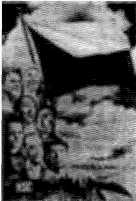
โปสเตอร์แสดงให้เห็นความยินดีในการปฏิวัติ ของประชาชนเชโกสโลวาเกียทุกเหล่า

ล้านคนภายใน ๑ ปี หลังจาก สงคราม วันที่ ๒๖ พฤษภาคม ค.ศ. ๑๙๔๖ มีการเลือกตั้งทั่วไปครั้งแรกหลังสงคราม พรรคคอมมิวนิสต์ได้เสียงถึง ๓๑.๕% ซึ่งส่วนมากจะได้จาก ทางเขตเช็ก ส่วนในสโลวาเกีย พรรคประชาธิปไตย เป็นพรรค ที่ได้คะแนนเสียงมากที่สุด คือ ๖๒% แต่โดยรวมแล้ว แนวร่วมแห่งชาติที่นำโดยพรรค คอมมิวนิสต์ได้เสียงสนับสนุน มากที่สุด จึงได้เป็นแกนนำ จัดตั้งรัฐบาลกบฏ กอควาลด์ หัวหน้าพรรคคอมมิวนิสต์ได้