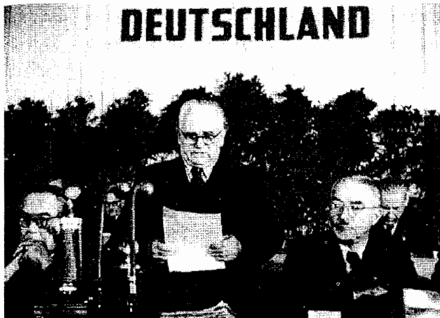
ประธานาธิบดีอูลเบร็คท์ ประกาศตั้งประเทศเยอรมนีตะวันออก ค.ศ.๑๙๔๙

และออตโต โกรเทวอห์ลรับตำแหน่งนายกรัฐมนตรี แต่อำนาจในการตัดสินใจยังขึ้นอยู่กับวอลเตอร์ อูลเบร็คท์ (Walter Ulbricht, ๑๘๙๓-๑๙๗๓) ซึ่งรับตำแหน่งเลขาธิการใหญ่ของพรรคเอกภาพสังคมนิยมเมื่อเดือนกรกฎาคม ค.ศ.๑๙๕๐ และได้นำแนวทางอันเข้มงวดของลัทธิสเตาลินเข้ามาใช้ในประเทศ อูลเบร็คท์เป็นอดีตช่างไม้ เข้าร่วมพรรคสังคมนิยมประชาธิปไตยเยอรมนี เมื่อ ค.ศ.๑๙๑๒ และต่อมาเป็นสมาชิกกลุ่มสันนิบาตสปาร์ตาคัส และร่วมก่อตั้งพรรคคอมมิวนิสต์เยอรมนี เขาได้เป็นสมาชิกสภาของเมืองไลพ์ซิก ระหว่าง ค.ศ.๑๙๒๘-๑๙๓๓ เมื่อพรรคนาซีขึ้นสู่อำนาจ เขาต้องหนีไปลี้ภัยที่ปารีสและมอสโคว์ และกลับประเทศใน ค.ศ.๑๙๔๕ พร้อมกับกองทัพแดงโซเวียต ได้รับตำแหน่งสำคัญในพรรคเอกภาพสังคมนิยมต่อมา