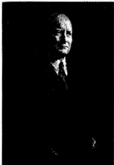
สτανิสวอฟ มิโคไวชชีก

ในเดือนธันวาคม ค.ศ.๑๙๔๑ ฟวาคี สวาฟ โคมูวกา (Władysław Gomułka, ๑๙๐๕-๑๙๘๒) ได้รับเลือกเป็น เลขาธิการพรรค และมีการตั้งกองทัพ ประชาชนโปแลนด์ (Armie Ludowa) ขึ้นทำการต่อสู้กับเยอรมนีเช่นกัน เพียงแต่กองทัพประชาชนมีขนาดเล็ก กว่ากองทัพบ้านเกิดเมืองนอนอย่างมาก รัฐบาลพลัดถิ่นโปแลนด์ที่กรุง ลอนดอนขัดแย้งกับสหภาพโซเวียตใน เรื่องกรณีสังหารหมู่ที่ปาดะทิน ดังนั้น ในวันที่ ๒๖ กรกฎาคม ค.ศ.๑๙๔๔