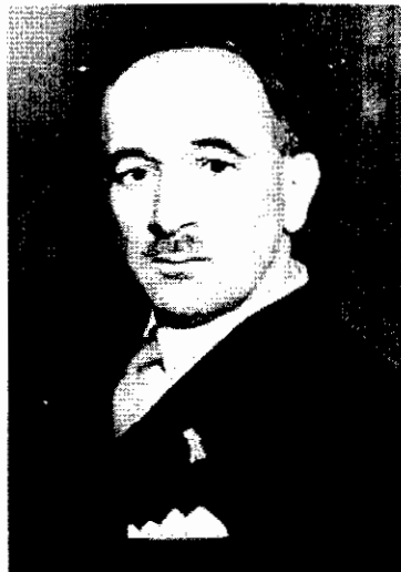
เอ็ดวาร์ด เบเนช

ในระหว่างนี้ พรรคคอมมิวนิสต์เชโกสโลวาเกียเริ่มมีอิทธิพลมากขึ้น โดยมีสมาชิกเพิ่มขึ้นอย่างรวดเร็วจนถึง