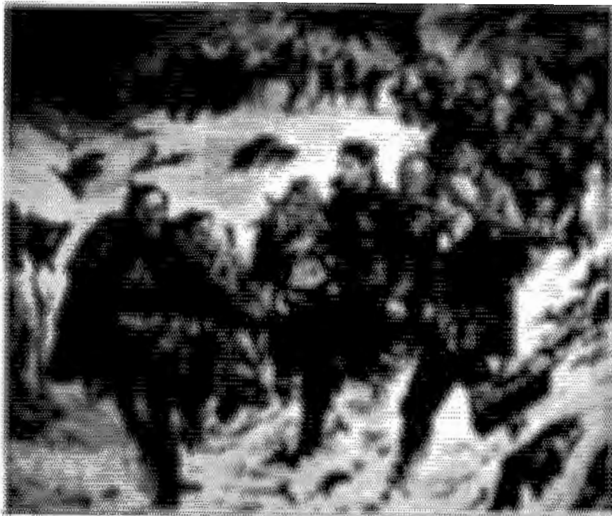
ภาพจิตรกรรมแสดงการเคลื่อนไหวกปฏิวัติของกองทัพประชาชนอัลบานเนีย เพื่อต่อต้านอิตาลีในสงครามโลกครั้งที่สอง

หลังจากนี้พรรคคอมมิวนิสต์อัลบานเนีย ได้แสดงบทบาทแข็งขัน