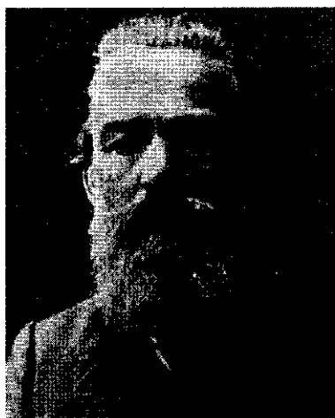
คิมิทู บลาโกเยฟ

เมื่อเดือนมิถุนายน ค.ศ. ๑๙๔๒ ขณะที่บัลแกเรียเข้าร่วม