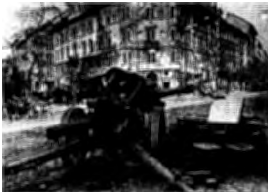
กรุงบูดาเปสต์ ค.ศ.๑๙๔๕ ซึ่งเสียหายยับเยินจากสงคราม

ต่อมาเดือนกุมภาพันธ์ค.ศ.๑๙๔๗ เกิดความขัดแย้งในแนวร่วมกองกำลังพรรคคอมมิวนิสต์สังคมนิยมของเบลกา โควาชส์ (Béla Kovács, ๑๙๐๘-๑๙๕๙) เลขาธิการพรรคผู้ผลิตน้อยในข้อหา 'ต่อต้านสาธารณรัฐ' และเตรียมแผนโค่นล้มรัฐบาลด้วยอาวุธ จากนั้นก็มีการจับกุมผู้นำพรรคผู้ผลิตน้อยอีกหลายคน สมาชิกที่เหลือได้ย้ายมาสังกัดพรรคคอมมิวนิสต์ ทำให้รัฐบาลต้องลาออกมีการยุบสภา และเลือกตั้งใหม่วันที่ ๓๑ สิงหาคม ค.ศ.๑๙๔๗ พรรคคอมมิวนิสต์ได้เสียงเพียง ๒๖% แต่ยังได้เสียงมากที่สุด พรรคสังคมนิยมประชาธิปไตยได้คะแนนเสียง ๑๕% พรรคผู้ผลิตน้อยก็ได้คะแนนเสียง ๑๕% เช่นกัน ดังนั้น พรรคคอมมิวนิสต์จึงตั้งรัฐบาลร่วมกับพรรคสังคมนิยมประชาธิปไตย เริ่มมีการจับกุมและยุบพรรคฝ่ายอื่นทั้งหมด และพรรคสังคมนิยมประชาธิปไตยกับพรรคคอมมิวนิสต์ยุบรวมกันในเดือนมิถุนายน ค.ศ.๑๙๔๘ เรียกชื่อใหม่ว่า 'พรรคประชาชน ผู้ใช้แรงงานฮังการี' (Magyar Dolgozók Pártja-MDP.) และได้คุมอำนาจเด็ดขาด มีการจับกุมกวาดล้าง 'ศัตรูของสังคมนิยม' จำนวนนับแสนคน โดยนำ