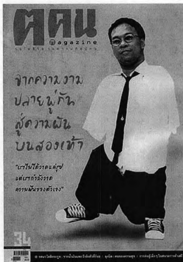
ภาพที่ 12 ภาพจาก ปกนิตยสาร ค.คน ประจำเดือนสิงหาคม ๒๕๕๑

"... ผมอยากให้วัดผมจากความสามารถมากกว่า มันดูมีคุณค่ามากกว่ากันเยอะ ..."