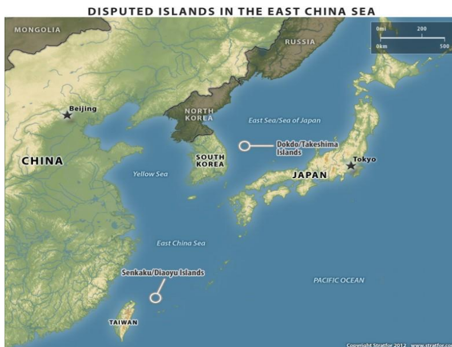
รูปภาพที่ 3 แสดงพื้นที่พิพาทบริเวณทะเลจีนตะวันออก 73