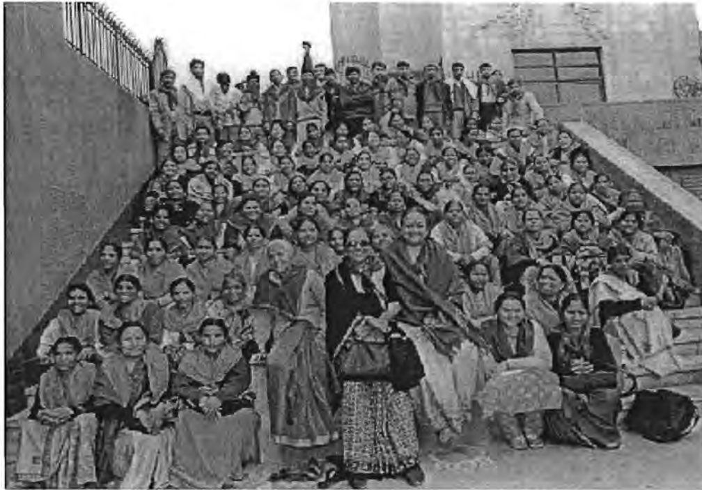
ภาพที่ 3.1 รูปเจ้าหน้าที่ที่เข้าร่วมดำเนินกิจกรรมขบวนการผู้หญิงสะบลาสังข์