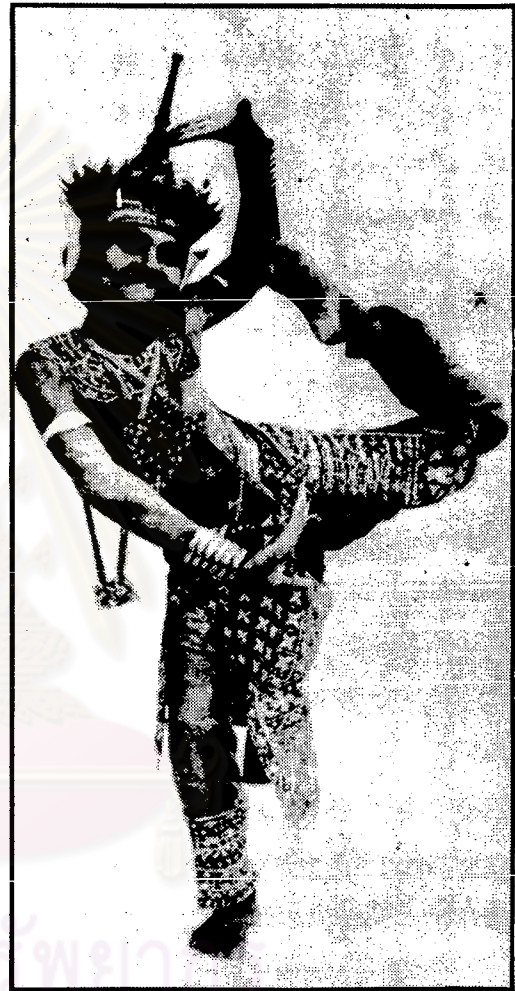
ท่ากินนร