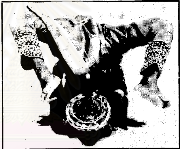
ท่าแมลงมูนชักโย