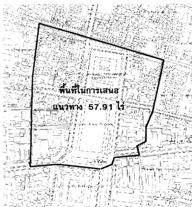
แผนผังที่ 1-02 แสดงขอบเขตพื้นที่ในการเสนอแนวทาง