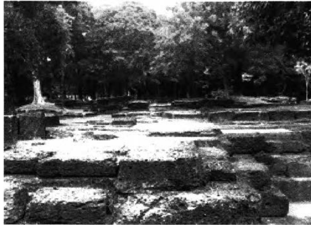
ภาพที่ 7.4 ปราสาท และ บริเวณฐานของ องค์ปราสาทประธานเดิม