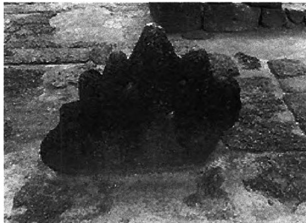
ภาพที่ 7.5 ศิลาแลง (สันนิษฐานว่าเคยเป็น เศียร พญานาค มาก่อน)