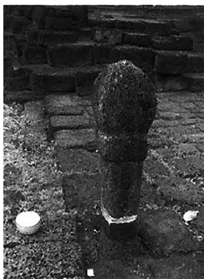
ภาพที่ 7.6 เสานางเรียง ที่ยังคงหลงเหลือ