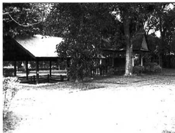
ภาพที่ 7.15 การสร้างสิ่งก่อสร้างบริเวณโบราณสถาน