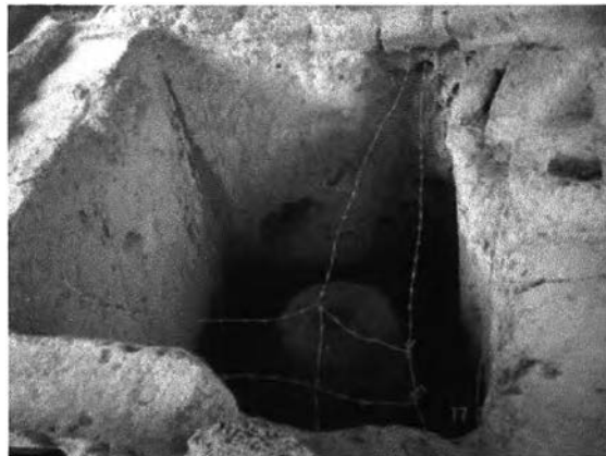
ภาพที่ 7.14 สภาพโบราณสถานที่หลงเหลือในเขตบ้านดงละคร