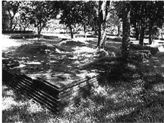
ภาพที่ 7.13 สภาพกำแพงเมืองในปัจจุบัน