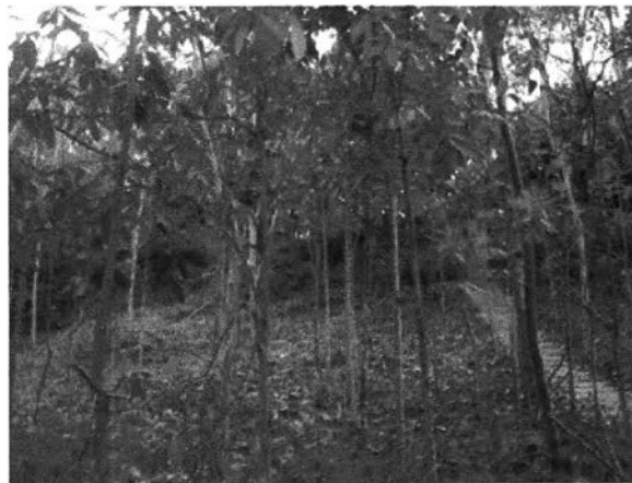
ภาพที่ 7.11 สภาพคันดินที่ใช้เป็นกำแพงเมืองในอดีตของบ้านดงละคร