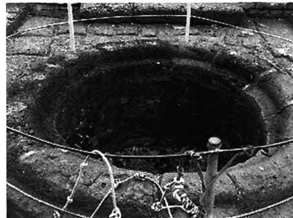
ภาพที่ 7.2 สระน้ำศักดิ์สิทธิ์ ที่อยู่ในอาณาเขต โบราณสถานสร้:มร้กต