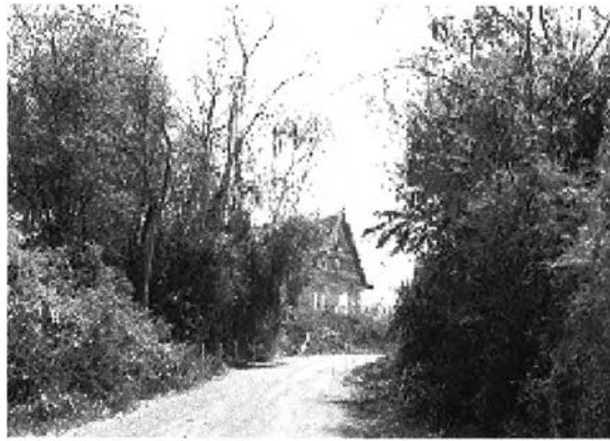
ภาพที่ 7.7 โคกพนมดีในปัจจุบัน