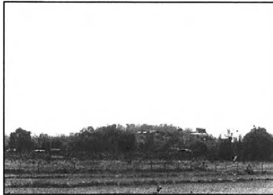
ภาพที่ 7.8 การใช้ประโยชน์จากที่ดินบริเวณโบราณสถานโคกพนมดี