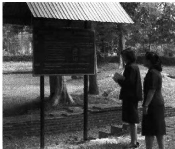
ภาพที่ 7.9 บ้านดงละครในปัจจุบัน