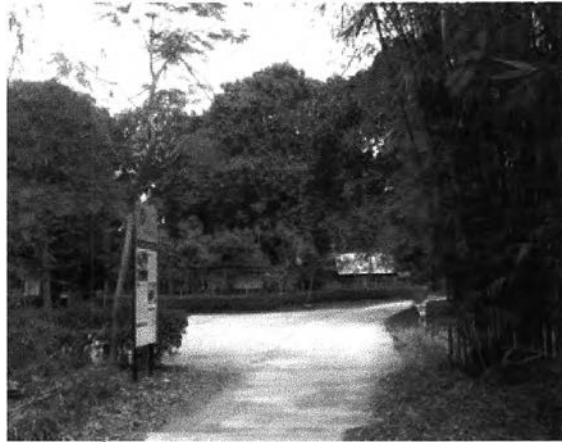
ภาพที่ 7.10 ทางคมนาคมในบ้านดงละครปัจจุบัน