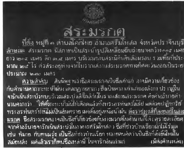
ภาพที่ 7.1 โบราณสถานสร้:มร้กต