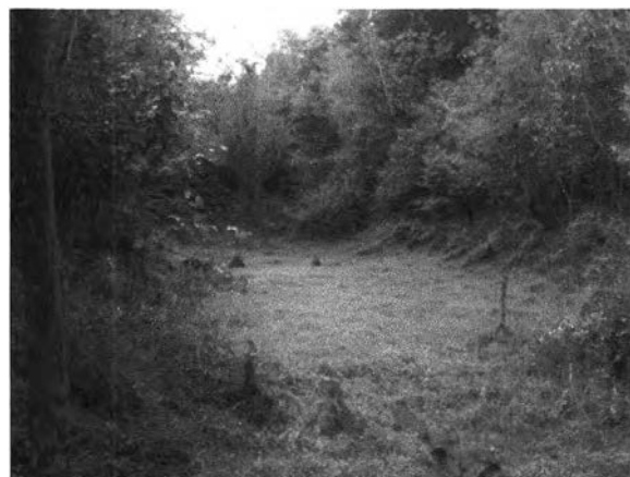
ภาพที่ 7.12 สภาพคูน้ำในปัจจุบัน