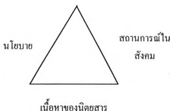
แผนภาพที่ 9 แสดงความสัมพันธ์ระหว่างปัจจัยที่มีผลต่อการกำหนดเนื้อหาของนิตยสาร

นิตยสารเป็นหน่วยหนึ่งของสังคมที่ดำรงอยู่ ดังนั้น ภาพสะท้อนจากนิตยสารย่อมมีความเกี่ยวข้องกับความเป็นไปในสังคมด้วย ทั้งนี้อาจพิจารณาได้ว่า ปัจจัยที่มีความสำคัญต่อการกำหนดเนื้อหาของนิตยสารมีอย่างน้อย 2 ปัจจัย ได้แก่ ประการแรกคือสถานการณ์ในสังคม ประการสำคัญต่อมาคือนโยบายของนิตยสาร ซึ่งสามารถแสดงเป็นแผนภาพได้ดังนี้