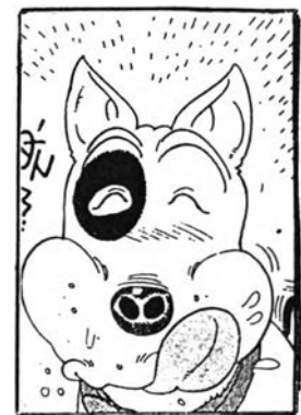
บ๊อค จากเรื่อง บ๊อค บ๊อค