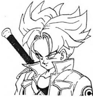
ทรวงซ์ จากเรื่อง ดราก้อนบอล