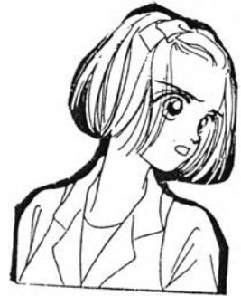
ไซโนโกะ จากเรื่อง ไอ้ มาย ดาร์ลิ่ง