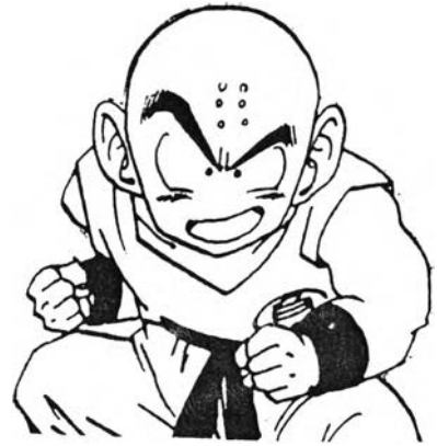
คุริลิน จากเรื่อง ดรากอ้อนบอล