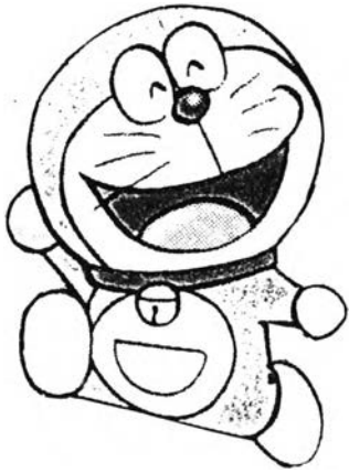
โดราเอมอน จากเรื่องโดราเอมอน