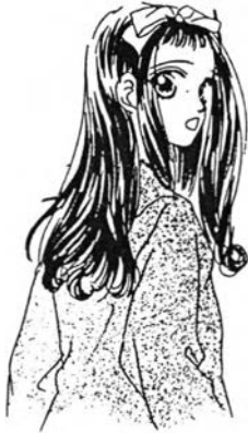
โมรินงะ ฮิคารุ ในเรื่อง ไอ้ มาย ดาร์ลิ่ง