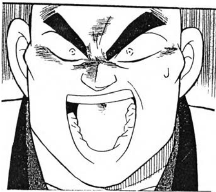
เพื่อนของโคโงโร่ ชื่อ นากามิจิ จากเรื่อง ยอดนักสืบจิ๋ว โคนัน