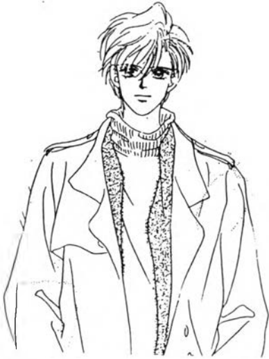
อาเคจิ ซินเปออิ จากเรื่อง ไอ้ มาย ดาร์ลิ่ง