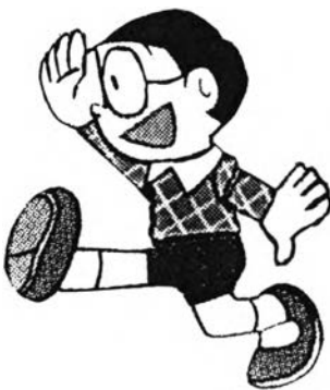
โนบิตะ จากเรื่อง โดราเอมอน