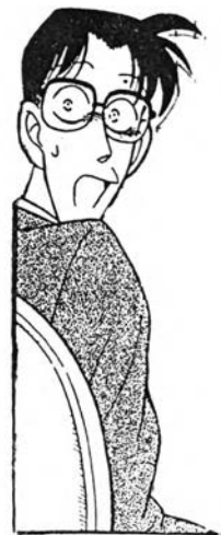
อิชิเอตะ จากเรื่อง ยอดนักสืบจิ๋ว โคนัน