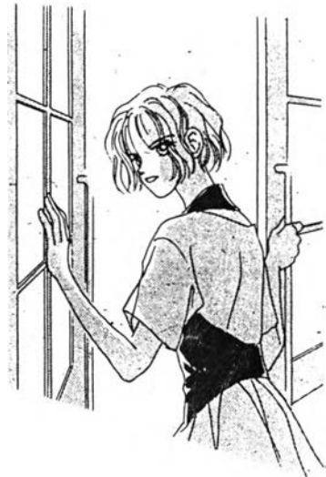
โอกิโนะ จากเรื่อง ไอ้ มาย ดาร์ลิ่ง