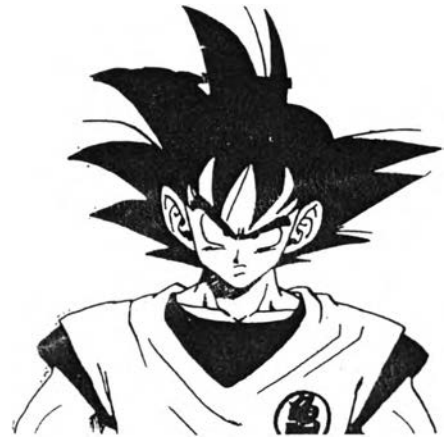
ซุน โงคู จากเรื่อง ดรากอนบอล