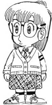
โนริมากิ อาราเล่ ในเรื่อง ดร.สลับปี