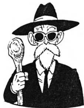
ผู้เฒ่าเต่า จากเรื่อง ดรากอ้อนบอล