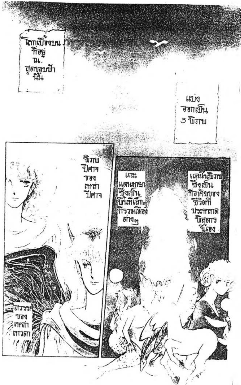
ภาพที่ 1 : ภาพแสดงการเปิดเรื่องด้วยการบรรยายในการ์ตูนญี่ปุ่น จากเรื่อง ล่านาต่างพิภพ เล่มที่ 1 หน้า 3