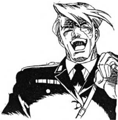
ผู้พัน วิสคอนดี้ จากเรื่อง กัปตันคิด