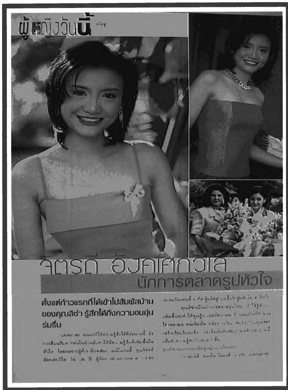
ภาพผู้หญิงเก่งในนิตยสารผู้หญิงวันนี้