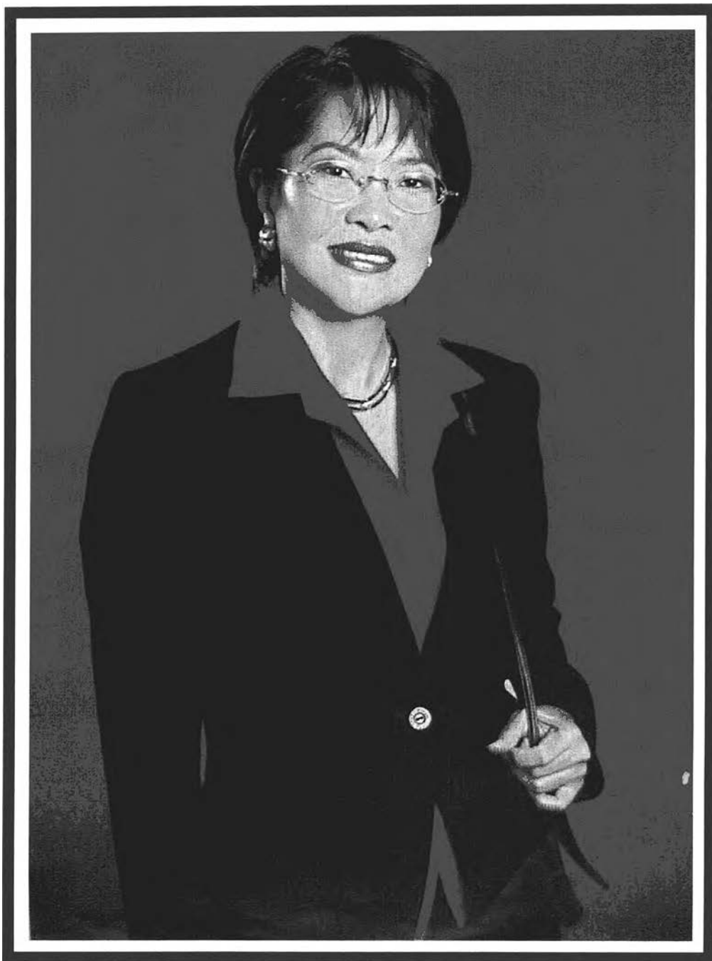
ภาพผู้หญิงเก่งในนิตยสารผู้หญิง 24