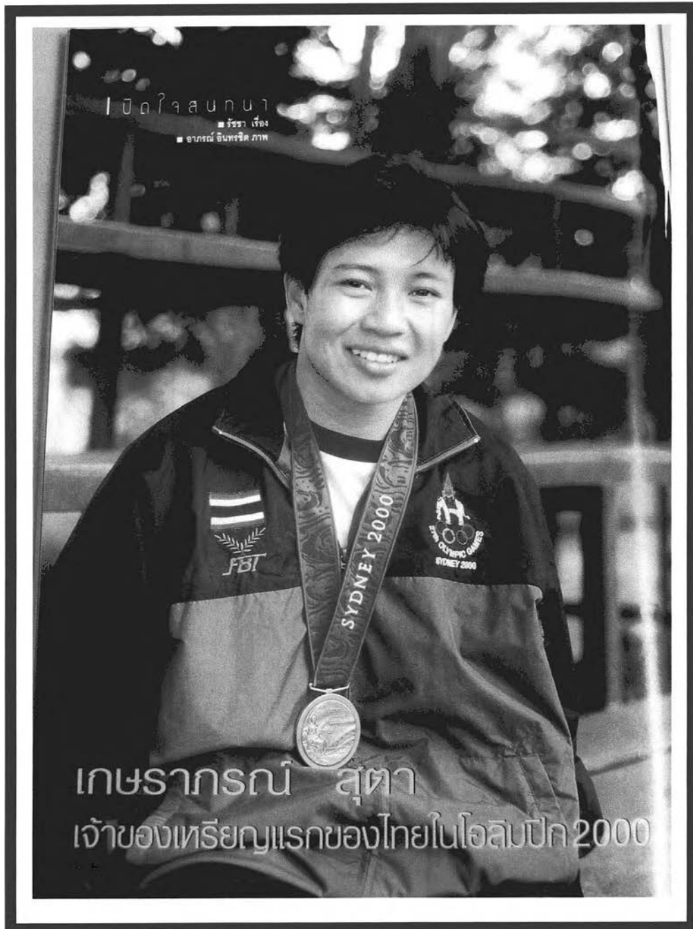
ภาพผู้หญิงเก่งในนิตยสารขวัญเรือน