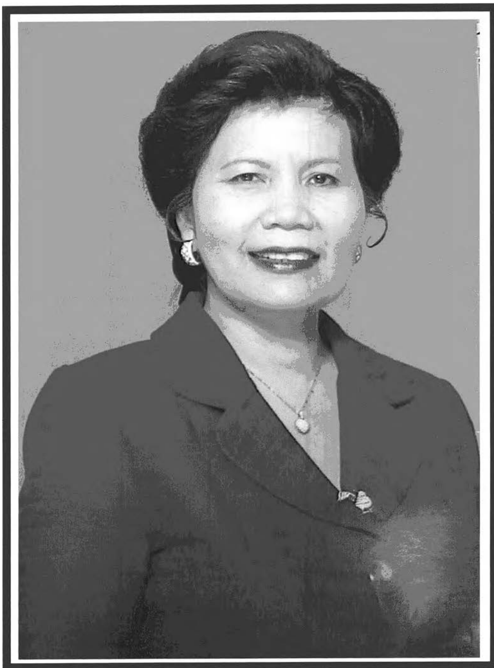
ภาพผู้หญิงเก่งในนิตยสารดิฉัน