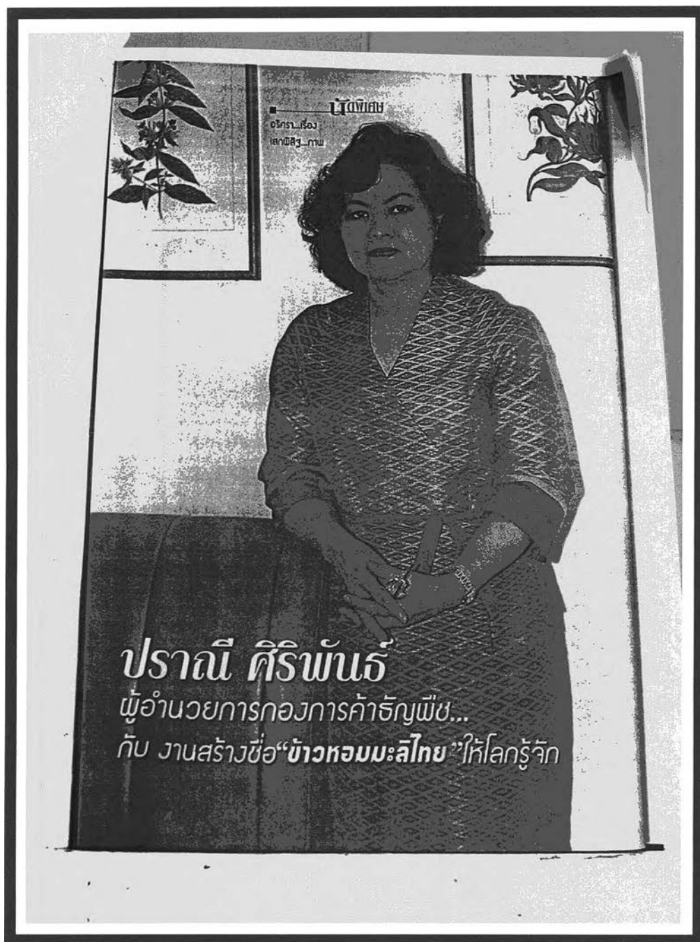
ภาพผู้หญิงเก่งในนิตยสารหญิงไทย