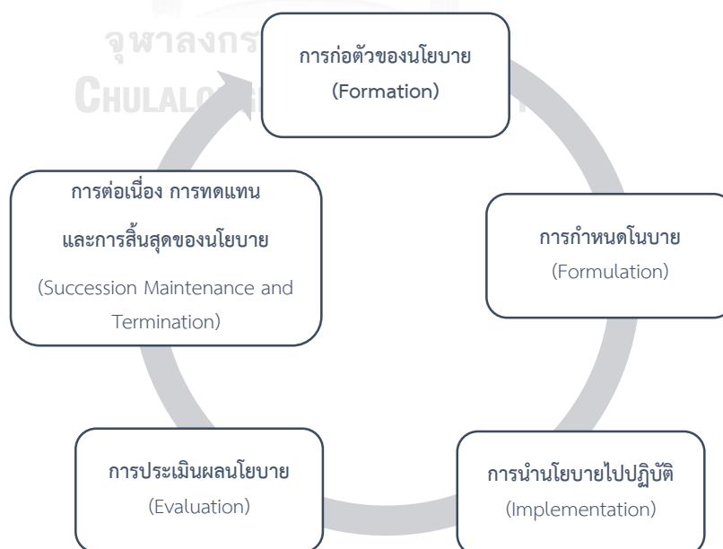
ภาพที่ 2 วัชรพล มาลัยวงศ์ของนโยบายสาธารณะ

วัชรพล มาลัยวงศ์ (2561) ได้สรุปกระบวนการนโยบายสาธารณะไว้ดังนี้