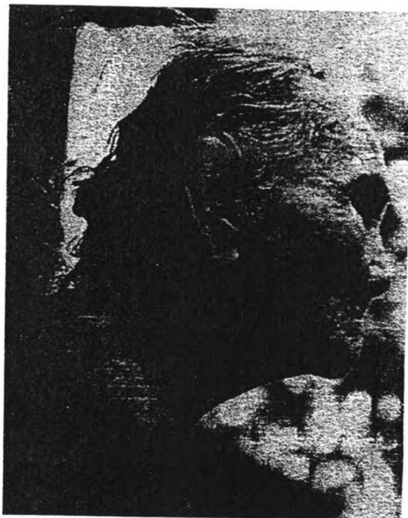
ภาพที่ 2 พราหมณ์เมืองไชยา

(ภาพโดยปรีชา นุ่นสุข, สารานุกรมภาคใต้ หน้า 3425)