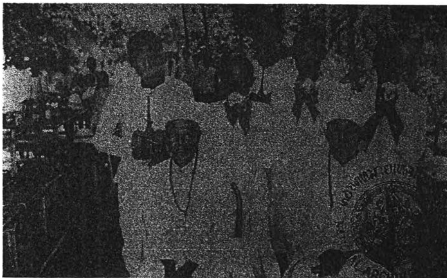
ภาพที่ 3 พราหมณ์ในภาคใต้ ครั้งรัชกาลที่ 6 เสด็จเยือนปักษ์ใต้เมื่อ พ.ศ. 2448