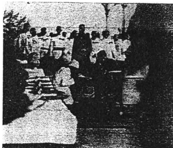
ภาพที่ 4 พราหมณ์เมืองพัทลุง ถวายน้ำสังข์แด่รัชกาลที่ 7 ที่สถานีรถไฟพัทลุง ครั้งเสด็จเยือนจังหวัดพัทลุงเมื่อ พ.ศ. 2472