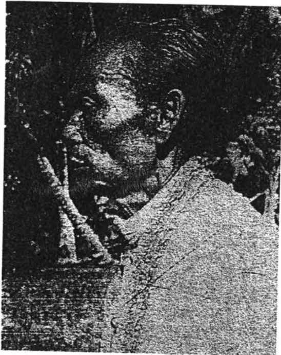
ภาพที่ 1 พราหมณ์เมืองนครศรีธรรมราช