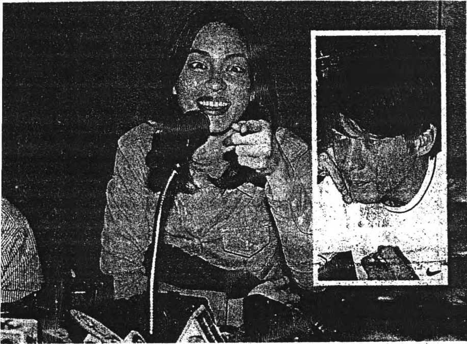
▲ เลิกแล้วค่ะ นางธณัฐภา หรือ พิม วัฒนพานิช หรือ มาซ่า นักร้องชื่อดัง แดงขำเปิดใจพ่ายขาดกับนายอำพล ลำพูน (ภาพเล็ก) ว่า เกิดจากความไม่เข้าใจกัน ไม่ใช่เรื่องของมือที่สาม และยืนยันจะไม่หวนกลับมาไม่ร่วมชีวิตคู่อีก

อ่านข่าว "มาซ่าเปิดใจเลิกราอำพล" แล้วตอบข้อ 1-5 โดยเลือกตอบเพียงข้อเดียว