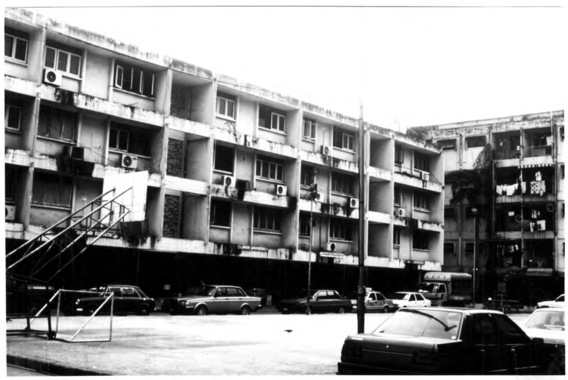
ภาพที่ 1.15 แสดงอาคารที่พักอาศัยสำหรับเจ้าหน้าที่ตำรวจแบบแฟลต