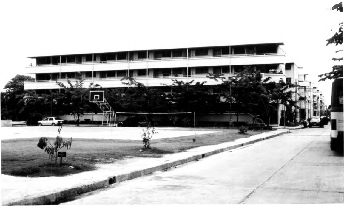
ภาพที่ 1.13 แสดงบริเวณที่พักอาศัยสำหรับเจ้าหน้าที่ตำรวจแบบแฟลต