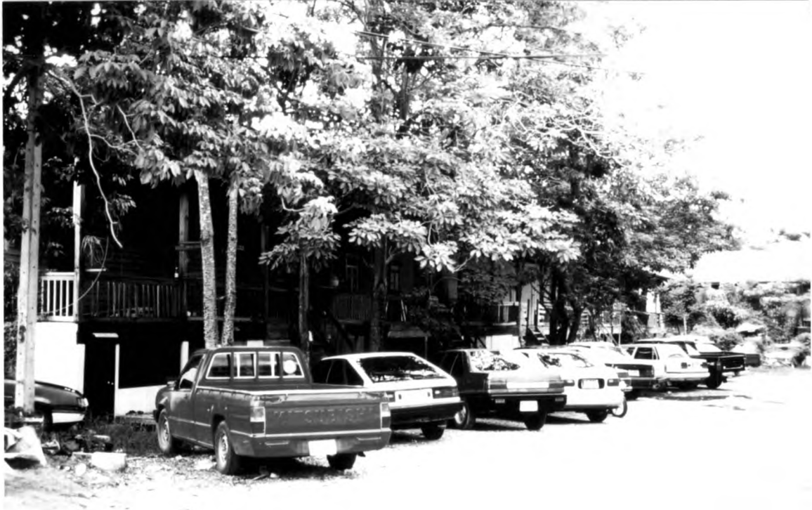
ภาพที่ 1.4 แสดงอาคารที่พักอาศัยสำหรับเจ้าหน้าที่ตำรวจแบบเรือนแถวไม้