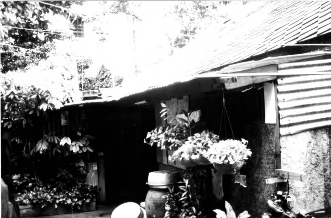
ภาพที่ 1.6 แสดงอาคารที่พักอาศัยสำหรับเจ้าหน้าที่ตำรวจแบบเรือนไม้