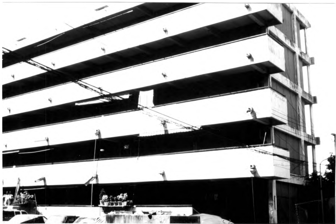
ภาพที่ 1.14 แสดงอาคารที่พักอาศัยสำหรับเจ้าหน้าที่ตำรวจแบบแฟลต