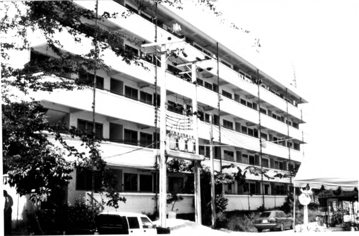
ภาพที่ 1.11 แสดงอาคารที่พักอาศัยสำหรับเจ้าหน้าที่ตำรวจแบบแฟลต