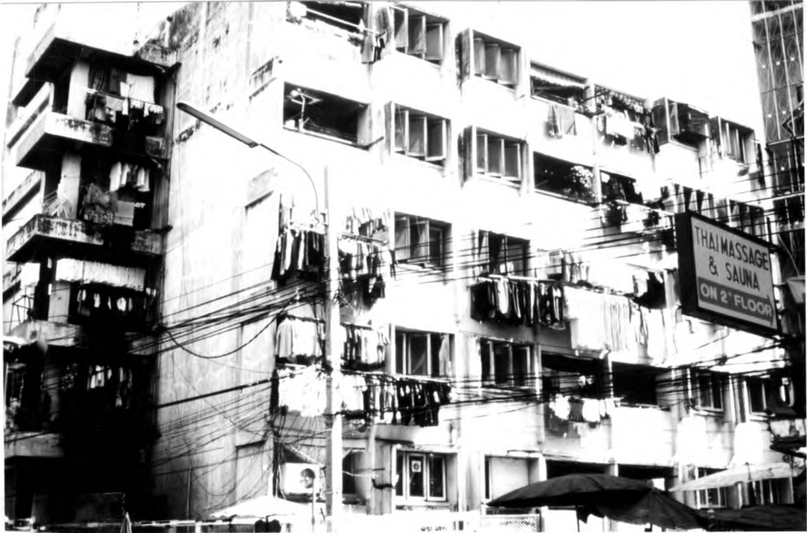
ภาพที่ 1.7 แสดงบริเวณด้านหลังของที่พักอาศัยสำหรับเจ้าหน้าที่ตำรวจแก๊งแฟลต