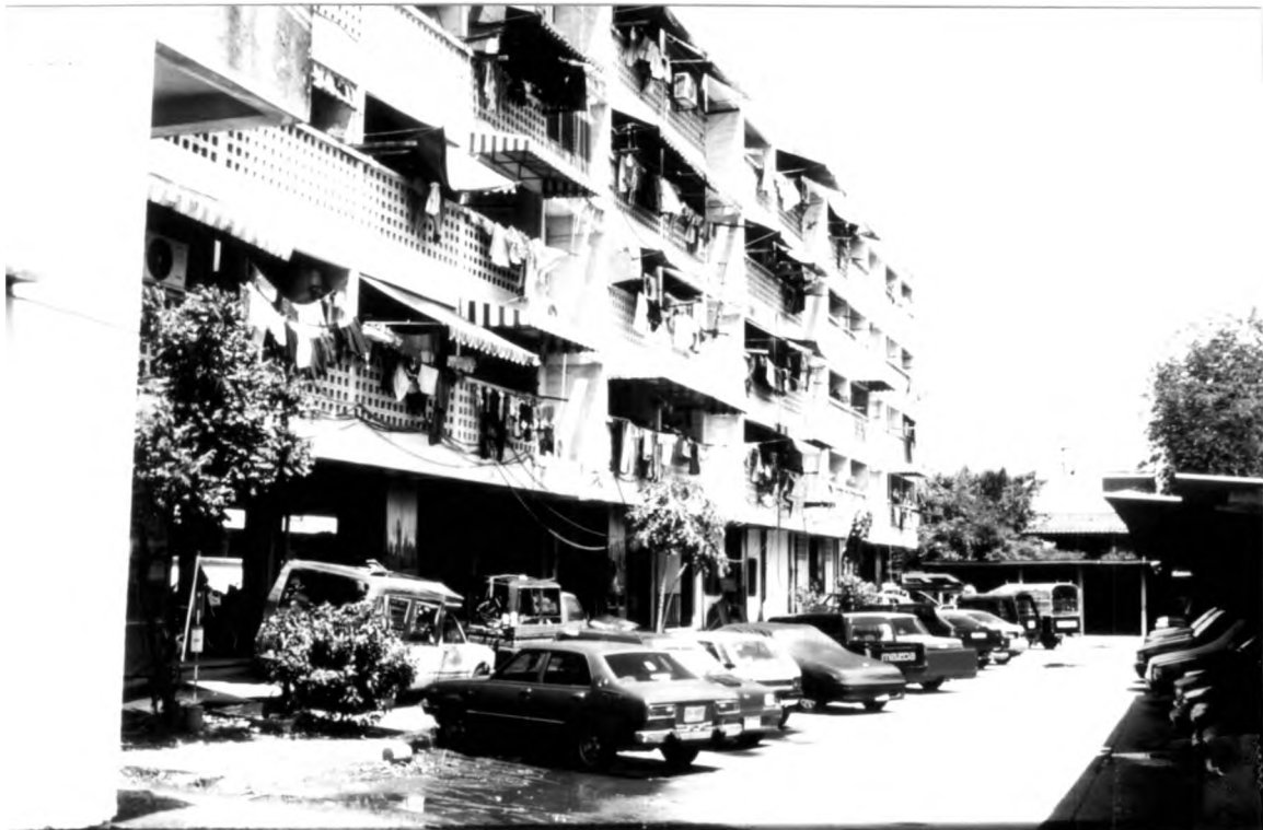
ภาพที่ 1.8 แสดงบริเวณด้านหลังของที่พักอาศัยสำหรับเจ้าหน้าที่ตำรวจแบบแฟลต