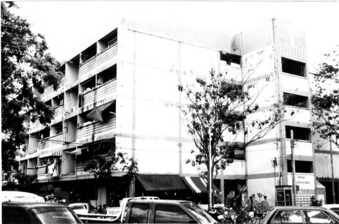
ภาพที่ 1.5 แสดงอาคารที่พักอาศัยสำหรับเจ้าหน้าที่ตำรวจแบบแฟลต