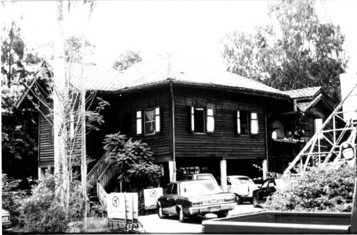
ภาพที่ 1.3 แสดงอาคารที่พักสำหรับเจ้าหน้าที่ตำรวจแบบบ้านไม้