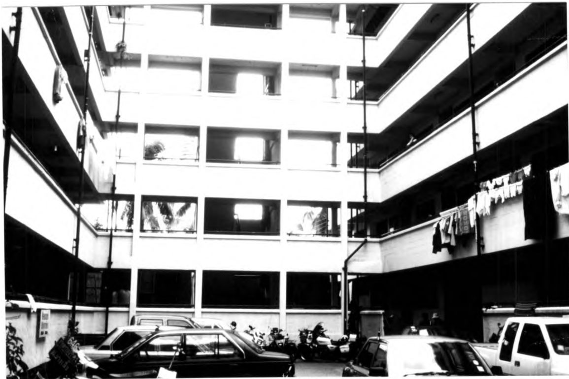
ภาพที่ 1.10 แสดงส่วนที่จอดรถของอาคารที่พักอาศัยสำหรับเจ้าหน้าที่ตำรวจแบบแฟลต