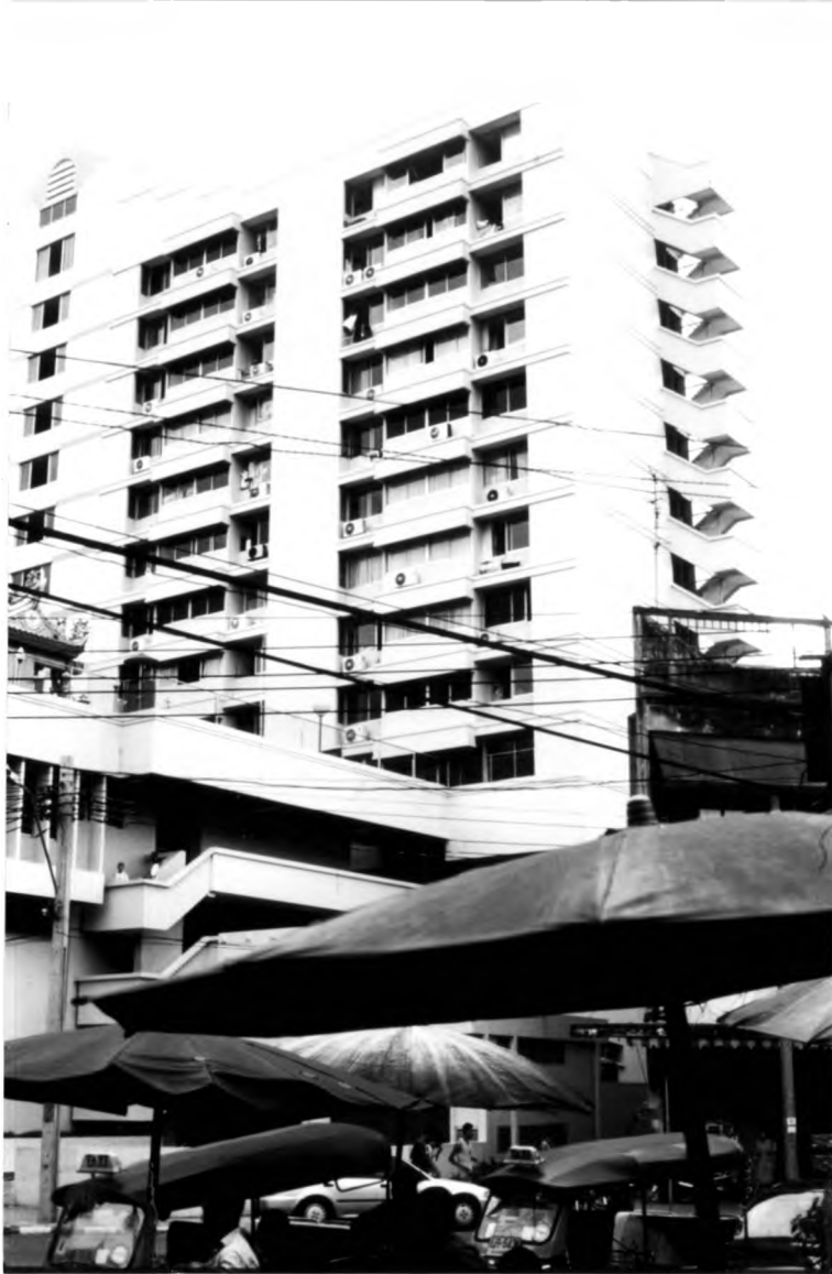
ภาพที่ 1.16 แสดงอาคารที่ทำงานและที่พักอาศัยสำหรับเจ้าหน้าที่ตำรวจแบบแฟลต