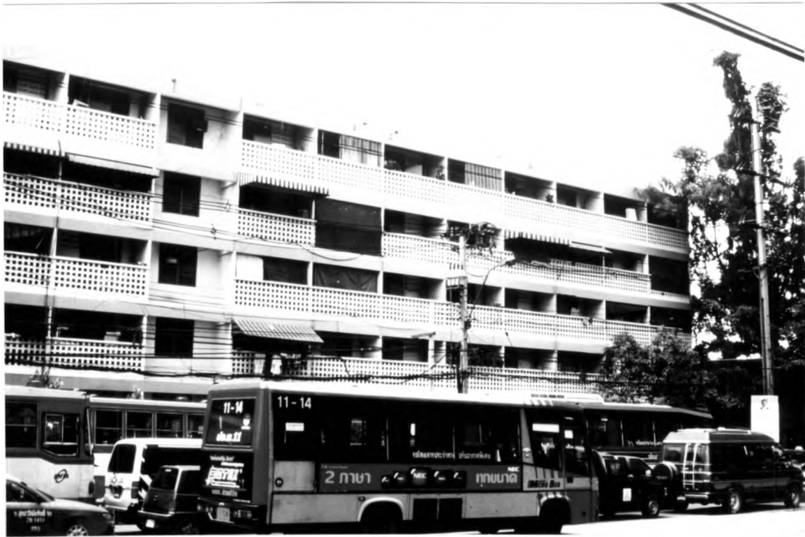
ภาพที่ 1.9 แสดงบริเวณด้านหน้าของอาคารที่พักอาศัยสำหรับเจ้าหน้าที่ตำรวจแบบแฟลต