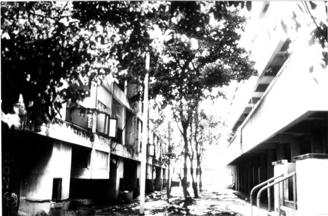
ภาพที่ 1.12 แสดงสวนหย่อมภายในที่พักอาศัยสำหรับเจ้าหน้าที่ตำรวจแบบแฟลต