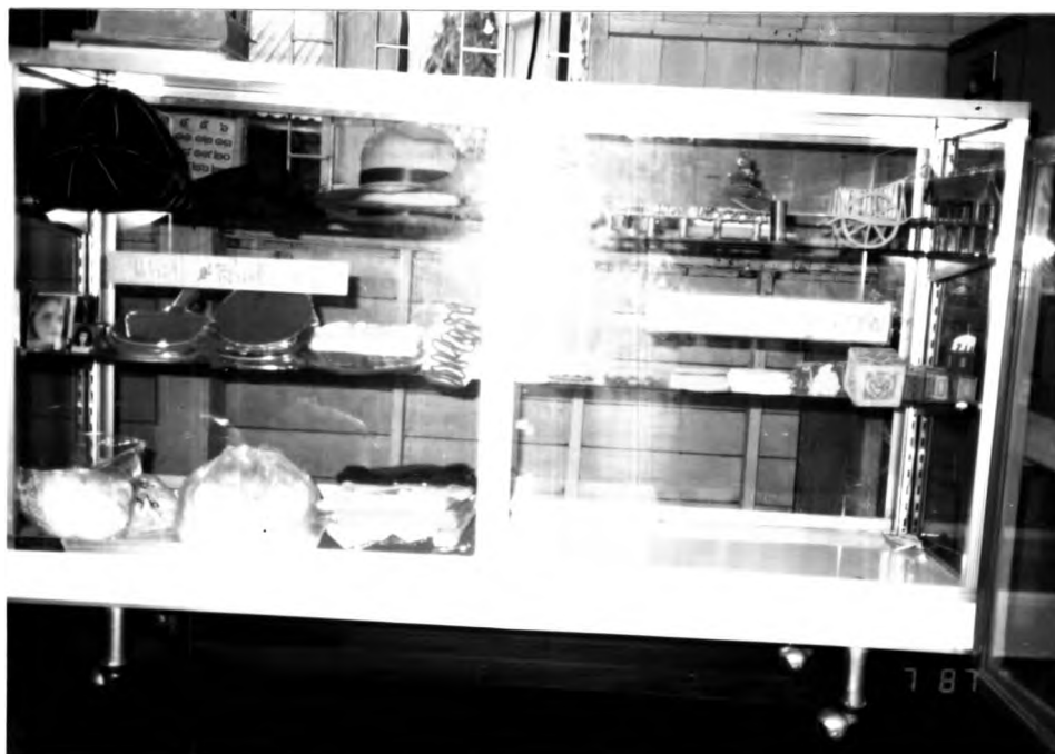
การจัดสินค้าในร้าน