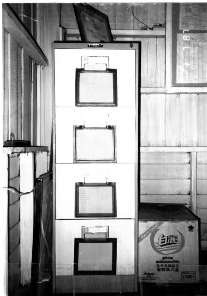
การเก็บหลักฐานสำคัญ