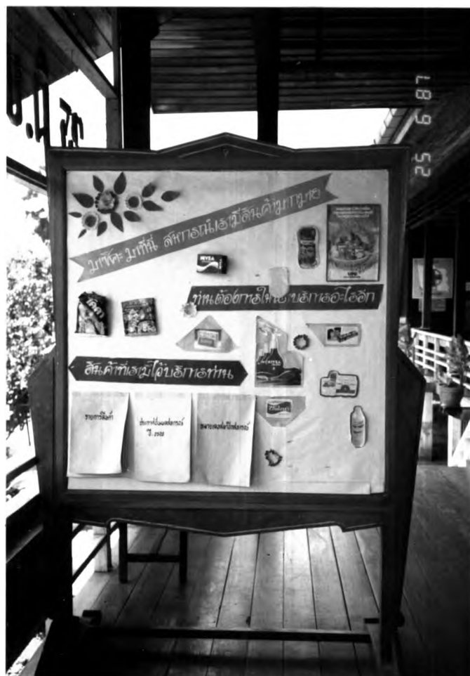
การประชาสัมพันธ์