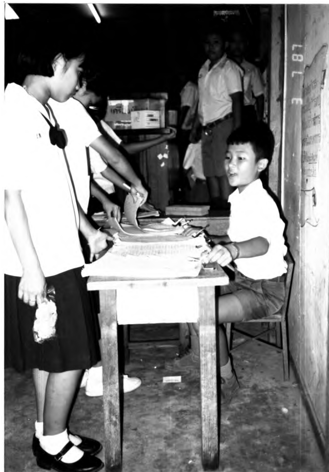
การมีส่วนร่วมของสมาชิก