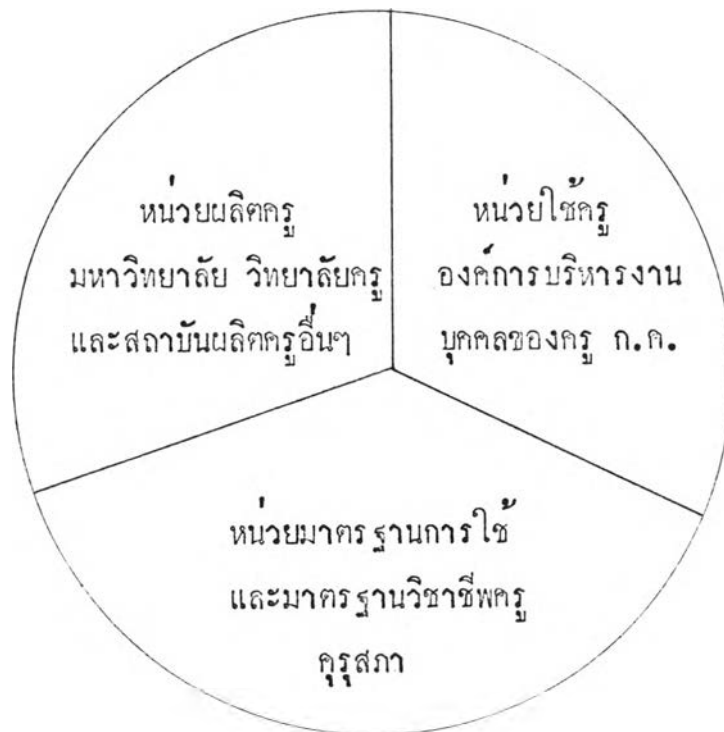
แผนภูมิที่ 1 แสดงโครงสร้างของระบบอาชีพครู

การกำหนดให้คຸຣຸສຸກາ มีบทบาทสำคัญในฐานะที่เป็นหน่วยมาตรฐานการใช้และมาตรฐานวิชาชีพครู โดยประสานงานร่วมกับฝ่ายงานที่เกี่ยวข้องกับอาชีพครูอีกสองหน่วยคือ หน่วยผลิตครู กับหน่วยใช้หรือบริหารงานบุคคลสำหรับครู ซึ่งอาจเขียนเป็นแผนภูมิให้เห็นได้ดังนี้