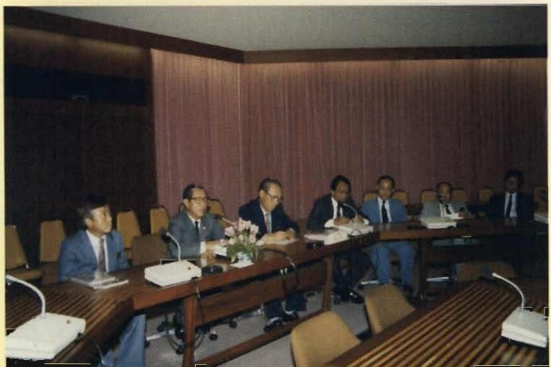
ประชุมผู้บริหารมหาวิทยาลัย