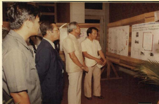
ฯพณฯ พลเอกเปรม ติณสูลานนท์ เปิดนิทรรศการการวิจัย เพื่อพัฒนาชนบท