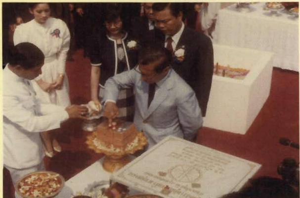
วางศิลาฤกษ์อาคารมาบุญครอง