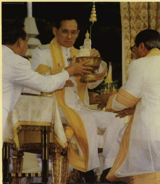
จุฬาลงกรณ์มหาวิทยาลัยทูลเกล้าฯ ถวายพระพุทธรูป ปฏิมาแก้วผลึกแด่พระบาทสมเด็จพระเจ้าอยู่หัวเนื่องใน มงคลวโรกาสที่พระบาทสมเด็จพระเจ้าอยู่หัว ทรงครองสิริ ราชสมบัติ เป็นปีที่ ๕๐