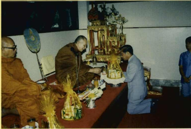
ถวายผ้าป่าสร้างตึก ภปร.