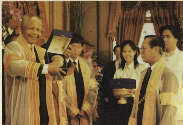
พิธีประสาทปริญญาศิลปศาสตรดุษฎีบัณฑิตกิตติมศักดิ์แก่ ฯพณฯ นายเนลสัน แมนเดลา ประธานาธิบดีสาธารณรัฐแอฟริกาใต้