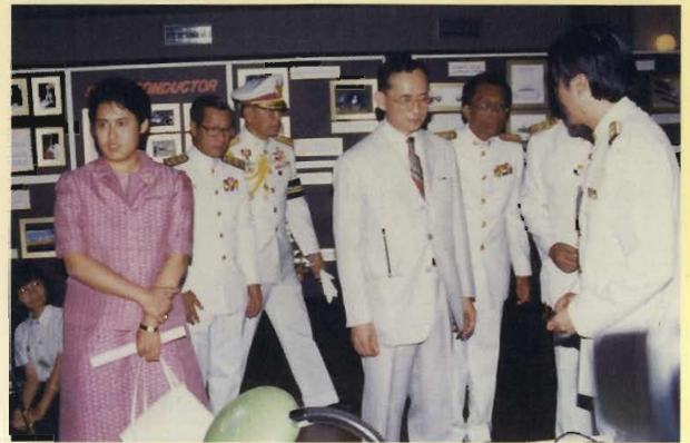
พระบาทสมเด็จพระเจ้าอยู่หัว และสมเด็จพระเทพรัตนราชสุดาฯ สยามบรมราชกุมารี เสด็จพระราชดำเนินทรงเปิดพระบรมราชานุสาวรีย์สมเด็จพระปิยมหาราชและสมเด็จพระมหาธีรราชเจ้า และทรงเปิดงานจุฬาลงกรณ์วิชาการ