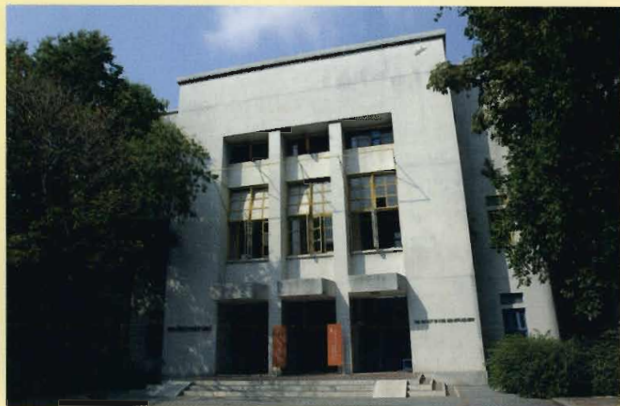
คณะศิลปกรรมศาสตร์