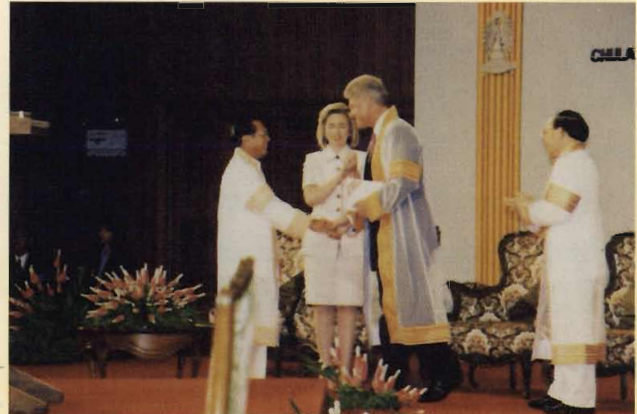
พิธีประสาทปริญญาเศรษฐศาสตรดุษฎีบัณฑิตกิตติมศักดิ์แก่ ฯพณฯ นายบิล คลินตัน ประธานาธิบดีสหรัฐอเมริกา