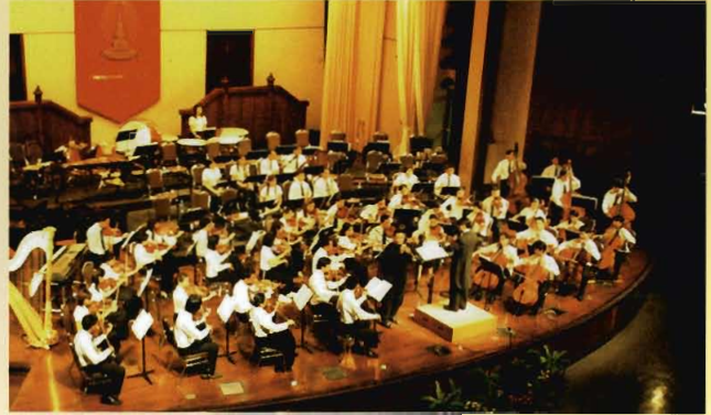
วงซิมโฟนีออร์เคสตรา