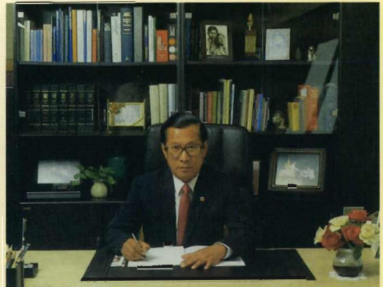
ที่ห้องทำงานอธิการบดีและนายกสภาจุฬาลงกรณ์มหาวิทยาลัย