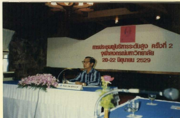
ประชุมผู้บริหารระดับสูง