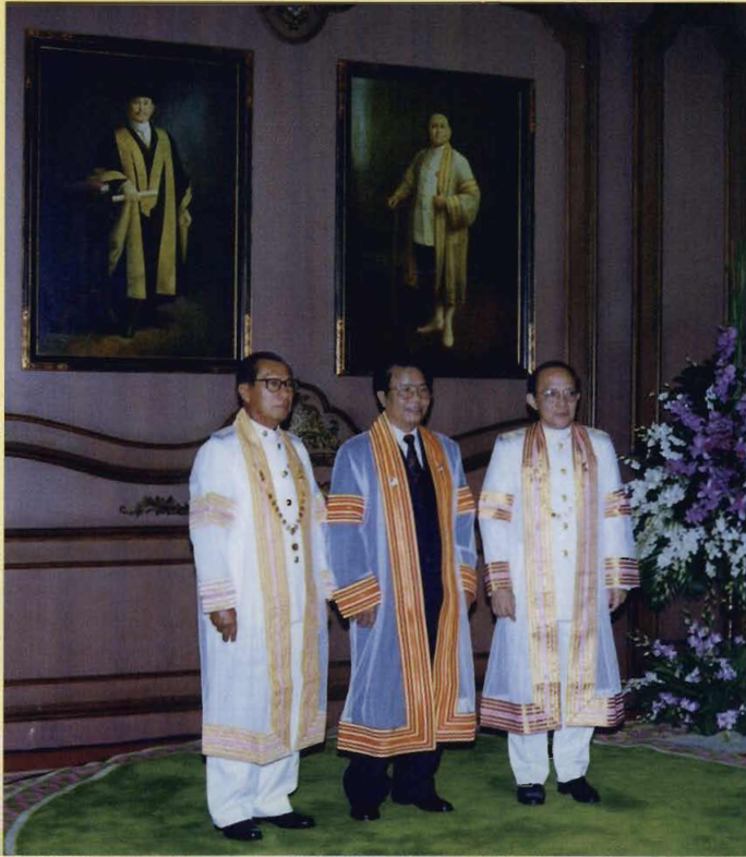
พิธีประสาทปริญญาศิลปศาสตรดุษฎีบัณฑิตกิตติมศักดิ์แก่ ฯพณฯ นายตรัน ด๊ก เลือง ประธานาธิบดีสาธารณรัฐสังคมนิยมเวียดนาม