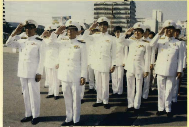
พิธีถวายสักการะพระบาทสมเด็จพระมงกุฎเกล้าเจ้าอยู่หัว