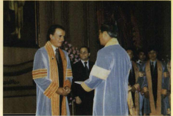
พิธีประสาทปริญญาศิลปศาสตรดุษฎีบัณฑิตกิตติมศักดิ์แก่ ฯพณฯ ดร.การ์โลส ซาอูล เมเนม ประธานาธิบดีสาธารณรัฐอาร์เจนตินา