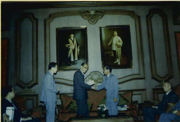
ต้อนรับอธิการบดีมหาวิทยาลัยปักกิ่ง