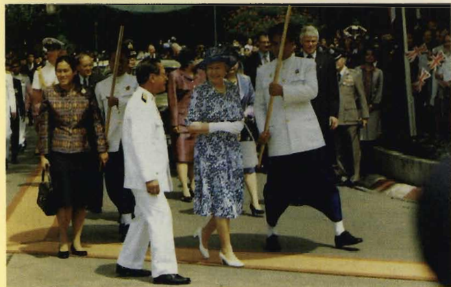
สมเด็จพระราชินีนาถเอลิซาเบธที่ ๒ เสด็จฯ เยือนจุฬาลงกรณ์มหาวิทยาลัย ครั้งที่ ๒