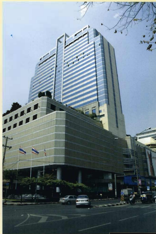
ศูนย์การค้ามานูญครอง