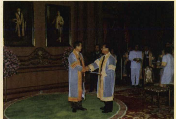
พิธีประสาทปริญญาศิลปศาสตรดุษฎีบัณฑิตกิตติมศักดิ์แก่ ฯพณฯ นายอัลเบร์โต ฟุจิมอริ ประธานาธิบดีสาธารณรัฐเปรู