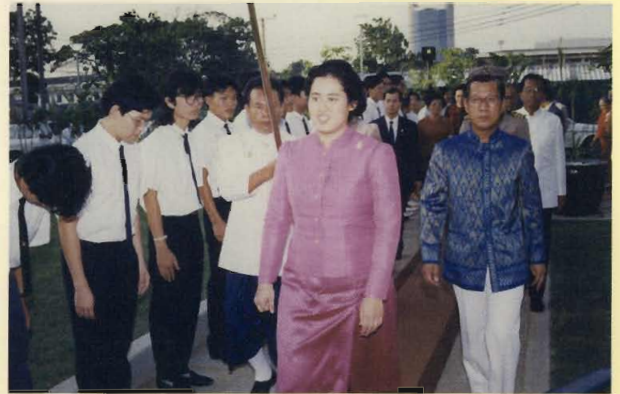
สมเด็จพระเทพรัตนราชสุดาฯ สยามบรมราชกุมารี เสด็จพระราชดำเนินทรงดนตรีไทยปี่พาทย์ดึกดำบรรพ์