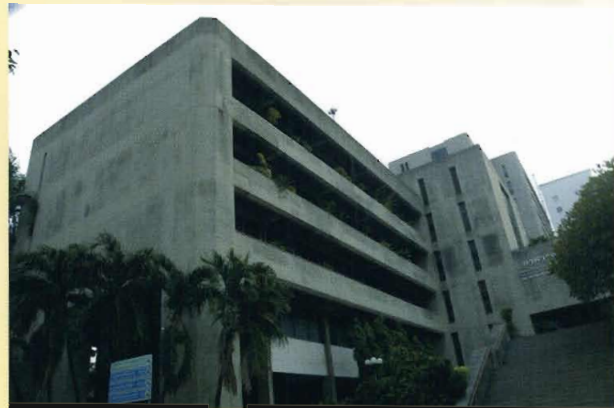
ศูนย์เครื่องมือวิจัยทางวิทยาศาสตร์และเทคโนโลยี