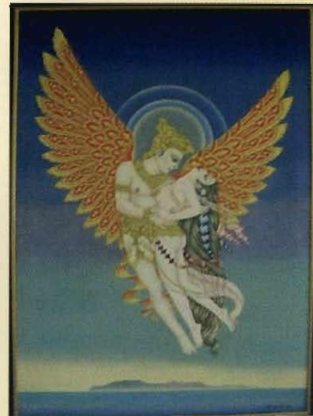
โครงการรวบรวมผลงานศิลปกรรม