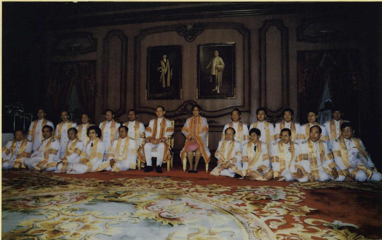
จุฬาลงกรณ์มหาวิทยาลัยทูลเกล้าฯ ถวายปริญญาศิลปกรรมศาสตรดุษฎีบัณฑิตกิตติมศักดิ์แด่ สมเด็จพระเทพรัตนราชสุดาฯ สยามบรมราชกุมารี ในวาระ ๕๐ ปีแห่งการสถาปนามหาวิทยาลัย