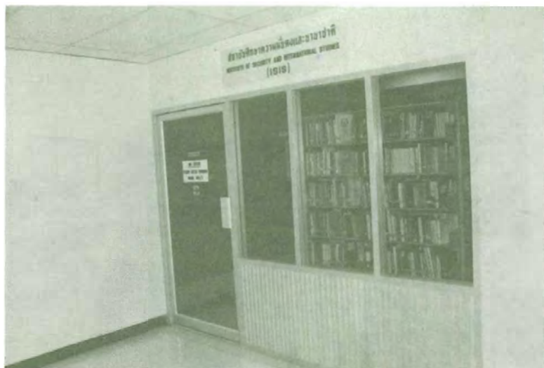
สถาบันศึกษาความมั่นคงและนานาชาติ