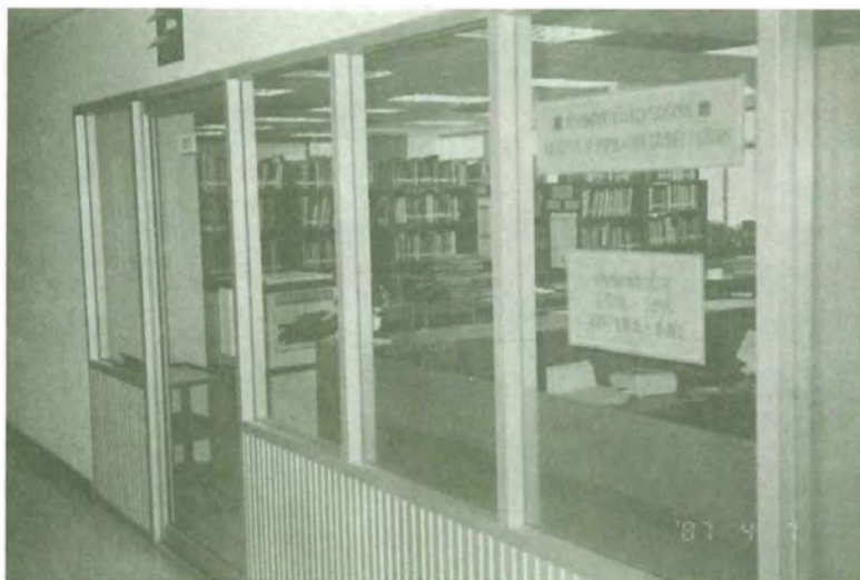
ศูนย์สารสนเทศประชากรศาสตร์