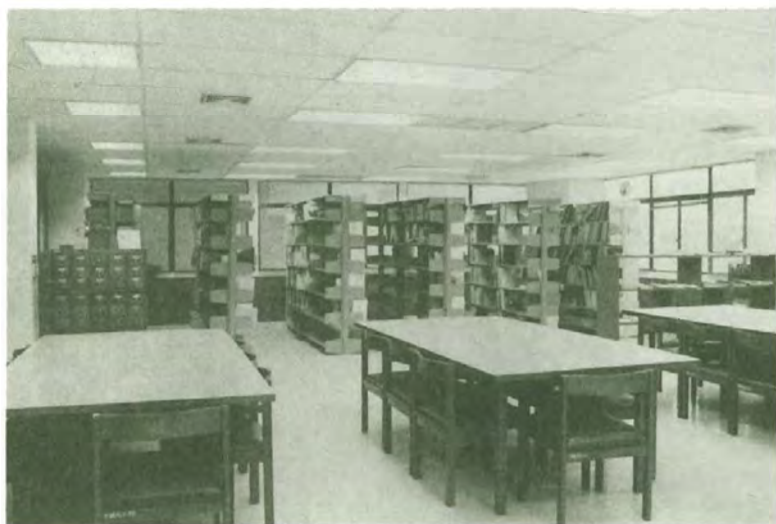
ห้องสมุดสถาบันวิจัยสังคม