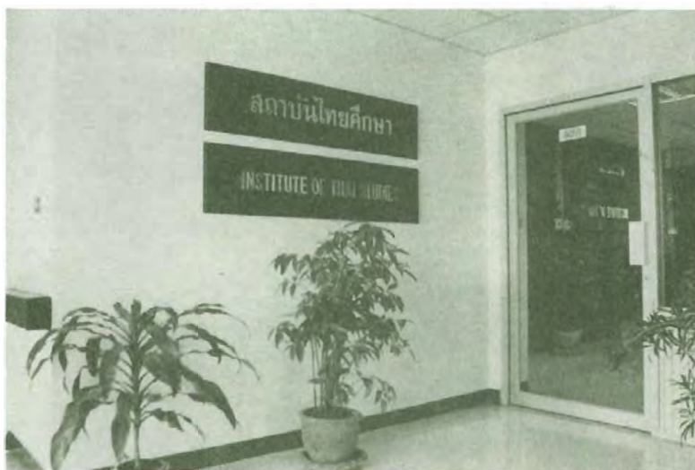
ที่ทำการของสถาบันไทยศึกษา