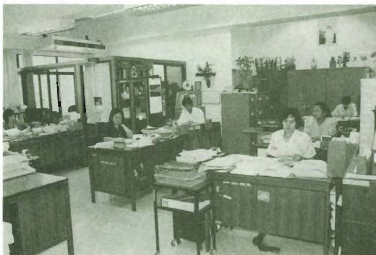
ศูนย์เอกสารเอเชีย