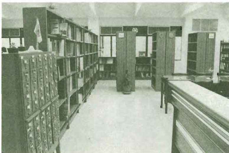
ห้องนิทรรศการพาณิชย์นาวี