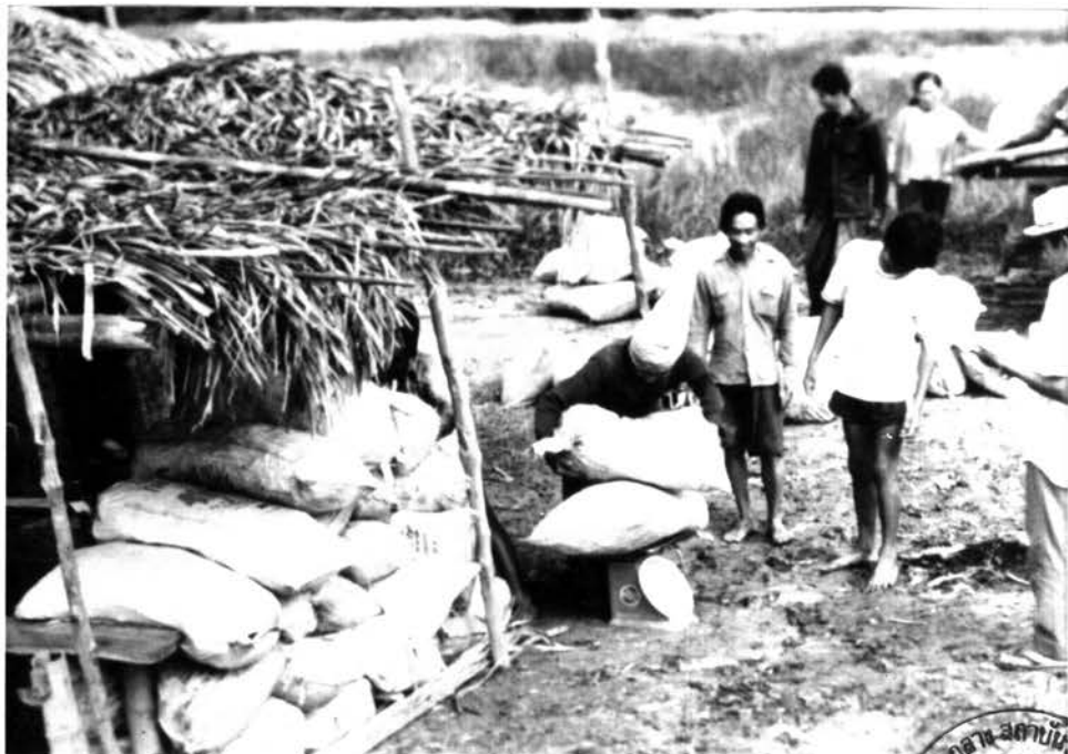
รูป 6.1 การชั่งข้าวโพดฝักอ่อนขณะพ่อค้ามารับซื้อ