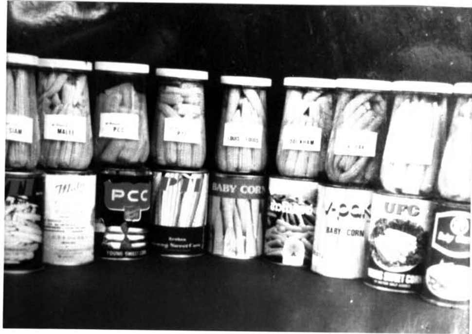
รูป 6.3 ข้าวโพดฝักอ่อนบรรจุกระป๋อง