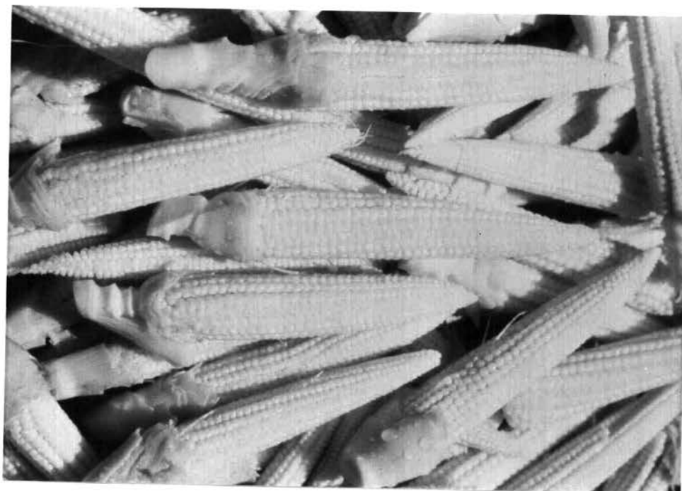
รูป 6.5 ข้าวโพดฝักอ่อนหลังปอกเปลือกแล้ว