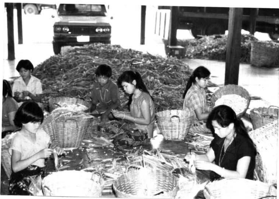
รูป 6.4 คนงานกำลังปอกเปลือกข้าวโพดฝักอ่อน