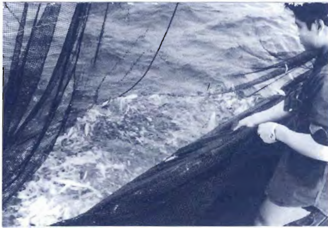
รูปที่ ๕ การจับปลาด้วยเครื่องมืออวนล้อมในอ่าวไทย

เรียกการเพาะเลี้ยงหรือการจับสิ่งเหล่านี้ว่า ทำงานประมง ซึ่งตรงกับภาษาอังกฤษว่า “Fisheries” หมายความว่า เรากำหนดว่าทั้งหมดเป็น “Fish” การไปทำประมงหรือการไปจับปลา ก็หมายความว่าไปจับทรัพยากรอื่น ๆ ด้วย สืบไปแล้วทุกประเทศทุกภาษา ทุกวัฒนธรรมก็เป็นเช่นกัน