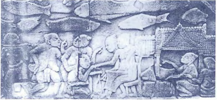
รูปที่ ๘ ภาพสลักเป็นรูปปลาน้ำจืด และวิถีชาวบ้าน บนหินทราย ที่ปราสาทบายน ริมทะเลสาบเขมร ประเทศกัมพูชา

เดียวกัน แต่เป็นระดับแค่เมือง คือ กรุงอัมสเตอร์ดัม ฝรั่งเศสฮอลันดาว่าสร้างขึ้นมาจากก้างปลาแอรัง เมื่อคนพวกนี้เริ่มเข้ามาในเมืองไทยใน พ.ศ. ๒๑๔๙ สมัยสมเด็จพระเอกาทศรถ แล้วก็มาพบแหล่งชาวประมงที่เราเรียกกันว่า พระประแดง ในปากแม่น้ำเจ้าพระยา พระมหากษัตริย์ไทยก็ให้ตั้งหลักตั้งฐานอยู่ที่นั่น ด้วยนิสัยการกินการอยู่ก็เหมือนชาวประมงด้วยกัน ฉะนั้น เมื่อสร้างที่อยู่ที่นี่ได้แล้ว ได้เรียกพระประแดง เป็นชื่อของตัวเองว่า “นิวส์อัมสเตอร์ดัม” เหมือนที่ผ่านมาได้เรียกเกาะสีชังว่า “ดัตช์ไอแลนด์” อาจจะเป็นด้วยนิสัยเหมือนกันอันนี้ตั้งแต่สมัยพระเจ้าปราสาททอง (พ.ศ. ๒๑๓๒-๒๑๙๙) ชาวฮอลันดาในไทยสมัยโน้นจึงได้รับการสนับสนุนเหนือกว่าชาติอื่นใดจากตะวันตก แต่ก็เป็นระยะหนึ่งเท่านั้น