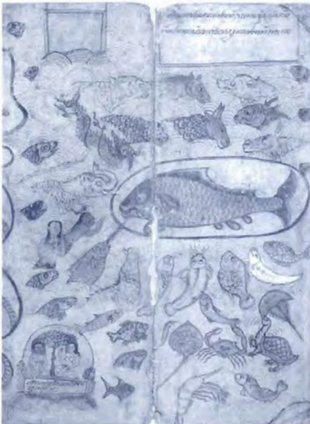
รูปที่ ๒ ภาพหมูปปลาหลายชนิด ตรงกลาง ส่วนล่างของภาพ มีรูปวาดเป็นปลาหน้าคน ซึ่งก็คือปลาระเบน ส่วนภาพปลาในวงล้อม ผู้วาดต้องการให้หมายถึงปลาอนนด์ (จากสมุดภาพไตรภูมิฉบับ เลขที่ ๖)