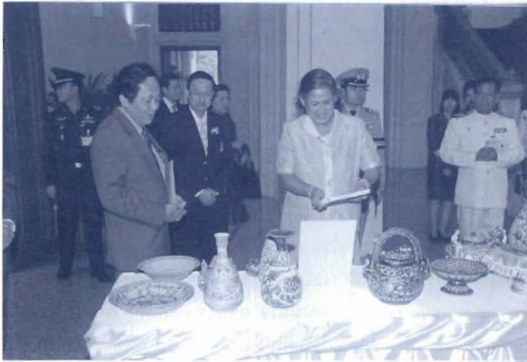
รูปที่ ๓ สมเด็จพระเทพรัตนราชสุดาฯ สยามบรมราชกุมารี ทรงทอดพระเนตรเครื่องเคลือบดินเผาสมัยกรุงสุโขทัย และกรุงศรีอยุธยา ถึงต้นกรุงรัตนโกสินทร์ อายุประมาณ ๖๐๐-๒๐๐ ปี ที่มีภาพปลาปรากฏอยู่ (วันที่ ๑๐ กุมภาพันธ์ พ.ศ. ๒๕๕๒)