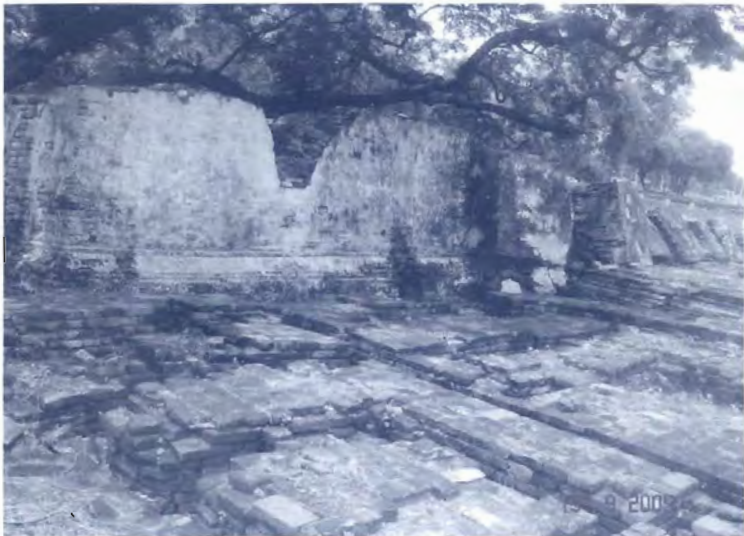
รูปที่ ๔ บริเวณที่มีประวัติเป็นที่เลี้ยงปลาเงินปลาทอง ในเขตพระราชวัง กรุงศรีอยุธยา