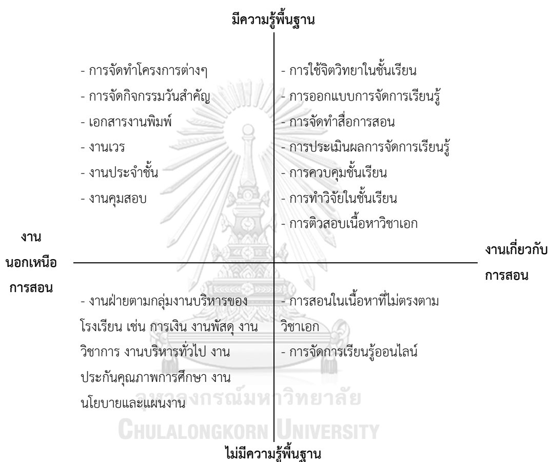
ภาพ 4.2 ภาระงานจำแนกตามมิติด้านความรู้และมิติด้านประเภทของงานของครูบรรจุใหม่

สร้างความสัมพันธ์ จะสามารถจำแนกรูปแบบของภาระงานครูได้เป็น 4 กลุ่ม ได้แก่ 1) งานที่เกี่ยวข้องกับการจัดการเรียนการสอนและมีความรู้พื้นฐานอยู่แล้ว 2) งานที่เกี่ยวข้องกับการจัดการเรียนการสอนและไม่มีความรู้พื้นฐานมาก่อน 3) งานที่ไม่เกี่ยวข้องกับการจัดการเรียนการสอนและมีความรู้พื้นฐานอยู่แล้ว และ 4) งานที่ไม่เกี่ยวข้องกับการจัดการเรียนการสอนและไม่มีความรู้พื้นฐานมาก่อน แสดงดังแผนภาพ 4.2