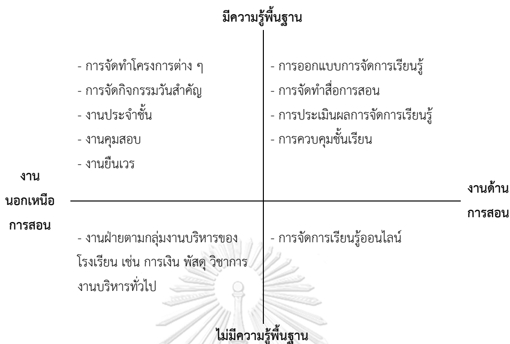
ภาพ 4.1 ภาระงานจำแนกตามมิติด้านความรู้และมิติด้านประเภทของงานของนักศึกษาครู