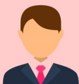
อธิการบดี

ผลการประเมินผลการปฏิบัติงานขององค์กรกำกับดูแล 11 องค์กรในรูปคณะกรรมการ 11 ชุด มีองค์กรที่ได้รับคะแนนระหว่าง 4.13– 4.83 อยู่ในระดับ “ดีมาก” ถึง “ดีเยี่ยม” จำนวน 10 องค์กร และองค์กรที่ได้รับคะแนนระหว่าง 3.50 - 3.99 ซึ่งในระดับ “ดี” ถึง “ดีมาก” จำนวน 1 องค์กร