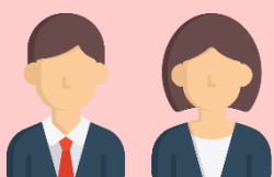
หัวหน้าส่วนงาน

ผลการประเมินการปฏิบัติงานประจำปีบัญชี 2560 ของอธิการบดีในภาพรวมอยู่ระหว่างระดับ “ดีมาก” ถึง “ดีเยี่ยม”