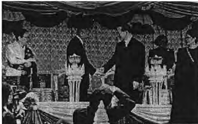
ภาพที่ 1: หนุ่ยฮัก พุมสะหวัน ประธานประเทศลาว และพระบาทสมเด็จพระเจ้าอยู่หัวฯ เป็นประธานในพิธีเปิดสะพานมิตรภาพ

สะพานมิตรภาพไทย - ลาว แห่งที่ 1 เป็นสะพานข้ามแม่น้ำโขงตอนล่างขนาดใหญ่แห่งแรก เชื่อมระหว่างหนองคาย ประเทศไทย กับนครหลวงเวียงจันทน์ สาธารณรัฐประชาธิปไตยประชาชนลาว โดยรัฐบาลออสเตรเลียได้มอบงบประมาณสนับสนุนจำนวน 42 ล้านดอลลาร์ออสเตรเลีย ในการสำรวจความเป็นไปได้ การออกแบบ และการก่อสร้าง ระหว่างปี พ.ศ. 2534-2537 ใช้เวลาดำเนินการประมาณ 2 ปีครึ่ง จนกระทั่งในวันที่ 8 เมษายน พ.ศ. 2537 พระบาทสมเด็จพระเจ้าอยู่หัวเสด็จพระราชดำเนินเป็นองค์ประธานในพิธีเปิดสะพานมิตรภาพ ร่วมกับ ฯพณฯ หนุ่ยฮัก พุมสะหวัน ประธานประเทศแห่งสปป. ลาวในขณะนั้น และ ฯพณฯ พลตรี คีตติง นายกรัฐมนตรีออสเตรเลียในขณะนั้น