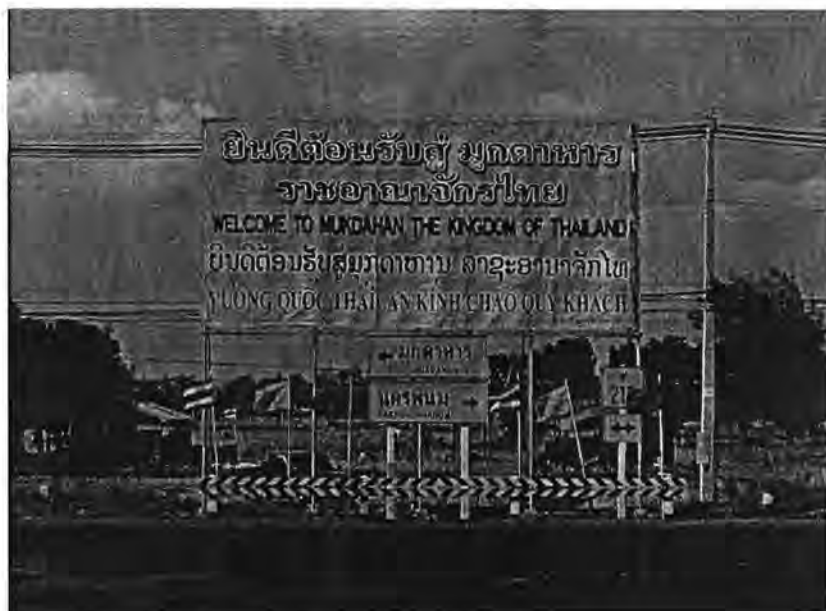
ภาพที่ 4 : ป้ายยินดีต้อนรับสู่มุกดาหาร ติดตั้งไว้บริเวณปากทางออกจากสะพาน มีข้อความ 4 ภาษา คือ ไทย อังกฤษ ลาว เวียดนาม

จากที่กล่าวข้างต้น จะเห็นได้ว่าสะพานมิตรภาพ 2 เป็นส่วนหนึ่งของเส้นทางคมนาคมขนส่งแห่งเดียวที่เชื่อมระหว่างทะเลอันดามันกับทะเลจีนใต้ ดังนั้นสะพานมิตรภาพ 2 จึงมิได้เป็นเพียงสะพานมิตรภาพระหว่างไทยและลาวเท่านั้น แต่ยังเป็นสะพานที่เชื่อมพม่า ไทย ลาว เวียดนาม ไว้ด้วยกัน (ธนพรรณ ธาณี และคณะ, 2547)