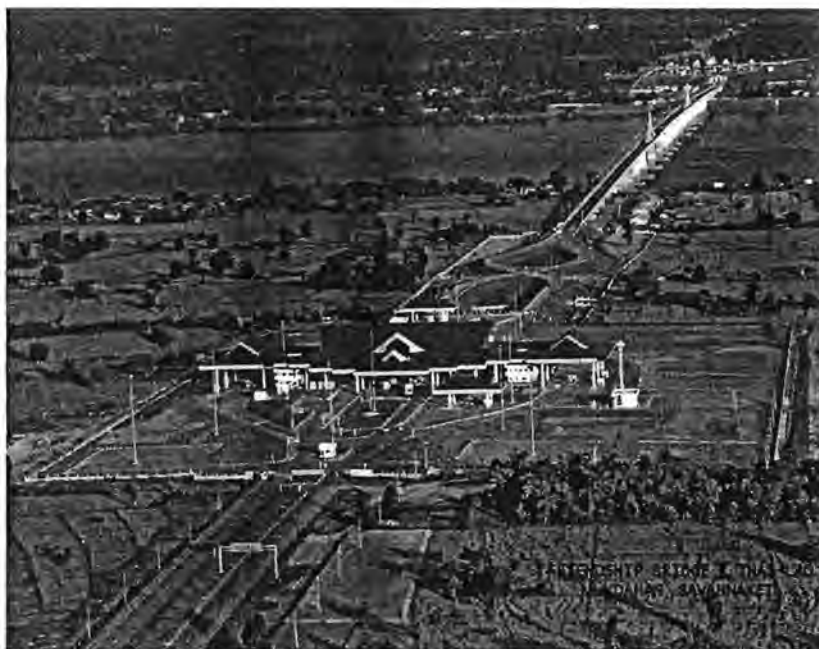
ภาพที่ 3 : โปสเตอร์รูปสะพานมิตรภาพ 2 ถ่ายจากฝั่งไทย

สำหรับรูปแบบสะพานนั้นเป็นสะพานคอนกรีต 2 ช่องจราจร ผิวจราจรกว้าง 8 เมตร ไหล่ทางข้างละ 1.50 เมตร ยาว 1,600 เมตร จุดกัลป์รถอยู่ฝั่งไทย ช่องทางสัญจรทางน้ำกว้าง 110 เมตร โครงสร้างเสากระโดงของสะพานออกแบบให้เหมือนกับการพนมมือไหว้ซึ่งเป็นวัฒนธรรมของทั้งไทยและลาว และมีชื่ออย่างเป็นทางการว่าสะพานมิตรภาพ 2 หรือ Friendship Bridge II