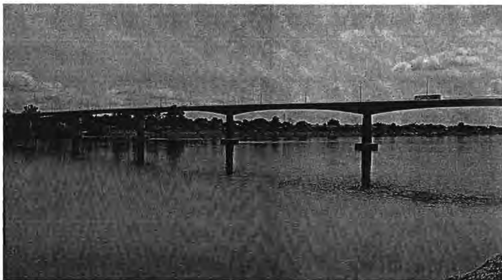
ภาพที่ 2 สะพานมิตรภาพไทย-ลาว หนองคาย-เวียงจันทน์

ในการขนส่งสินค้าซึ่งแต่เดิมขนถ่ายกันโดยใช้แพขนานยนต์ และยังเป็นการเปิดทางออกสู่ทะเลโดยสะดวกให้กับประเทศลาว สะพานแห่งนี้ยังคงมีความสำคัญในด้านการค้า ออสเตรเลียยังใช้โอกาสนี้ในความร่วมมือเพื่อพัฒนาภูมิภาคลุ่มน้ำโขง