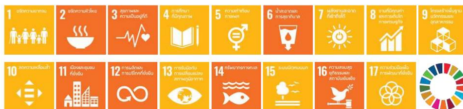
รูปที่ 1 ผลการประเมินสถานะของเป้าหมาย SDGs