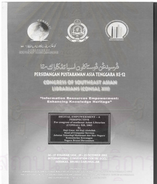
ตัวอย่างหน้าปกของบทความที่นำเสนอในการประชุม CONSAL XII

โดยวิธีการนำเสนอในประเภทที่ 1-2 ประกอบด้วยวิทยากร และผู้ดำเนินรายการ โดยผู้เข้าฟังสามารถซักถามและแสดงความคิดเห็นได้เมื่อจบการนำเสนอ ส่วนวิธีการนำเสนอประเภทที่ 3 จะมีประธานกลุ่ม 1 คน และผู้อำนวยความสะดวก 2 คน โดยให้ผู้เข้าฟังแบ่งออกเป็นกลุ่มย่อย อภิปราย ระดมความคิดเห็น นำเสนอ และหาข้อสรุปร่วมกัน